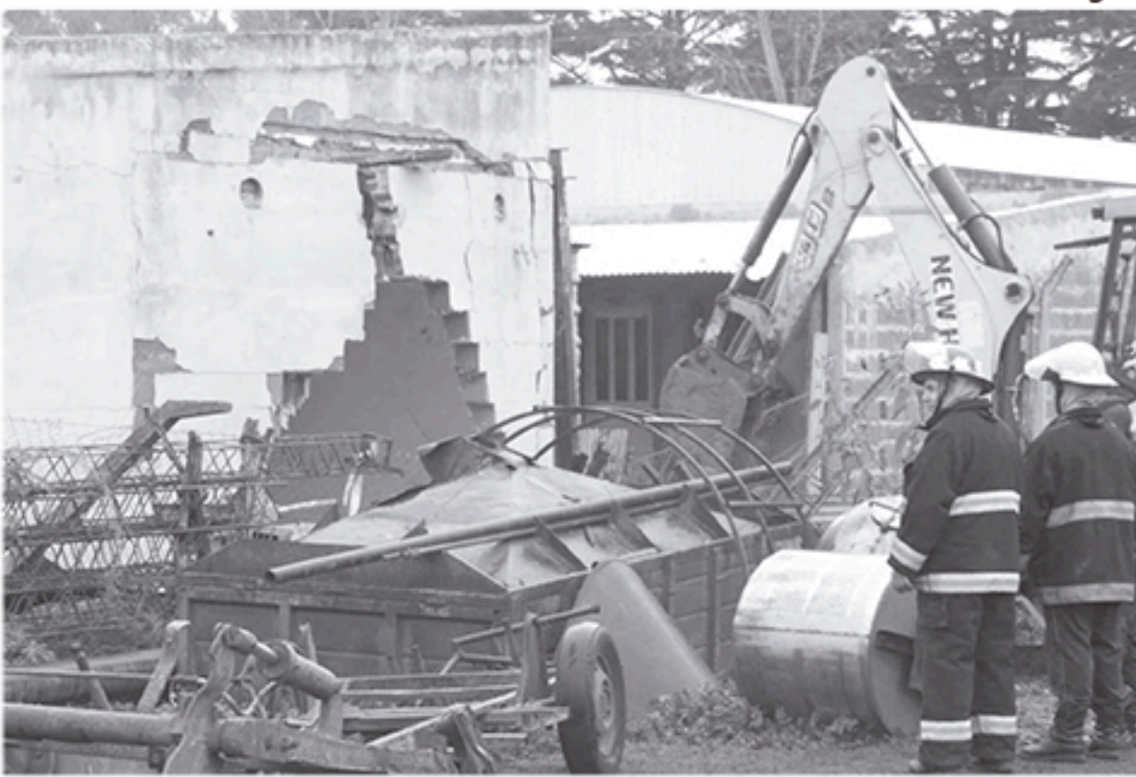
Elocuente imagen del daño que causó la explosión en el depósito de chacinados.

EL ECLIPSE DE SOL PODRÁ VERSE EN NUESTRA CIUDAD MAÑANA