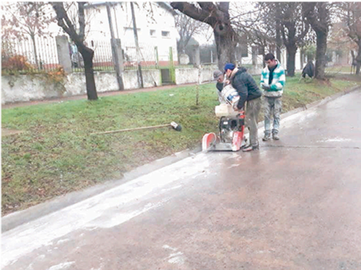
Vista del inicio de los trabajos en Av. Eva Perón.