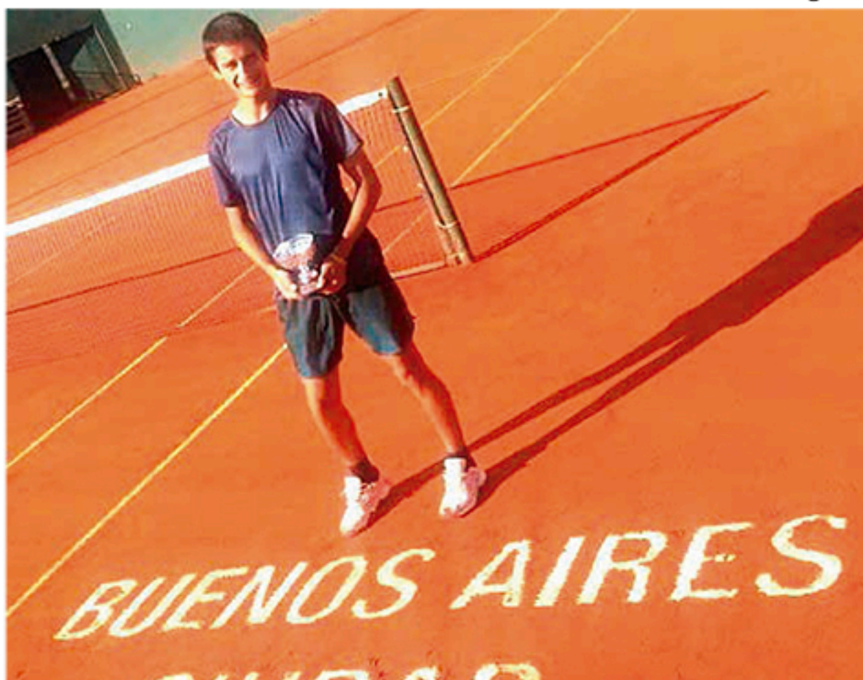
El joven tenista nuevejullense obtuvo un nuevo logro deportivo.