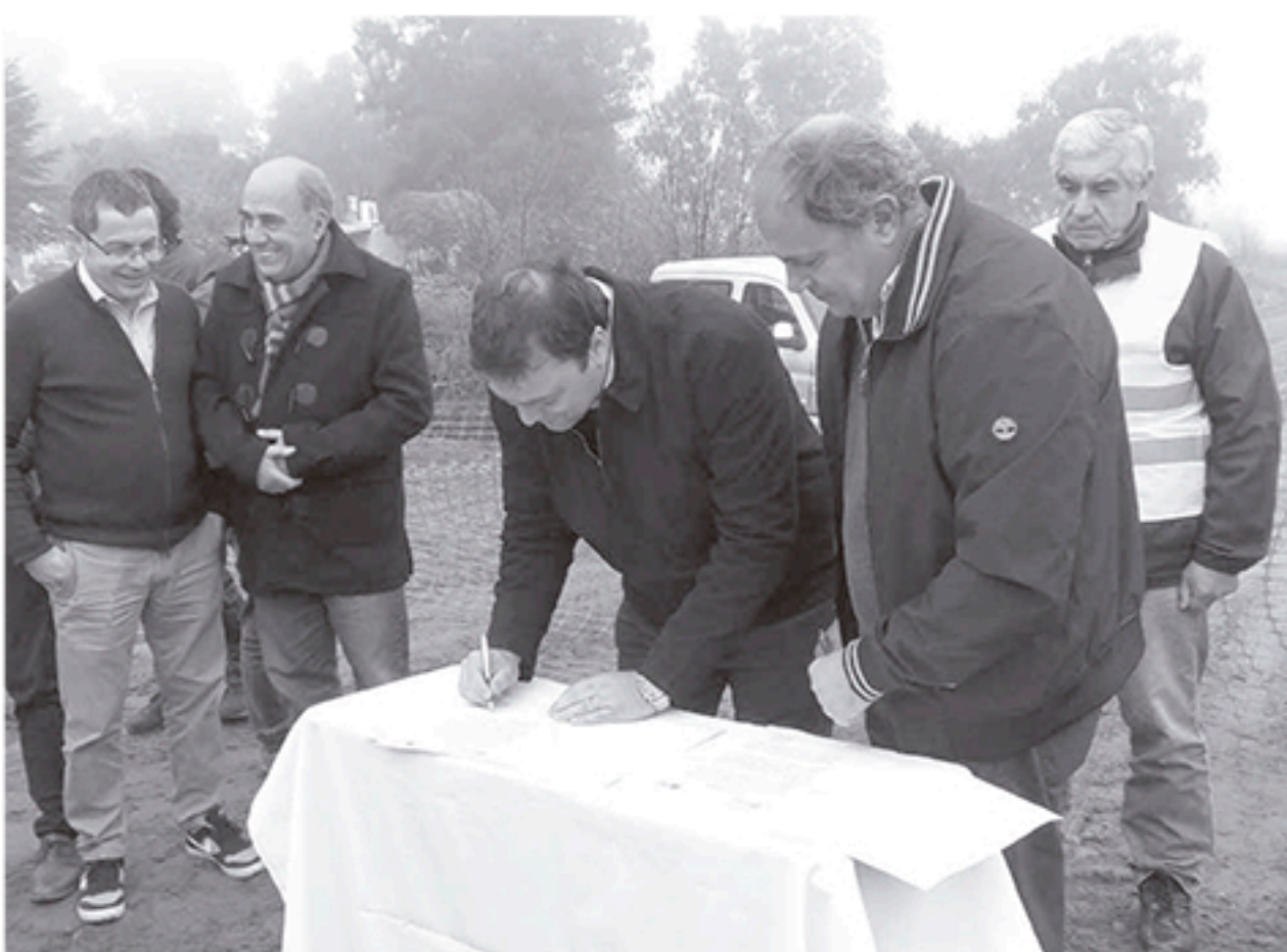
En sencillo acto protocolar se dieron inicio a las obras de pavimentación que demandarán seis meses de trabajo.