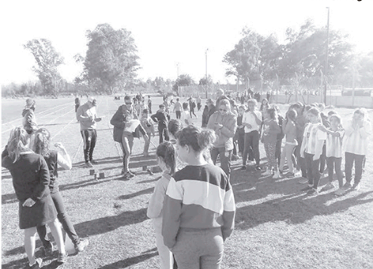
Alumnos de distintos establecimientos educativos participaron del importante proyecto desarrollado en San Martín.

Se extendió entre el lunes y ayer jueves - El nivel inicial se realizará el próximo lunes 20. Inf. en Pág. 2