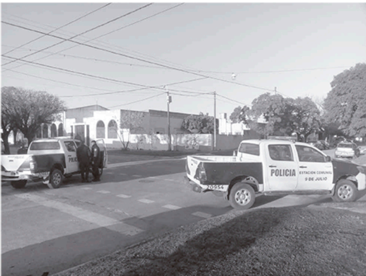
Vecinos de la Escuela Nro. 52 se vieron sorprendidos por el insólito hecho sucedido ayer.