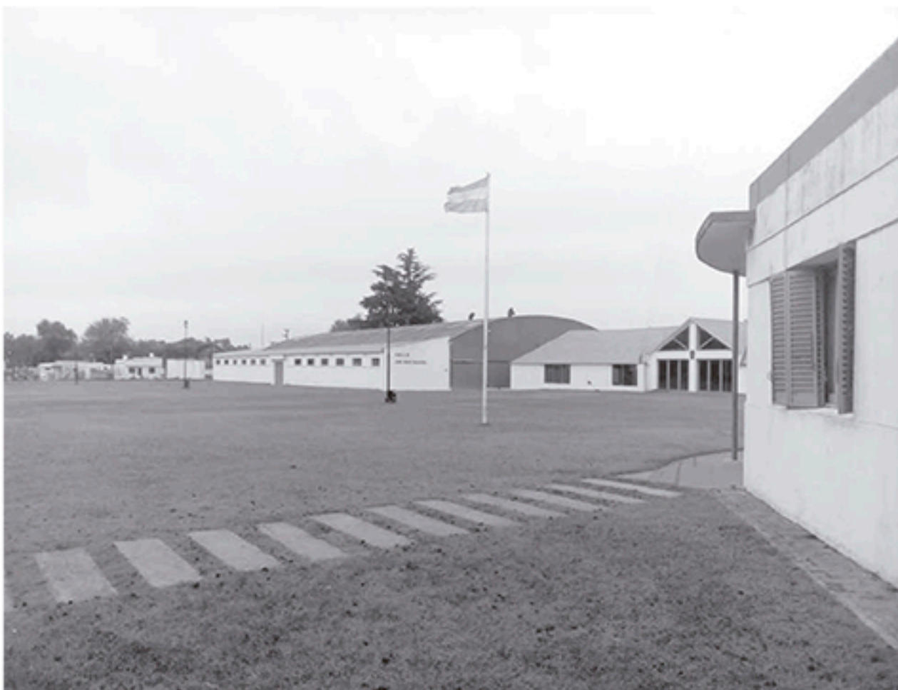
La entidad ruralista ya comenzó con la venta para la 122° Expo.