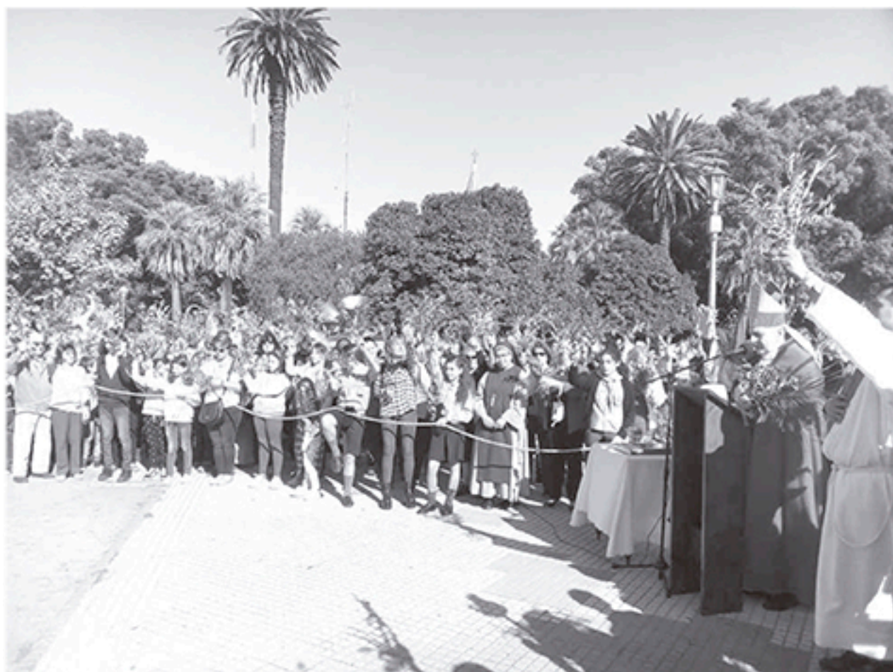
El Obispo realiza la bendición de ramos en el centro de la Plaza "Manuel Belgrano", ayer por la mañana.