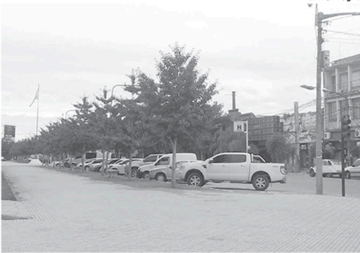
Las autoridades de Cepril esperan la resolución del Ejecutivo para la implementación del estacionamiento medido.