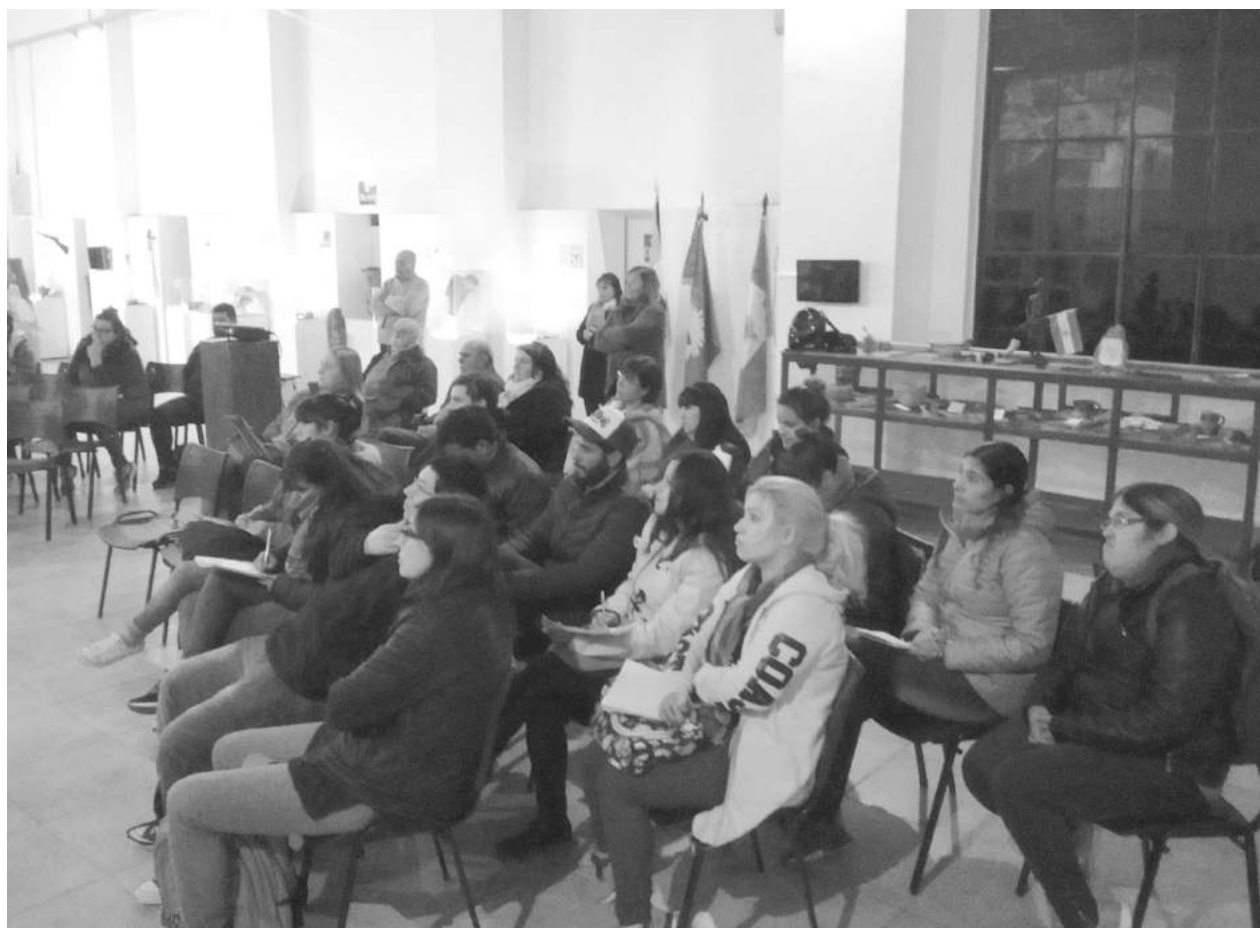
Asistentes a la jornada realizada el pasado martes sobre una eminencia de medicina: el Dr. Favalaro.