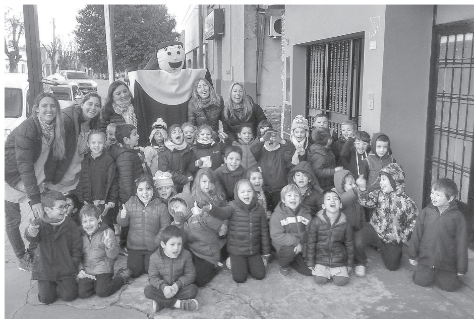
Alumnos y docentes de la Salita de 5 repartieron invitaciones a la misa del próximo domingo.