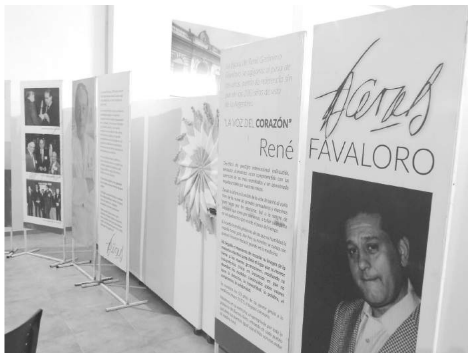
Recuerdo permanente para un luchador de la salud cuyo pedido de ayuda no fue entendido.