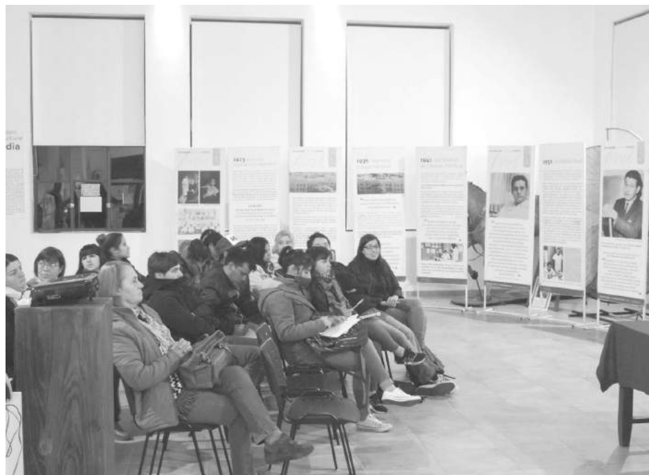
Enriquecedora muestra expuesta en el hall del museo local.

“Recordamos a un hombre de bien y de marcada claridad de pensamientos, y sobre quien, al cumplirse el año pasado 50 años del primer by pass, desde la Cámara de Se-