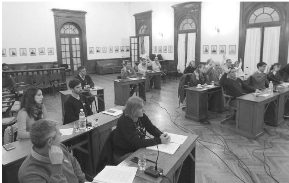
Con la mayoría de 13 votos a favor, 3 en contra y 2 abstenciones, se aprobó la Rendición de Cuentas.