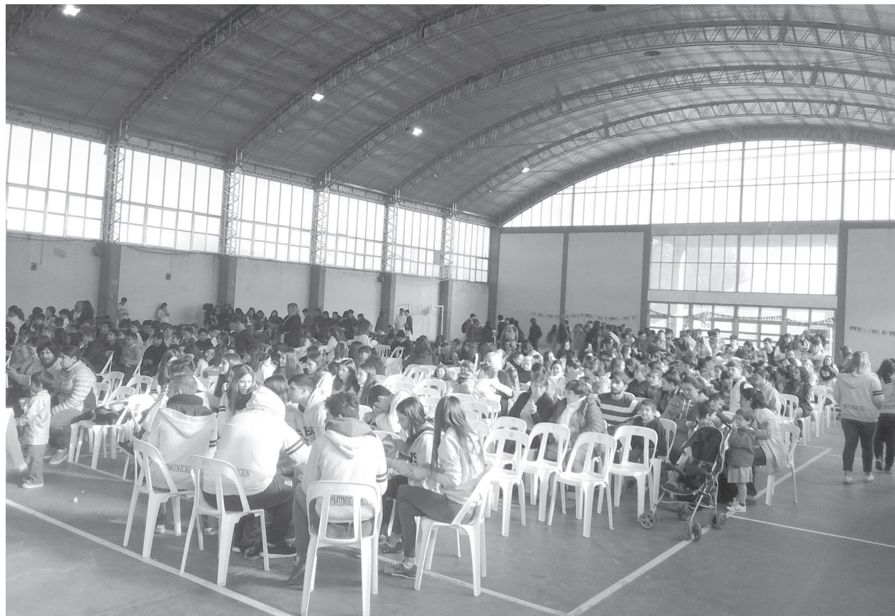
Alumnos y docentes de distintos niveles educativos se sumaron a "la movida" de la Escuela.