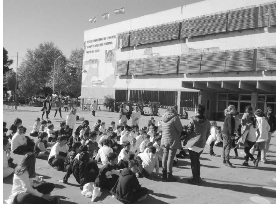
Una jornada a pleno sol con distintas actividades recreativas y una marcha por las calles de la ciudad.