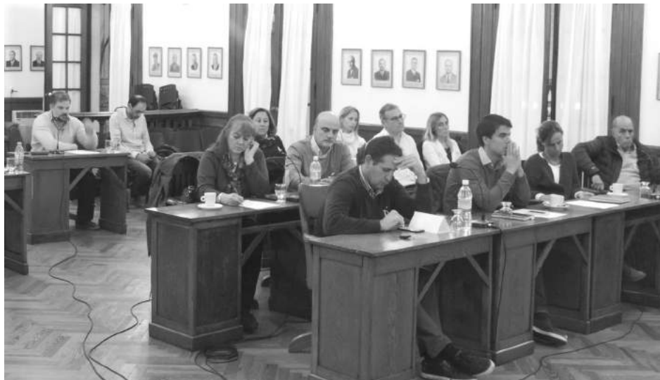
Bloques asistentes a la sesión especial del pasado viernes.