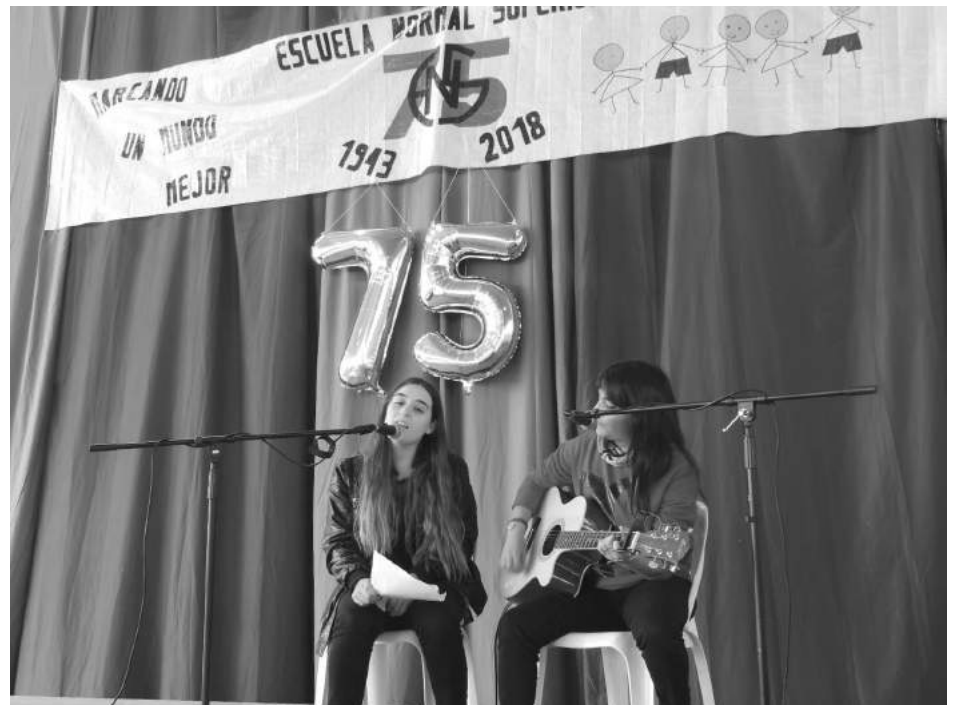
La música presente a través de jóvenes solistas y bandas que realizaron su actuación.

Finalmente, agradeció la permanente colaboración de la Asociación Cooperadora y confió en la pronta puesta en práctica de las obras proyectadas para el establecimiento, cuyo edificio cuenta con 44 años, reconociendo la preocupación de reactivar el proyecto de las actuales autoridades.