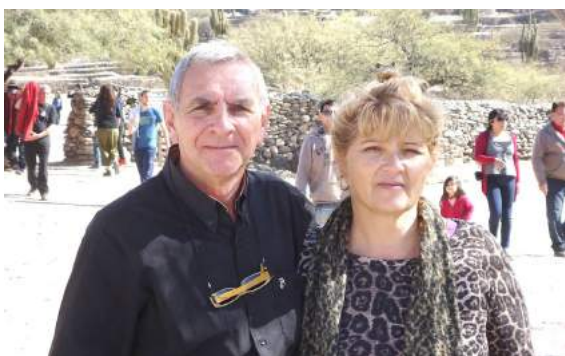
Conduce: Héctor Rodolfo Tinetti Cámaras: Micaela María Petetta