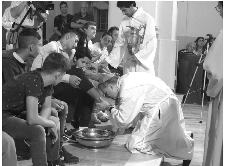
Momento en que el Obispo realiza el lavado de pies el Jueves Santo.

"En ese gesto está condensado todo el Evangelio - aseguró el prelado-. De rodillas ante el hermano. Este es el lugar de la Iglesia. El que debemos estar todos los creyentes. Así lo enseña Jesús a la hora de dejar su testamento espiritual, donde condensa toda su enseñanza a través del elocuente gesto del lavatorio de los pies. Alguno podrá decir que no se arrodilla ante nadie y eso es válido si se entiende en el sentido de no doblegarnos ante los poderosos y ser fieles a nuestros principios y convicciones". Asimismo manifestó su deseo para que todos puedan renovar su vocación solidaria "El Señor, como Maestro, nos enseña a vivir de rodillas ante los pequeños, los pobres y los necesitados. No tengamos miedo a ponernos de rodillas ante ellos. Sólo allí, de rodillas, mirando desde abajo a los más pequeños somos capaces de contemplar la grandeza de la dignidad de cada