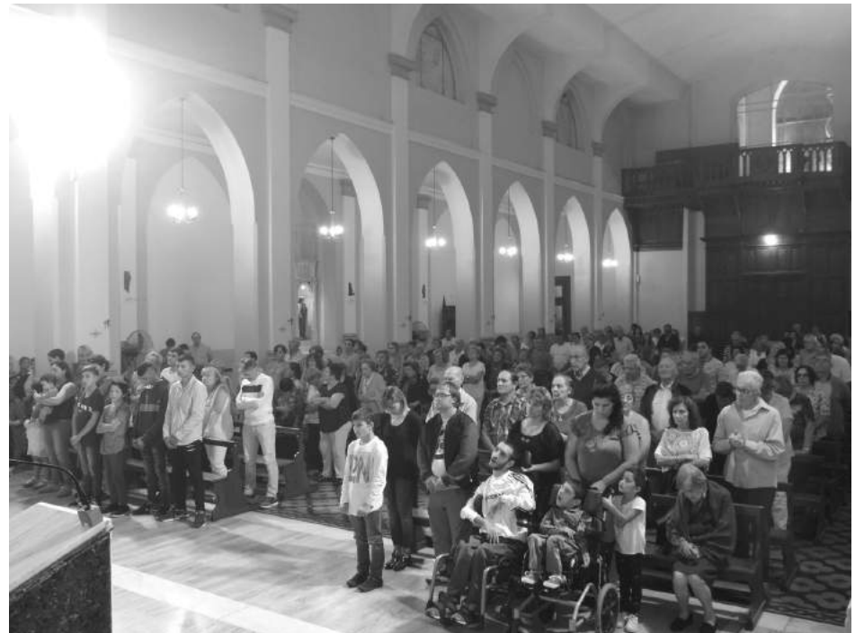
Fieles que asistieron a la celebración de Semana Santa en Catedral.