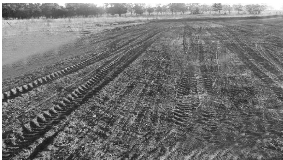
Vista del terreno cedido por Cáritas al club de fútbol.

“Que el mensaje de paz que Jesús y María dejaron al mundo, viva como una llama encendida dentro nuestro”