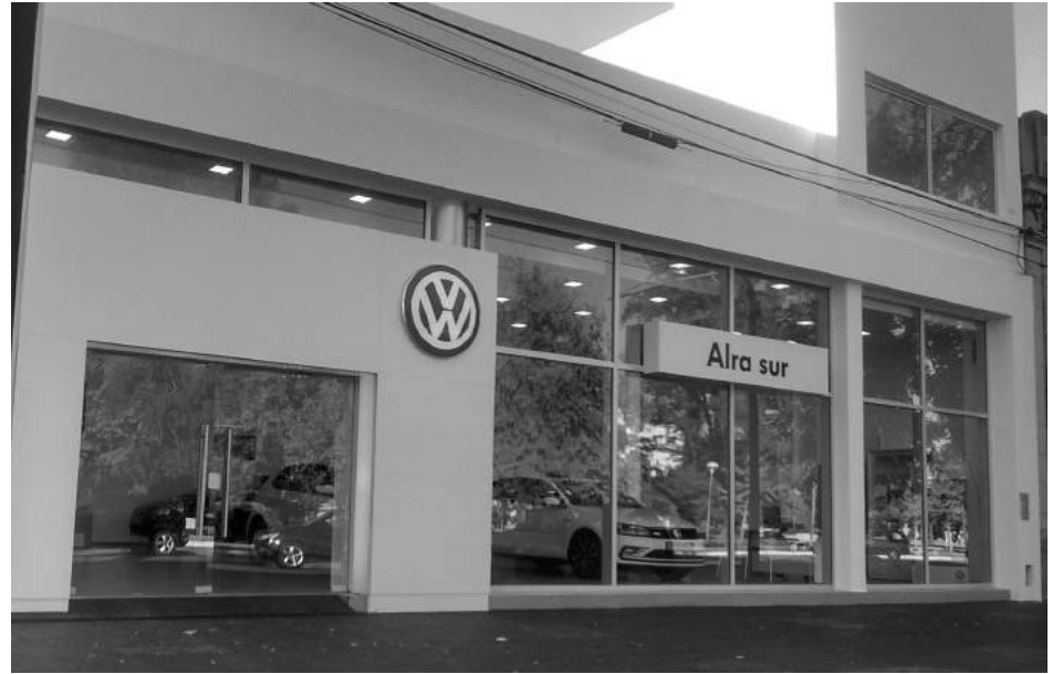
Frente del nuevo local ubicado en Av. San Martín casi Libertad.

El pasado miércoles, Alra Sur 9 de Julio, agente oficial de Volkswagen Argentina en 9 de Julio, presentó su nuevo salón de exposición y ventas, ubicado en Av. San Martín 1271, a la vez que mostró en sociedad el VW Virtus, la nueva unidad de la automotriz alemana.