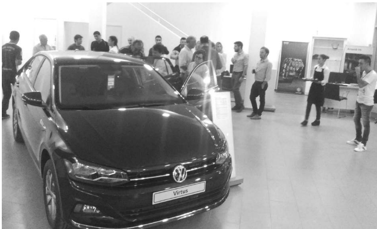
Alra Sur presentó una nueva joya mecánica y su nuevo local de ventas.