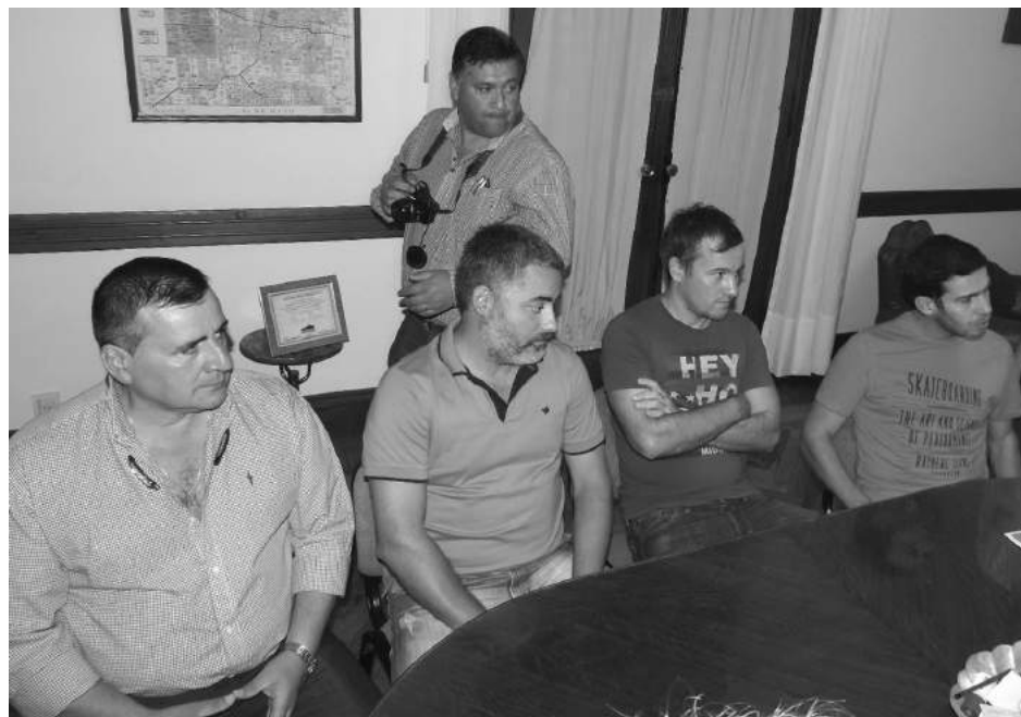
Directivos de A. Alvarez, Libertad, Quiroga y San Agustín recibieron dinero a través del programa provincial "Clubes de Barrio".

Se vieron beneficiados en esta oportunidad el Club Deportivo San Agustín, Atlético Quiroga, Libertad y