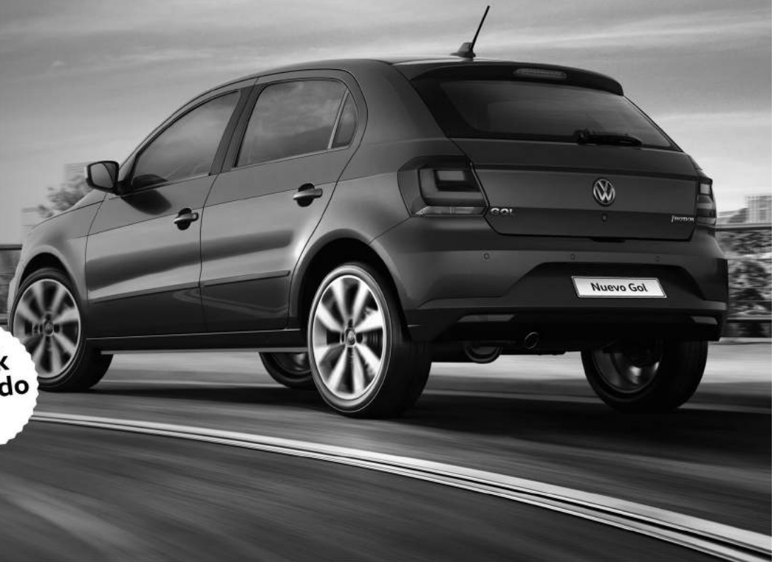
Imagen no contractual. Bases y condiciones disponibles en nuestro salón.