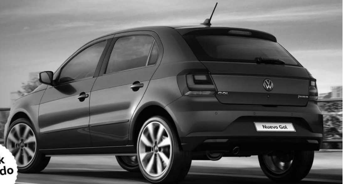
Imagen no contractual. Bases y condiciones disponibles en nuestro salón.