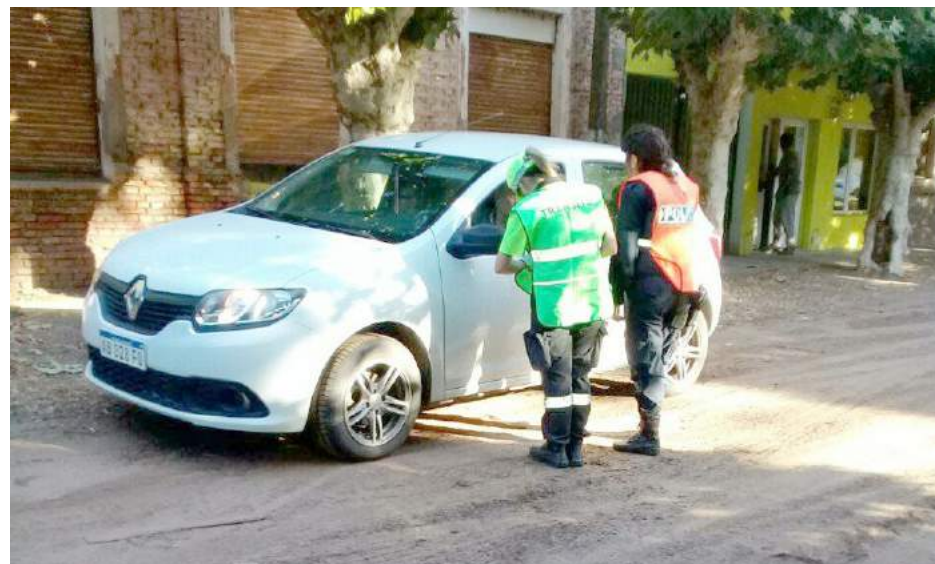
Personal de Policial y Tránsito realizando controles en la vía pública.

De la misma manera, en la localidad de La Niña,