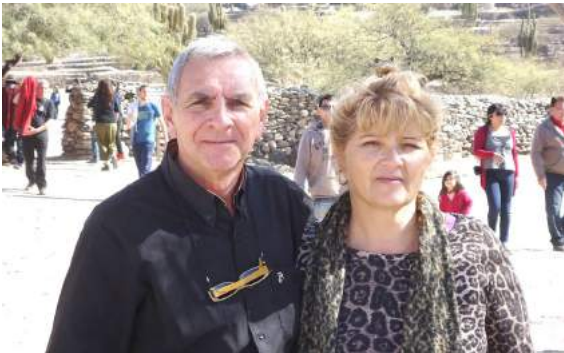
Conduce: Héctor Rodolfo Tinetti Cámaras: Micaela María Petetta