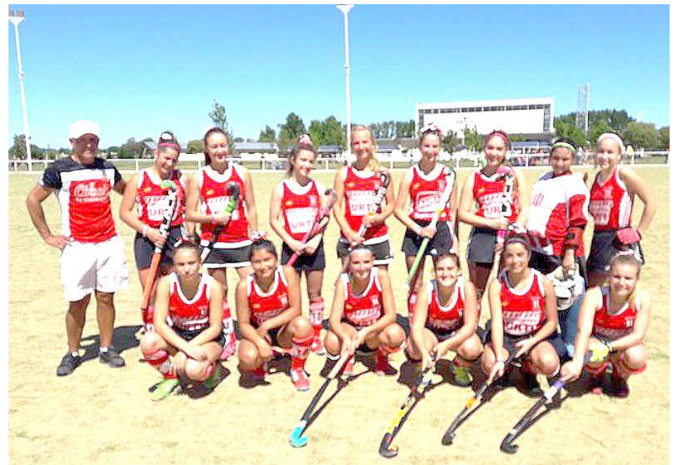
Equipo de 5ª, campeón del Torneo 2017.

Atlético tiene un importante compromiso porque, además de las condiciones del rival debe ratificar lo hecho el año pasado, cuando se consagró campeón en las divisiones 7ª y 5ª y tercero en 6ª, perdiendo por penales y con un solo partido perdido en todo el año; para ello se ha preparado