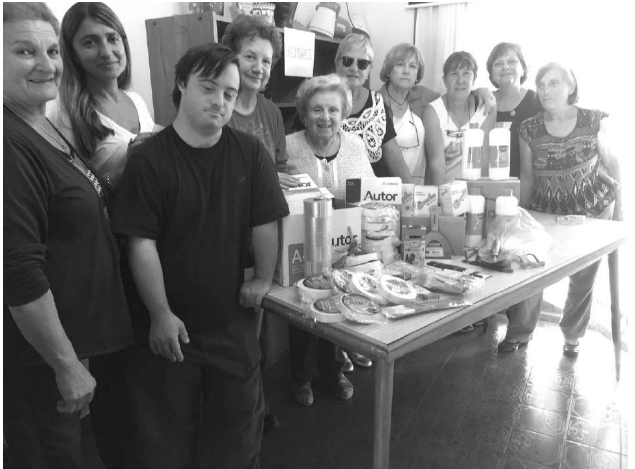
Autoridades del Club de Leones y AFAPDi, junto al material entregado.

El Club de Leones de Nueve de Julio, en el marco de su permanente tarea comunitaria en favor de la comunidad, entregó una importante donación a la Asociación Familiares y Amigos de Personas Discapacitadas – AFAPDi-, consistente en material apto para el desenvolvimiento de talleres de la institución, el que fue adquirido a través de un Bono Contribución lanzado oportunamente en la comunidad.