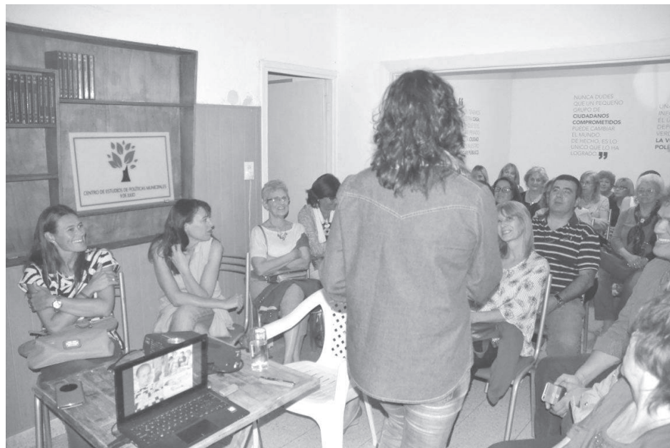
Importante concurrencia en el inicio del ciclo de charlas.

“La idea del grupo es ir debatiendo distintas problemáticas en el seno de nuestra ONG, las que luego puedan ir generando soluciones para la comunidad”, señaló.