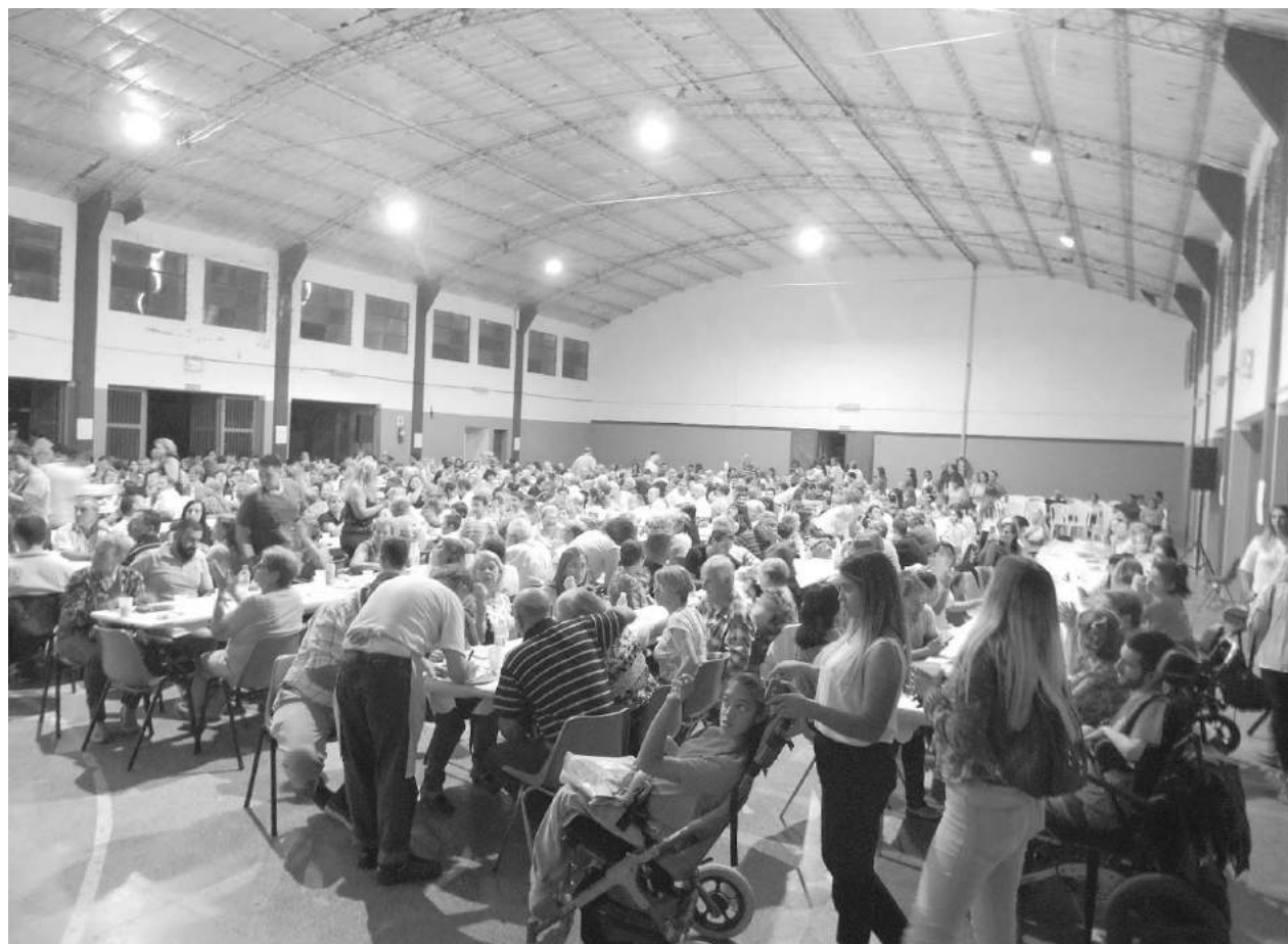
El llamado solidario tuvo su respuesta con el público acompañando en la noche del sábado.