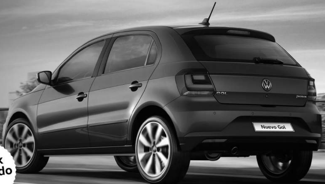
Imagen no contractual. Bases y condiciones disponibles en nuestro salón.