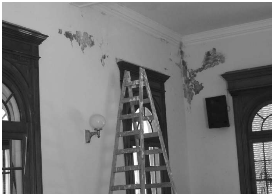
El objetivo es dejarla en condiciones para el inicio de sesiones ordinarias el próximo 3 de Abril.

El recinto de sesiones del H. Concejo Deliberante local, ubicado en la planta alta del Palacio Municipal, es objeto por estas horas de obras de refacción en su techo y parte de la mampostería,