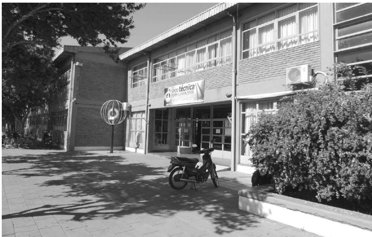
El establecimiento educativo cuenta ahora con tres impresoras 3D de última generación.

De esta manera, con otras dos máquinas similares, se le dará especial impulso a esta tecnología - "Ya se han desarrollado algunas experiencias para automóviles de competición e inyección de plástico, dado que la impresión 3D nos permite tener en pocos minutos una pieza que en otros tiempos requería de muchas etapas, procesos y tiempo; con la posibilidad de errores; todo lo que hoy se ha superado en base a esta tecnología", explicó el director del establecimiento. Inf. en Pág. 2.