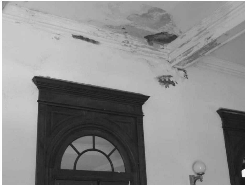
La sala del HCD se refacciona nuevamente por humedad y algunas filtraciones.

Se aguarda que las obras queden concluidas para el inicio de un nuevo período de sesiones ordinarias, el 3 de abril.