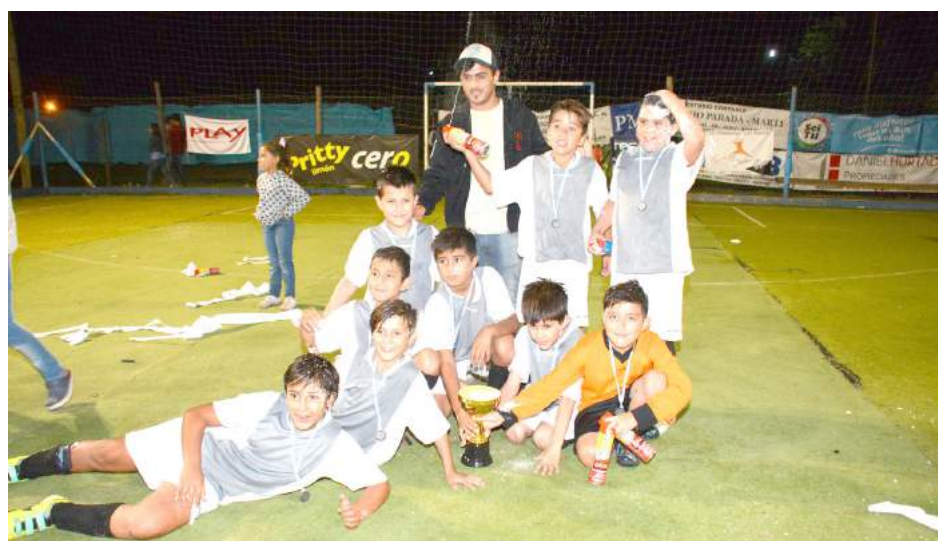
Transporte El Burguesito Cat. 2007.