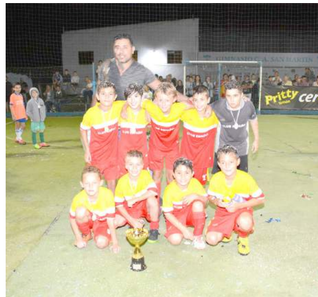
Club Español cat. 2008