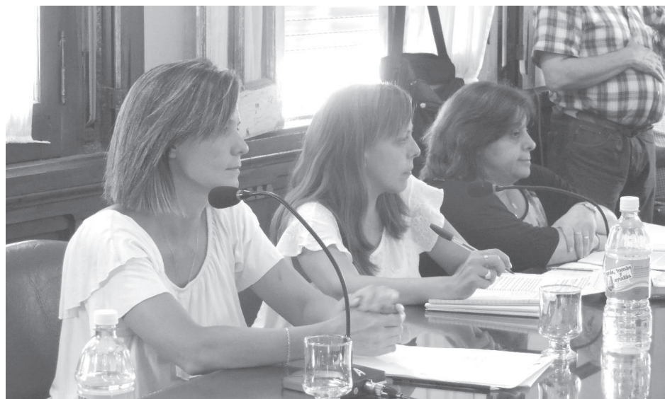
Mesa de presidencia del HCD que condujo la sesión de anoche. Foto De Sogós.

"Las otras dos documentaciones están relacionadas. Por un lado, se solicita el cambio de indicadores urbanísticos para un lote", comenzó diciendo la Presidente del HCD, quien detalló "se trata de un pedido de dos vecinos, que tienen un lote en Antártida Argentina