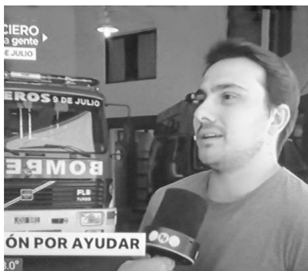
Juan Manuel Gentiletti fue quien filmó y subió el video a las redes sociales.

En un momento en que las redes sociales ocupan un lugar relevante a la hora de difundir imágenes de actualidad al instante, mediante un celular, Juan Manuel Gentiletti realizó un video donde se puede ver en acción a los Bomberos Voluntarios de nuestra ciudad, pero no en un siniestro, sino desde el momento que suena la sirena hasta que sale la dotación a cumplir con su noble tarea.