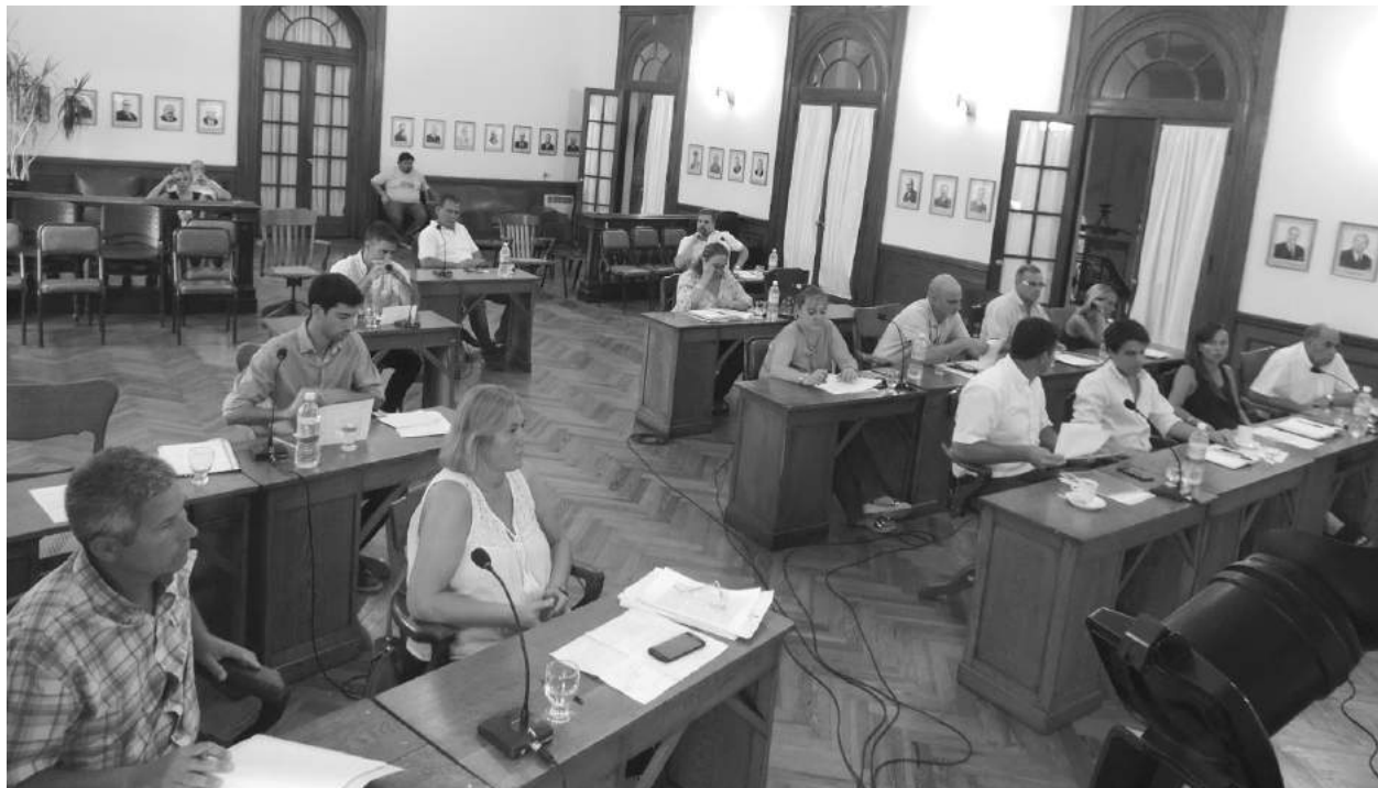
Por mayoría de concejales se aprobó la adhesión a la Ley de Responsabilidad Fiscal.

El lote estaría ubicado a 7 km al este del centro de la ciudad y tiene la aprobación de OPDS. Inf. Pág.2