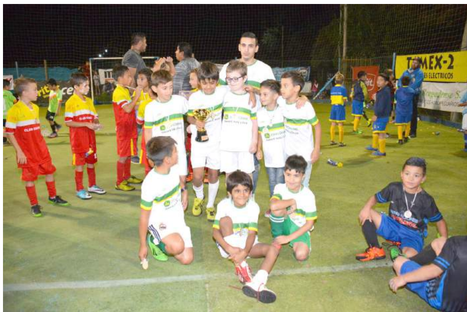
John Deere cat. 2008