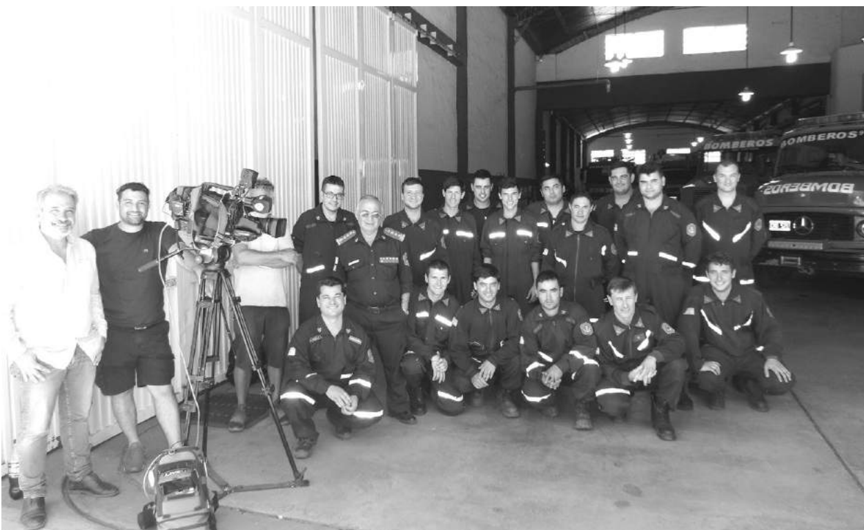
Grupo de bomberos junto al equipo de Telefé que transmitió en vivo el novedoso informe.