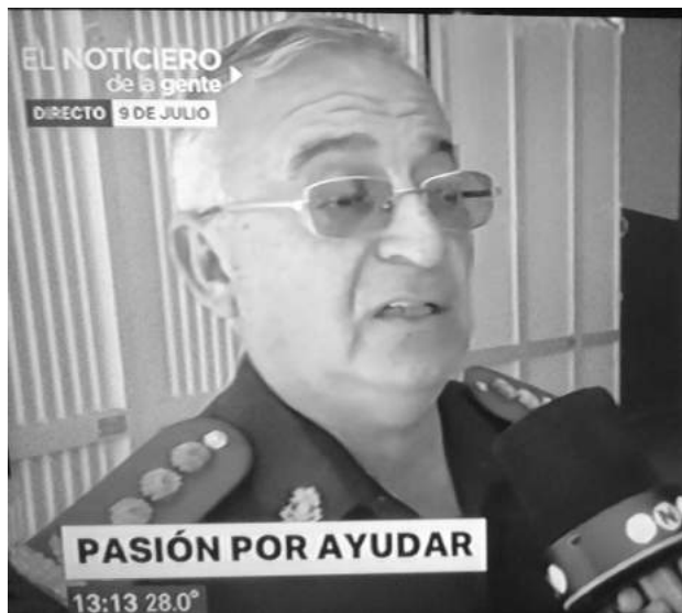
El Comandante Márquez sorprendido por la grata noticia.