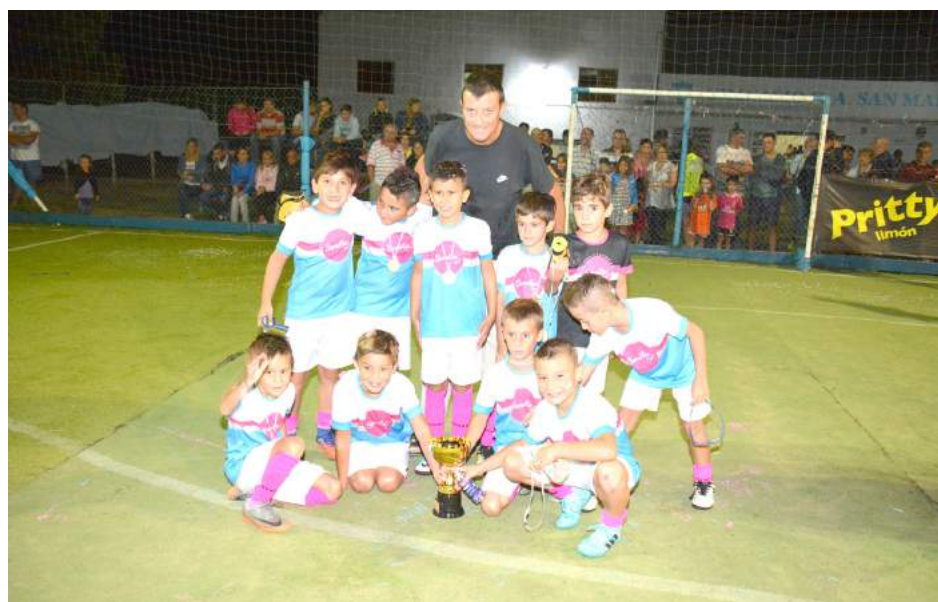
ServiTec. cat. 2009