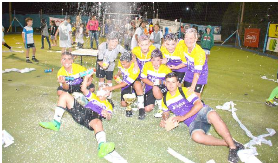
Colorshop cat. 2007.