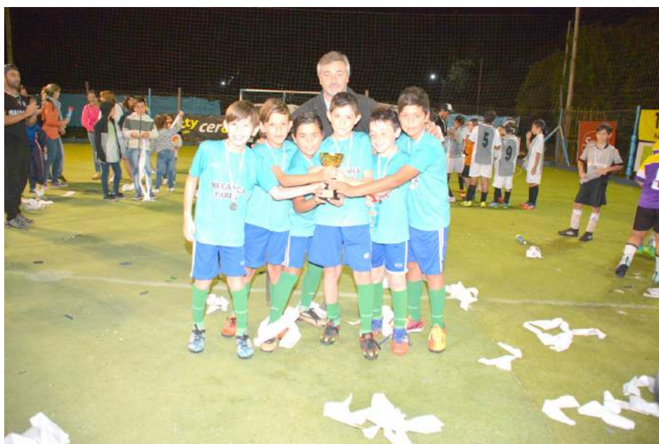
Mecánica Fabián cat. 2007