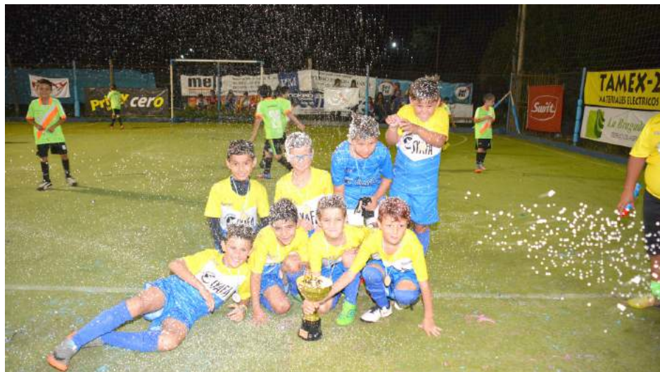
Syafa Cat. 2009