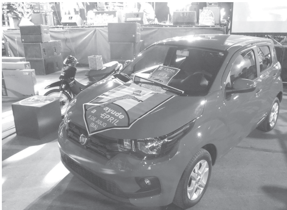
El vehículo 0km Fiat de CEPRIL que fue sorteado favoreció al vecino Carlos Vélez.