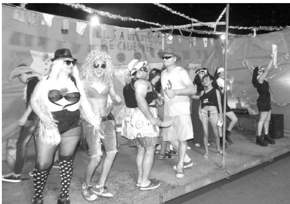
La carroza "Los Auténticos Recalientes" animó la primera noche.

Una multitud acompañó la apertura de los Corsos de Patricios