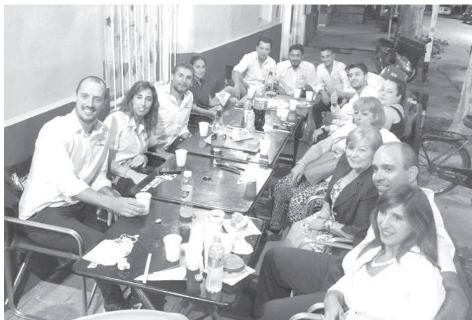
Directivos de La Fama y personal compartieron el 60o. aniversario de la firma.