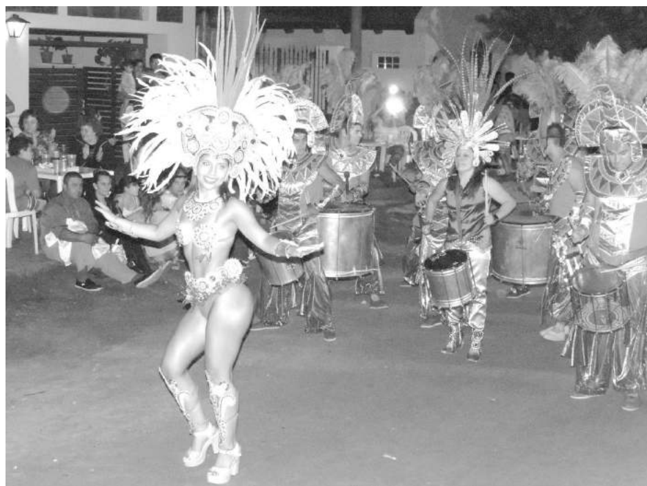
Ritmo, colorido y belleza presentes en la gran noche de Patricios.