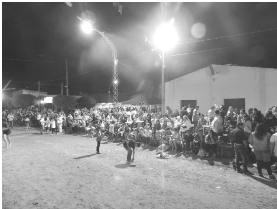
Gran cantidad de público se sumó a la propuesta de la gente de la Sociedad de Fomento y otras instituciones.

Tal como se venía anunciando, en la noche del sábado, desde las 22 hs., dieron comienzo los corsos de la localidad de Patricios, con un amplio programa en su agenda carnavalesca, que congregaron a una verdadera multitud.