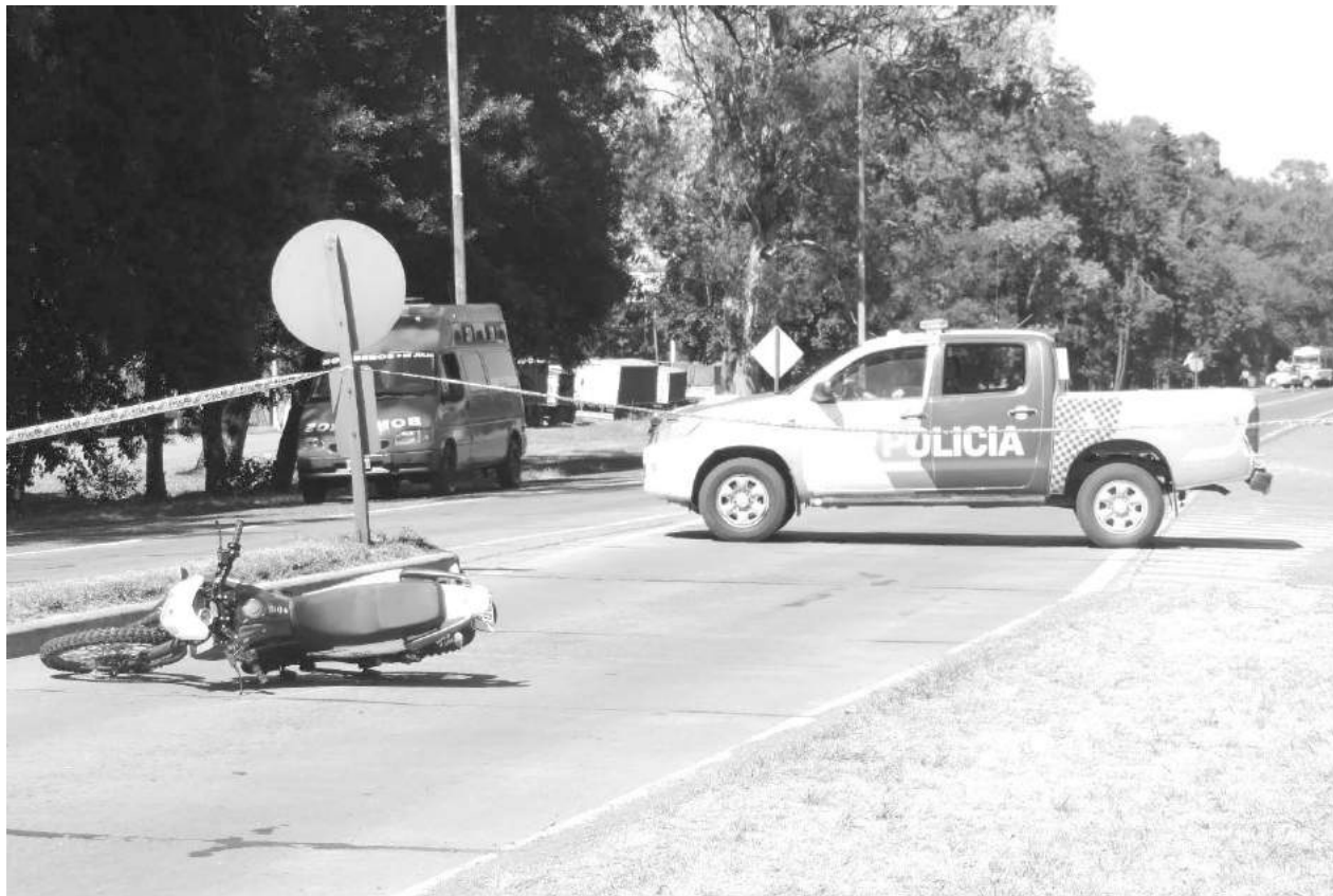
La Motomel 200 cc tirada sobre el asfalto de la ruta donde trabajó Policía, Bomberos y personal del peaje.