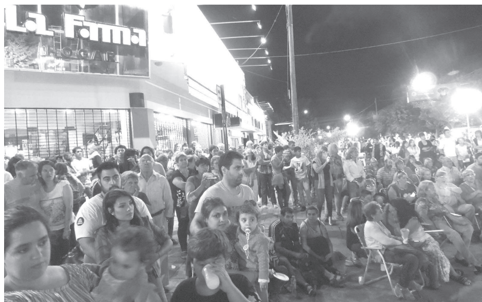
Clientes, amigos y público en general, se acercaron al gran festejo el pasado viernes.