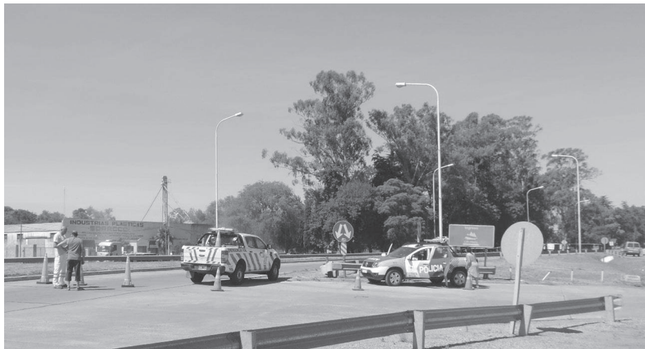
Varias horas permaneció cortado el tránsito por Ruta 5 debido al siniestro.