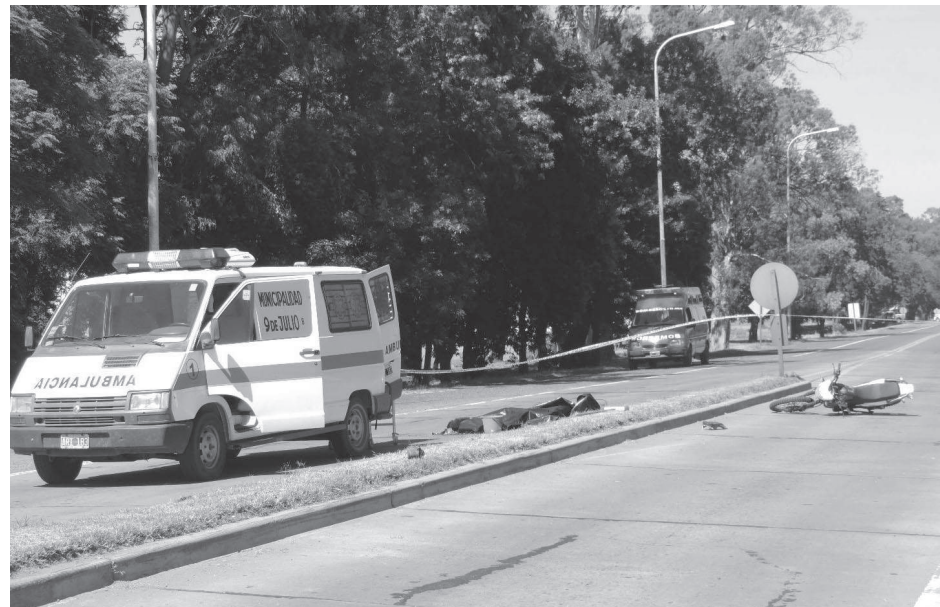
Una ambulancia municipal trasladó el cuerpo a la ciudad de Chivilcoy para la práctica de la autopsia.