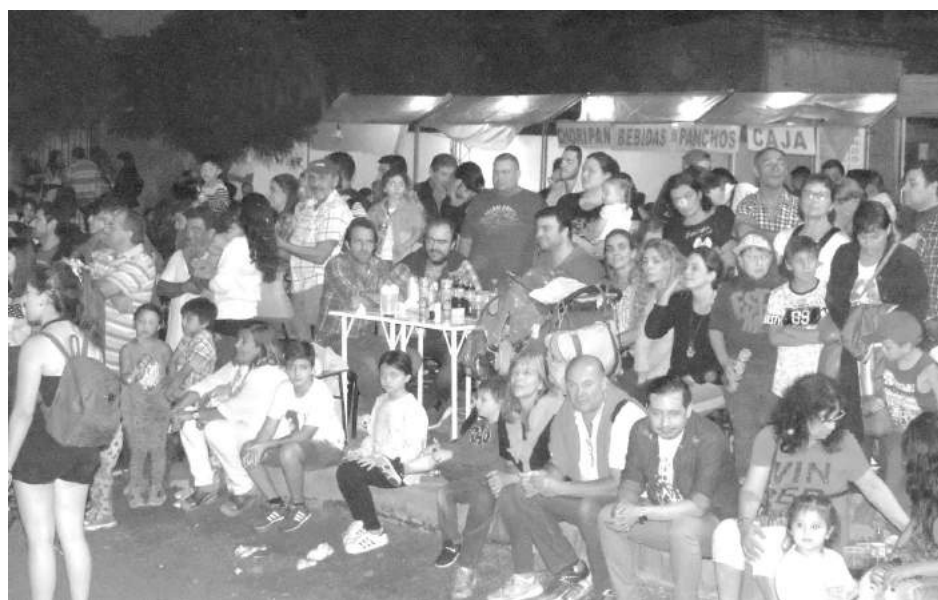
Autoridades municipales acompañaron el inicio de los Corsos 2018.

Una multitud acompañó la apertura de los Corsos de Patricios