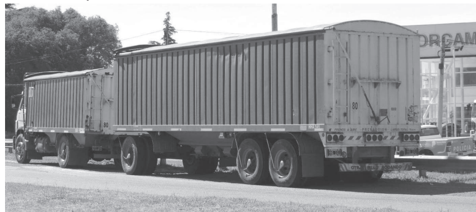
El camión Volkswagen protagonista del lamentable accidente.