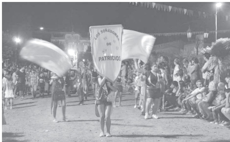
Esta noche se ponen en marcha los cursos y bailes tradicionales de Patricios.