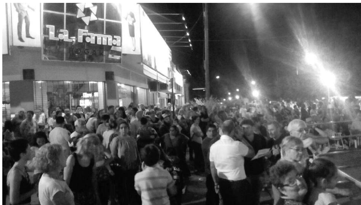
Una gran cantidad de vecinos se hicieron presentes para disfrutar de la fiesta aniversario de La Fama.

En la noche de ayer, La Fama Hogar 9 de Julio, festejó sus 60 años de trayectoria comercial en la ciudad con una espectacular fiesta aniversario que se llevó adelante desde las 20 hs., frente al local comercial ubicado en 25 de Mayo y Salta, donde se realizaron sorteos de órdenes de compra, motocicletas y un Renault Sandero 0 km, acompañados de shows musicales de primer nivel y servicio de cantina. Ampliaremos en nuestra próxima edición.