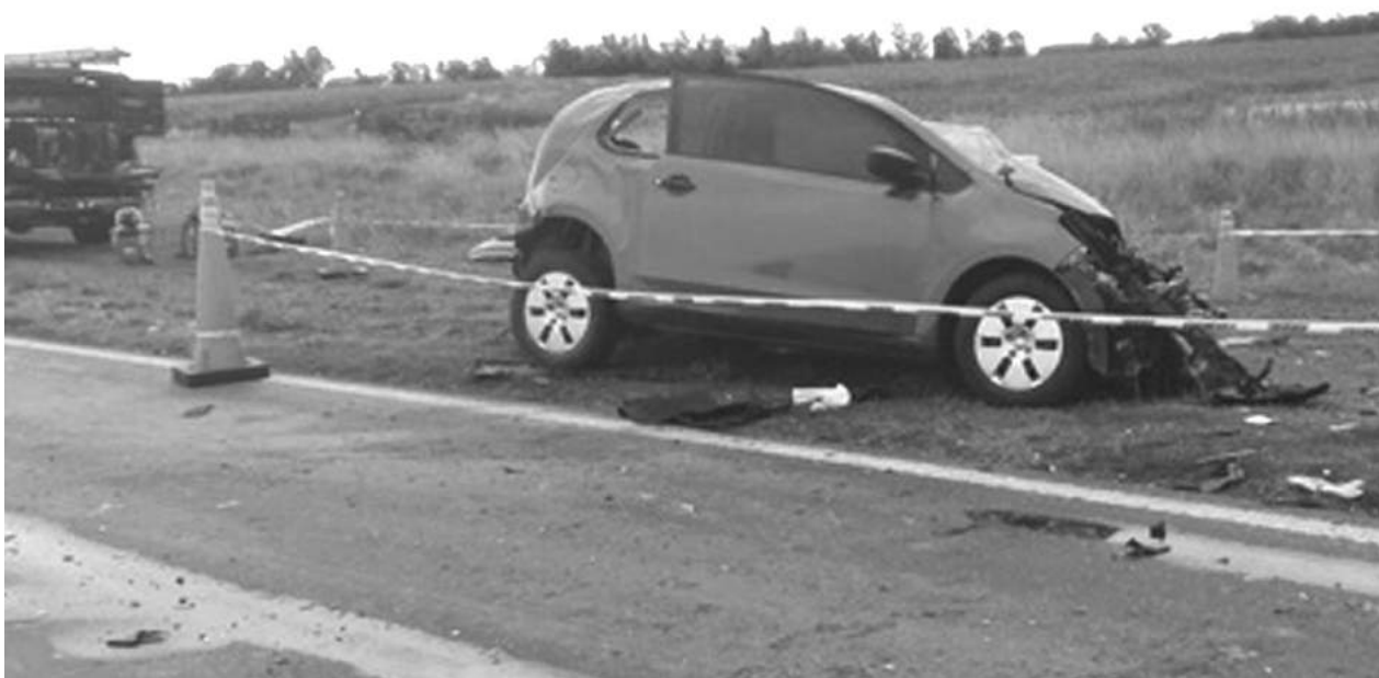
Automóvil en que viajaba el vecino oriundo de 12 de Octubre que perdió la vida.