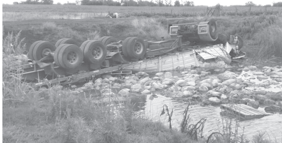
El camión quedó con las ruedas hacia arriba tras el fuerte impacto.

El informe policial, suministrado por la Estación de Policía Comunal de General Viamonte, jurisdicción donde se produjo el accidente, consigna que "con fecha 21/12/2017, alrededor de las 05:00 hs se tomó conocimiento de accidente de tránsito producido en Ruta Pcial. 65 a unos 4.000 metros de Comando Patrulla Rural Gral. Viamonte en dirección Junín - 9 de Julio entre un camión marca Mercedes Benz guiado por masculino mayor de edad oriundo de la localidad de San Nicolás y un automóvil marca Volkswagen guiado por un masculino mayor de edad oriundo de 9 de Julio. Como consecuencia de ello, se produce el deceso del masculino conductor del automóvil, cuyo cuerpo fue trasladado a Morgue de la localidad de Junín, mientras