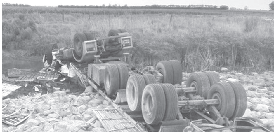
El transporte viajaba cargado con bolsas de cemento.

que el restante ciudadano fue trasladado al hospital local para su atención.