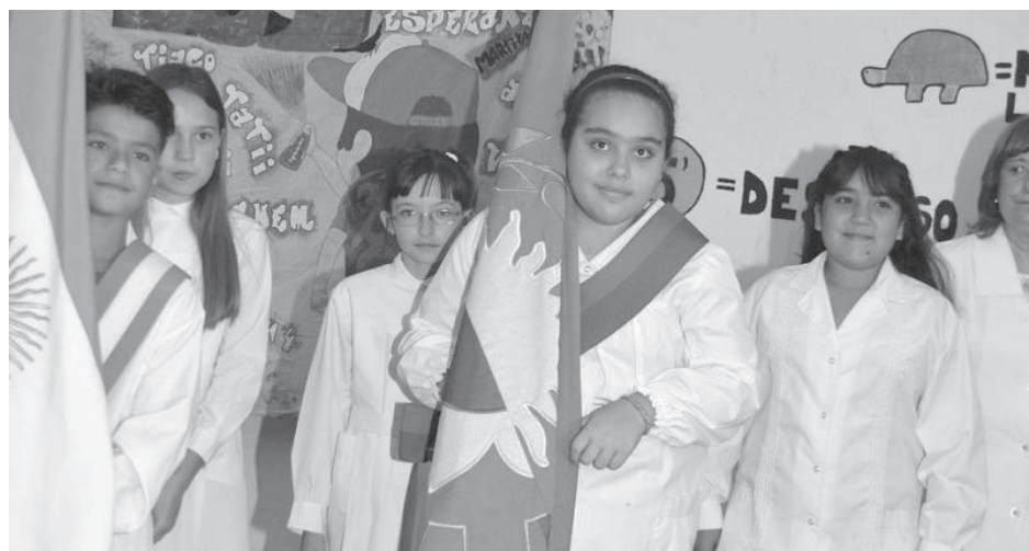
En la jornada del miércoles 20, la Escuela Nro. 4 "Manuel Belgrano", desarrolló junto a la comunidad educativa el acto de fin de curso y la entrega de diplomas a los egresados 2017 del Nivel Primario, el que fue acompañado por toda la comunidad educativa.