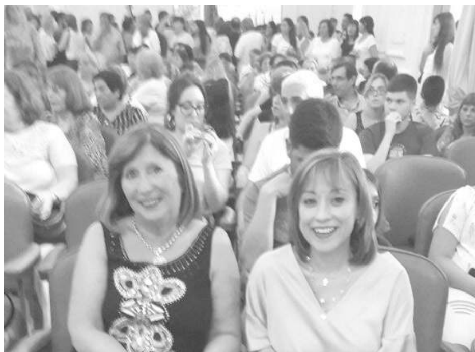
Autoridades educativas y municipales acompañaron el acto académico.

En la noche del miércoles, en el Salón Blanco del Palacio Municipal, se desarrolló el acto académico de entrega de diplomas a alumnos egresados del Plan FINES, (Plan de Finalización de Estudios Secundarios). Tras el ingreso de las banderas y egresados, se dirigió a los presentes un alumno