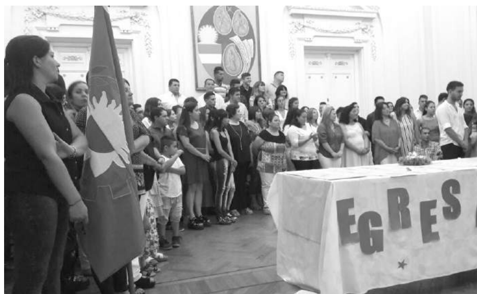
La ceremonia se realizó el miércoles en el Salón Blanco Municipal.