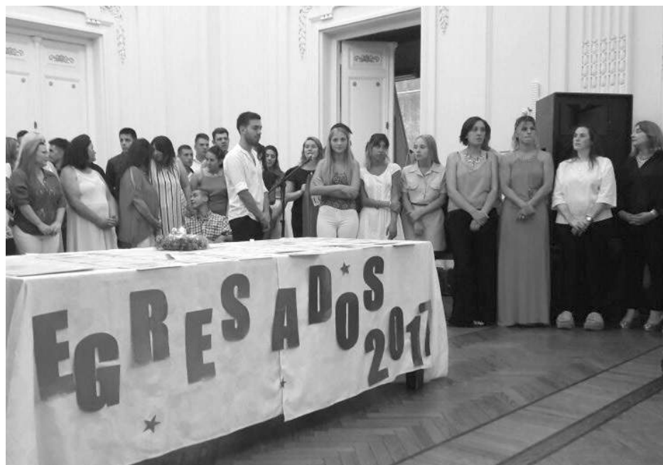
Egresados que recibieron el correspondiente diploma de finalización de curso.