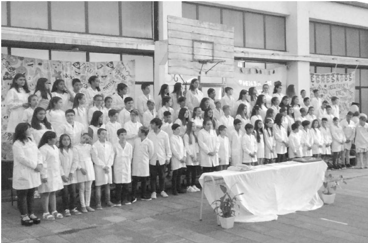
Alumnos de los tres 6to. años que egresaron el pasado miércoles en la Escuela Nro. 4.

En la oportunidad, tras los actos protocolares, se procedió a la entrega de diplomas a los 81 egresados de 6to. año A, B y C, y se presentaron videos preparados por los distintos cursos.