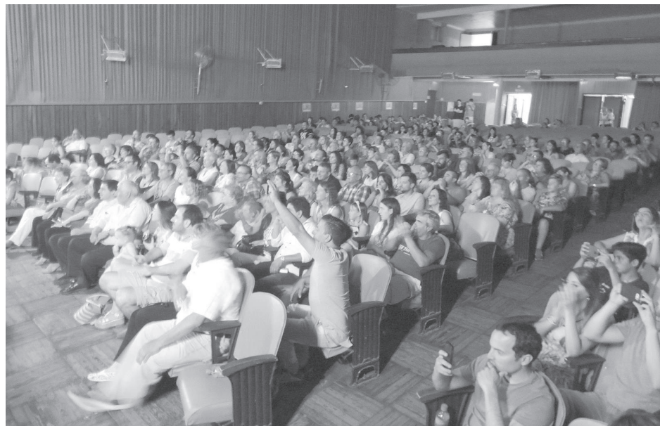
A sala llena se desarrollo la importante muestra anual.