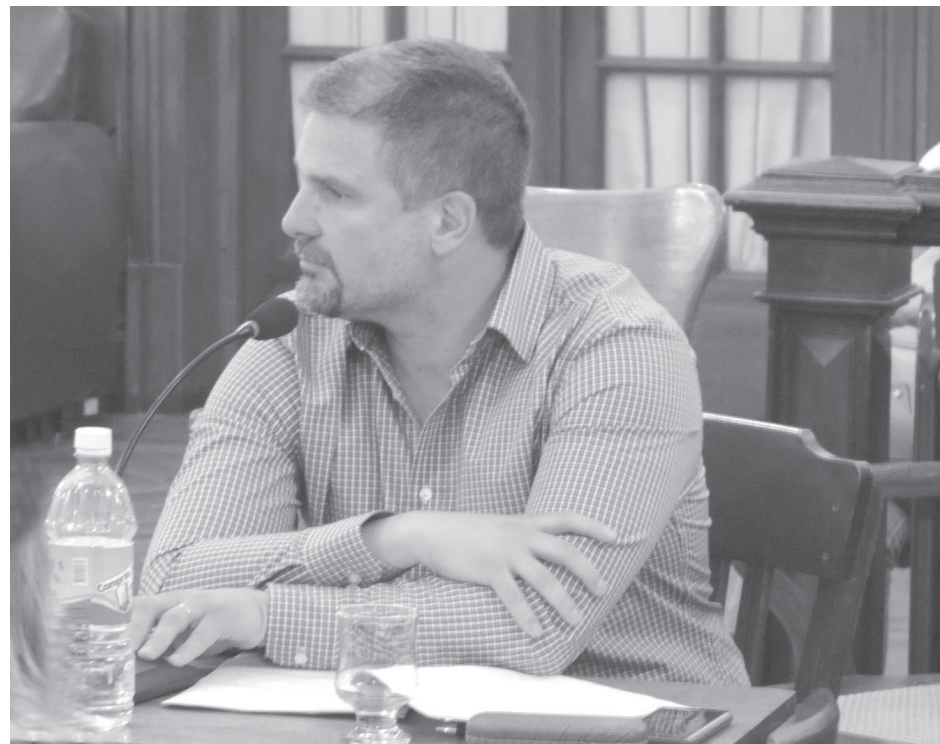
El edil marcó su postura contraria a la implementación de la tasa de seguridad.

“Lamentablemente no fuimos acompañados en la posibilidad de tratar el tema sobre tablas, con lo cual el proyecto ha perdido estado parlamentario, lo que observamos como una intención de evitar el costo político de que el Intendente analizara tal posibilidad, ya que ni siquiera se hablaba de un monto determinado”,