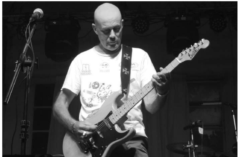
El ícono del Rock Nacional, pasó por El Fortín.

do en la sede del "Club El Fortín"; y Considerando: Que dicho suceso "muestra anual musical del Astilleros" edición