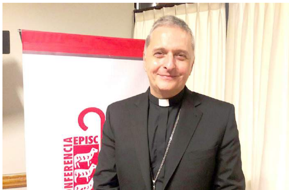
Importante designación para nuestro Obispo, Monseñor Ariel Torrado Mosconi.