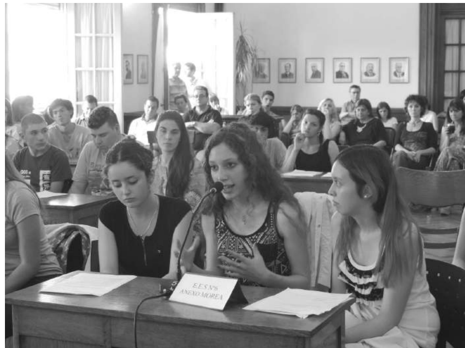
Alumnos de la EES Nro.6 de Morea abrieron la sesión de ayer.

DOCUMENTACION 010-17: E.E.S N°1 C. María Naón. Colocación de nombre a la plaza (Expte. 010/17).