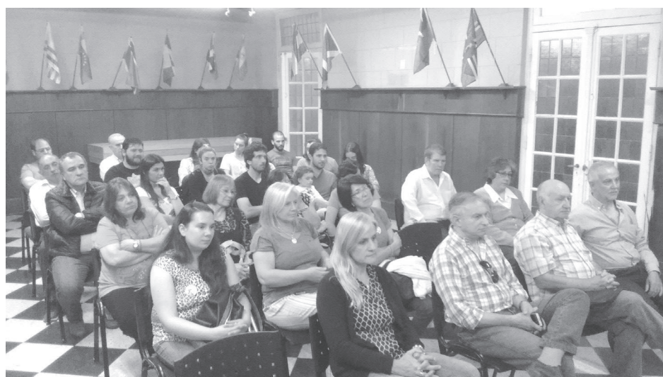
Asistentes a la presentación del libro "Hijas de Eva" del Centro Cultural de la Cooperación.