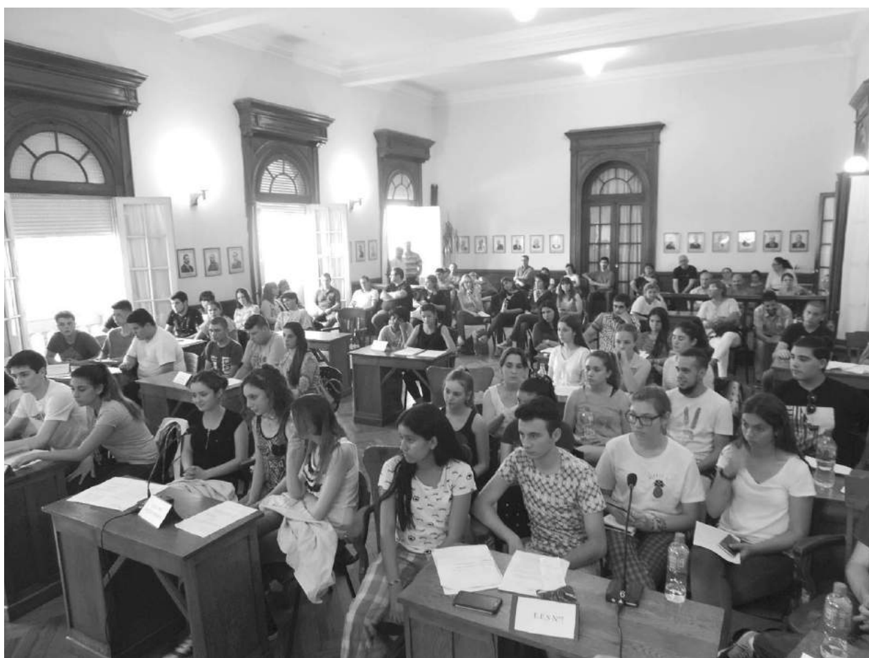
Debido a las altas temperaturas la sesión se tuvo que realizar en el HCD.