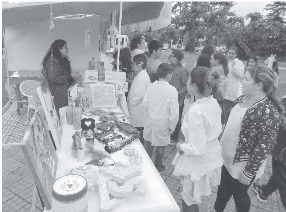
Ayer comenzó la 7ma. Feria del Libro en pleno centro de la ciudad.

Leer, comprender lo que leemos y conocer a través de la lectura, nos permitirá tener caminos en los que las elecciones serán nuestras; y no de otros", remarcó la funcionaria educativa, señalando que "los libros son parte del compromiso que tenemos adentro de las escuelas con los chicos". Finalmente, agradeció el apoyo del municipio, al grupo de bibliotecarias, a los educadores que integran la comisión organizadora y a los distintos medios de comunicación.