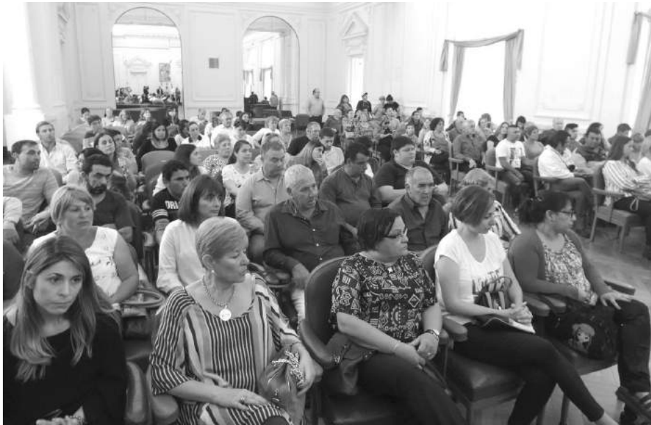
Ayer fue el Día del Empleado Municipal y el asueto será el próximo lunes.

Al conmemorarse ayer el Día del Empleado Municipal, en el Salón Blanco del Palacio Municipal, el Intendente de Nueve de Julio, Mariano Barroso, acompañado de funcionarios de su Gabinete y representantes del Sindicato de Trabajadores Municipales y la Unión de Personal Civil de la Nación (UPCN), presidió la entrega de reconocimientos a los trabajadores que arribaron a 25 años de servicio y a quienes se han acogido a los beneficios jubilatorios en el período 2016/2017, a la vez que se entregaron nombramientos a más de 40 agentes.