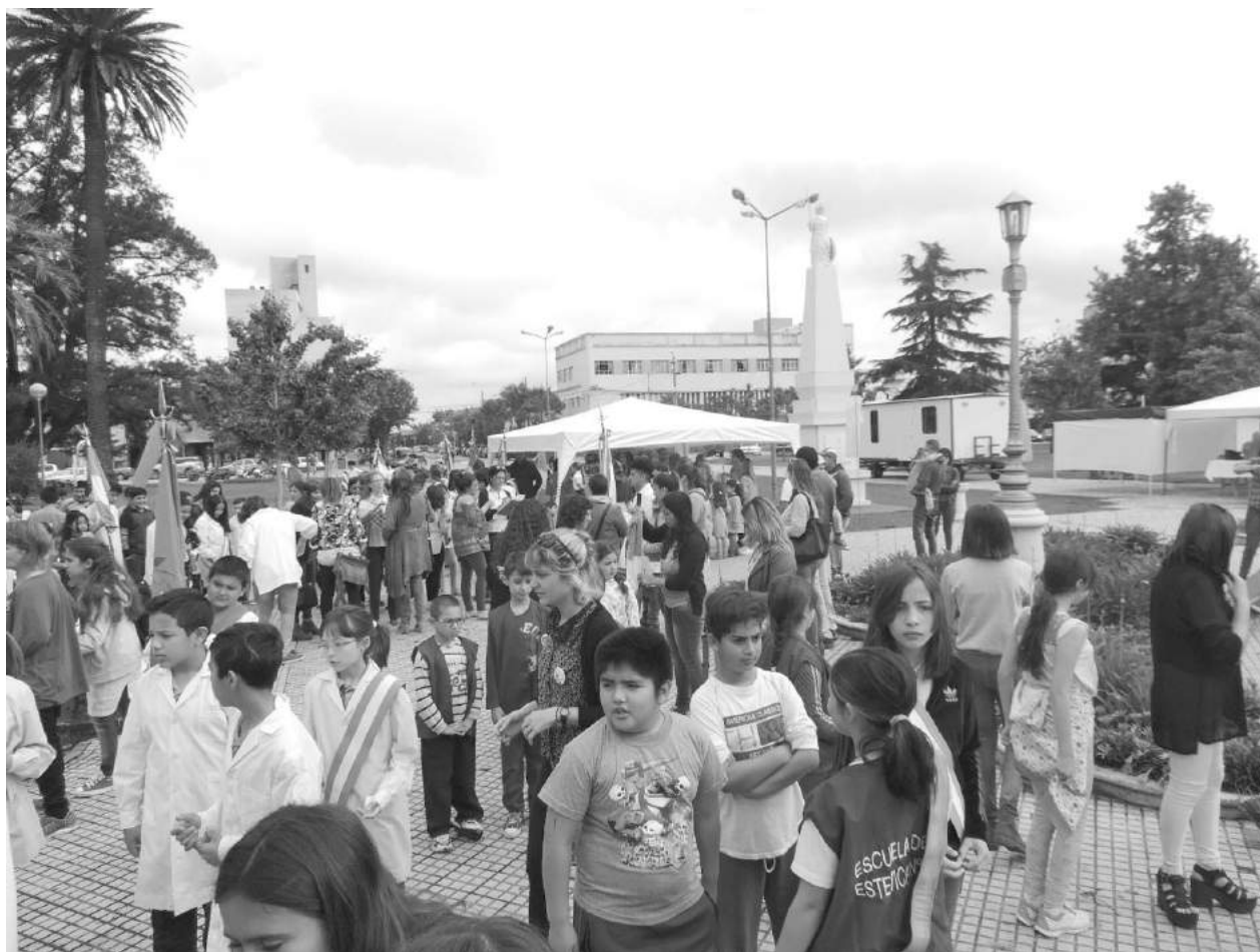
Hoy y mañana continúa el evento educativo cultural literario.