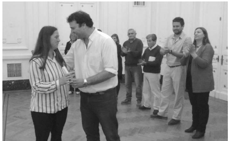
El Intendente hace entrega de un reconocimiento a una empleada.