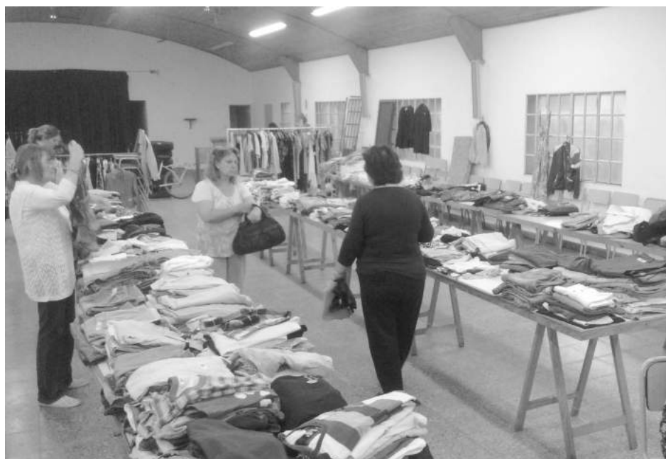
Hasta el día de mañana estará disponible la feria de CEPRIL.

Con gran éxito, continúa la gran feria de CEPRIL en el Salón Sagrado Corazón, donde puede encontrarse desde ropa para adultos y de trabajo, hasta muebles, aberturas, electrodomésticos, cubiertas y bicicletas,