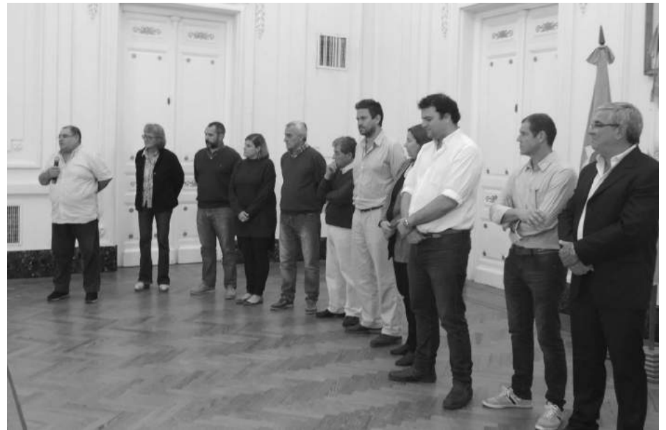
Autoridades de los gremios municipales dejaron su mensaje a los presentes.