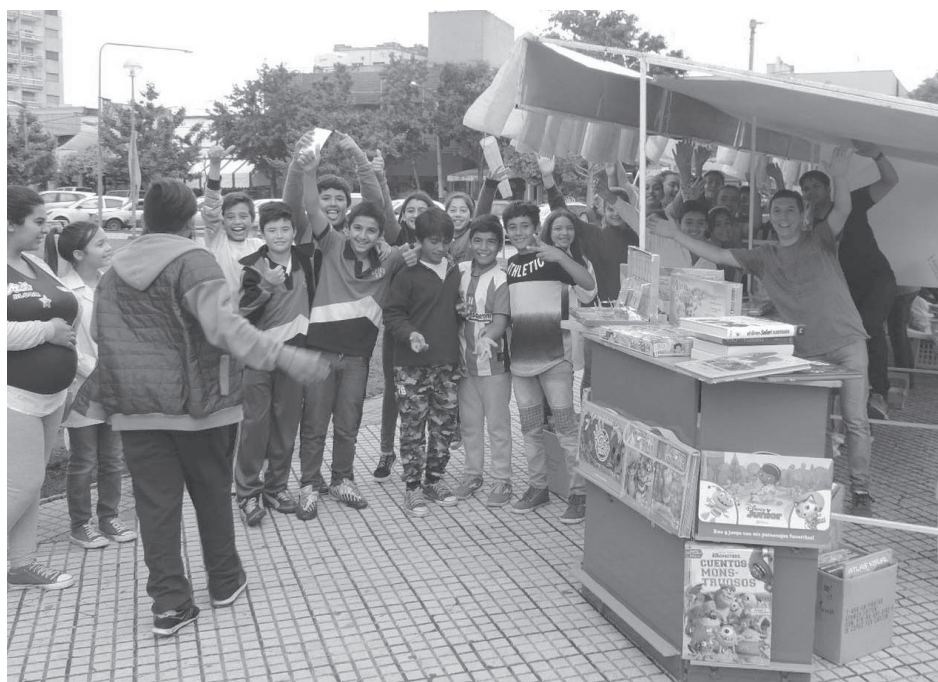
Los alumnos tuvieron su día de lectura recorriendo las distintas editoriales.