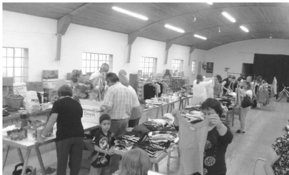
A buen ritmo se desarrolla la feria denominada "La Baulera".