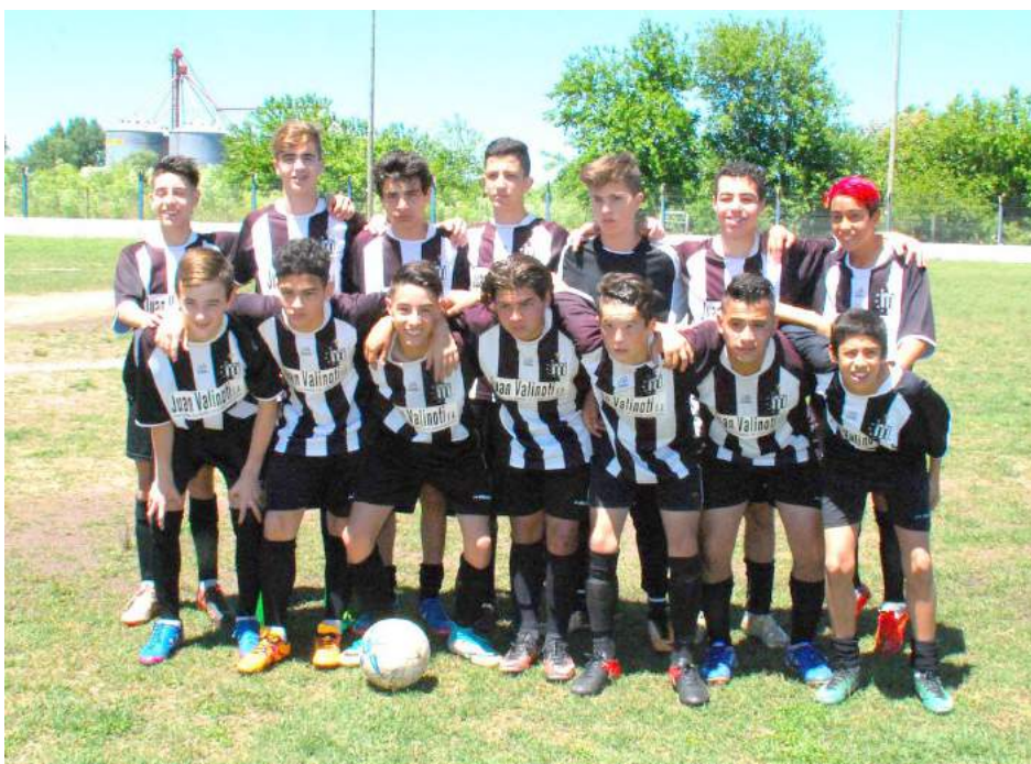
6ª Div. de Atl. French.