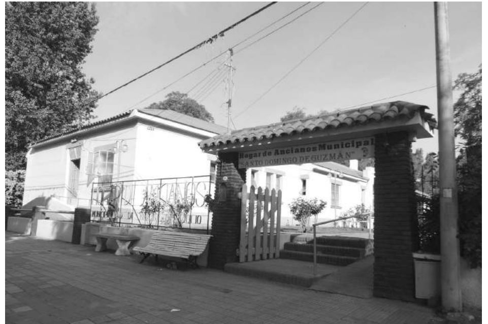
Frente del Hogar Santo Domingo de Guzmán.

El Hogar de Ancianos Municipal "Santo Domingo de Guzmán" llevará adelante este próximo domingo 12, desde las 18 hs. una gran kermese popular, con el objetivo de cerrar su año de trabajo, presentando ante la comunidad lo realizado a lo largo del mismo.