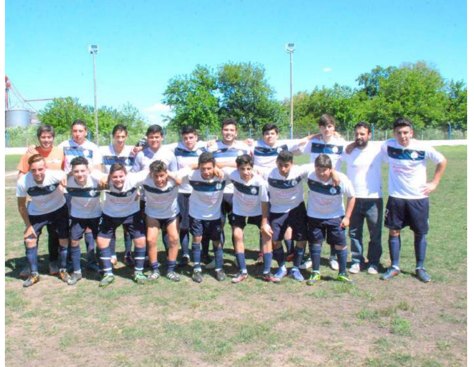
5ª Div. de Libertad.