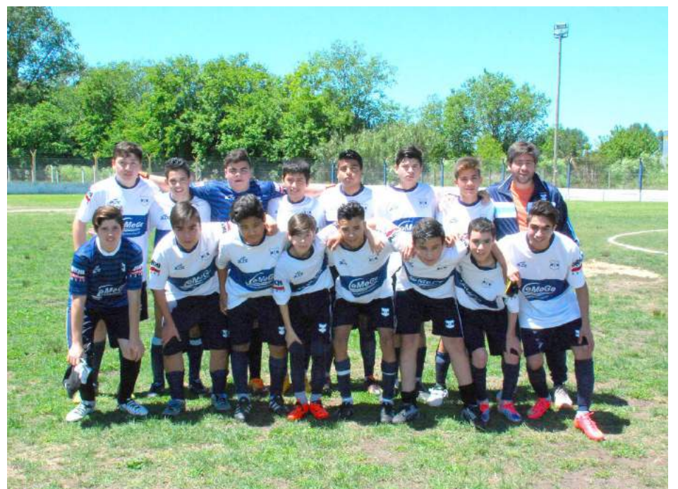
6ª Div. de Libertad.