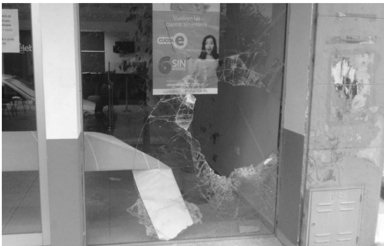
Lugar de la vidriera por donde ingresó el ladrón tras romperla, para cometer el hecho delictivo.