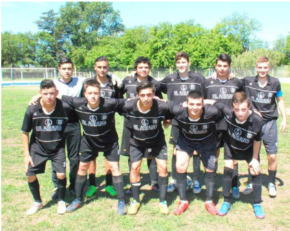
5ª Div. de Atl. French.