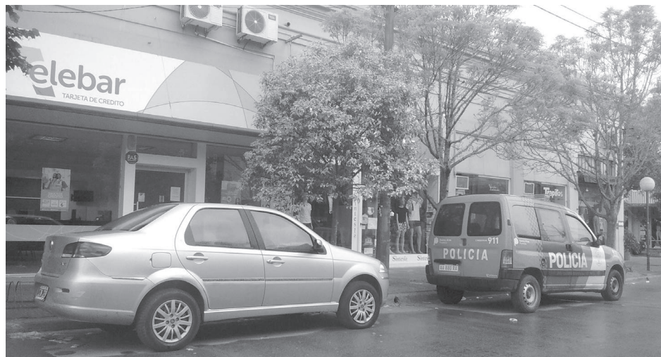
Personal policial custodia el lugar en las primeras horas de la mañana de ayer.

La Policía Comunal trabaja sobre el hecho, habiéndose solicitado las filmaciones de las cámaras de seguridad de la Municipalidad de 9 de Julio y de comercios veci-