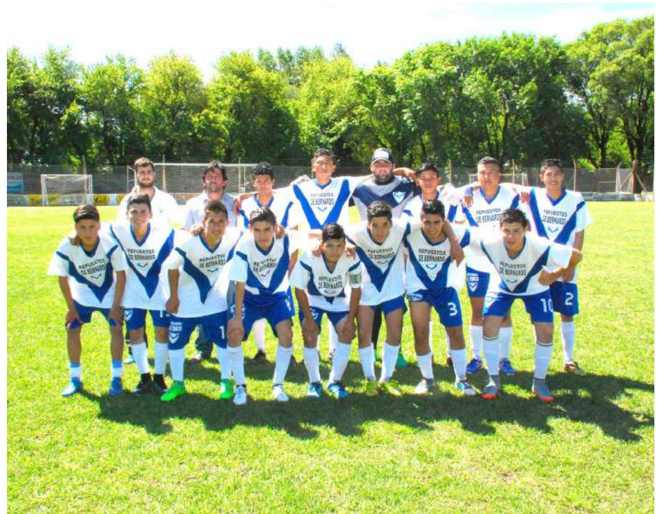
5ª Div. de El Fortín.