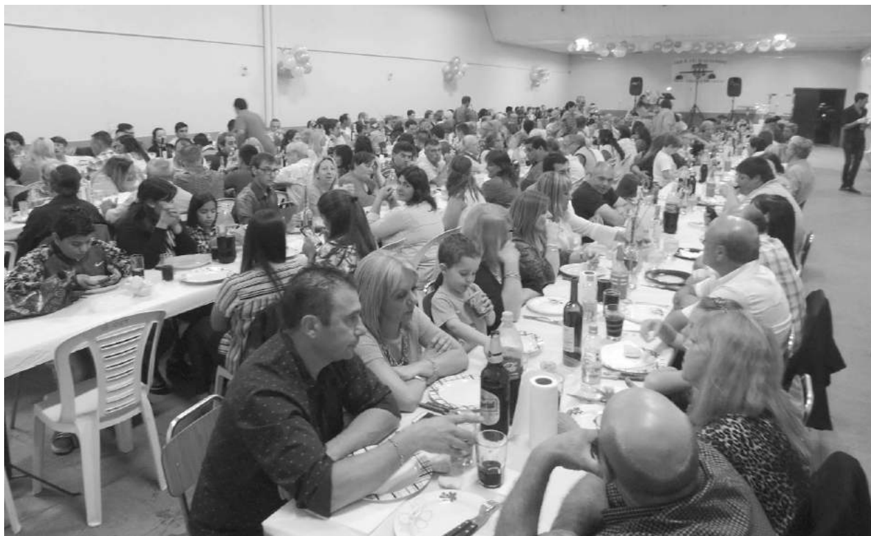
El centenario Club 18 de Octubre festejó el pasado sábado en su sede.