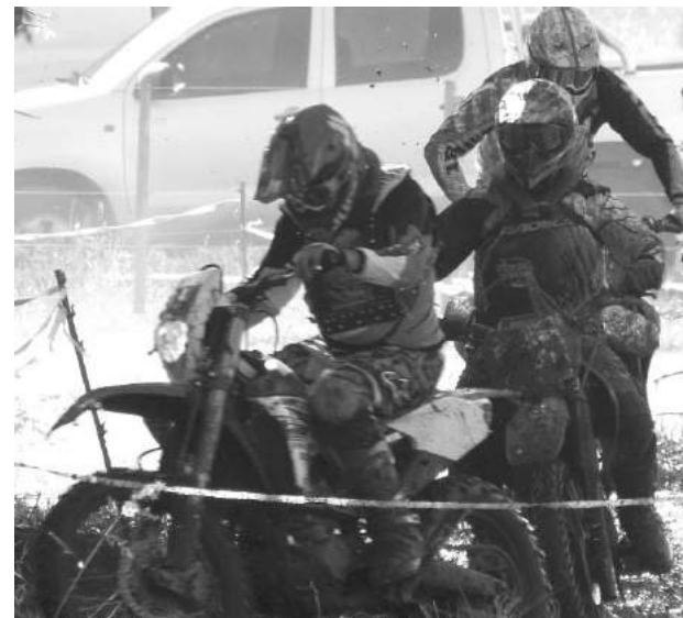
Momentos de definiciones de la competencia, donde aparecen los emocionantes sobrepasos.