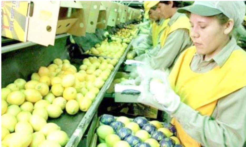
Los productores citrícolas dicen que la reforma tributaria afectará al sector y provocará una suba de precios.