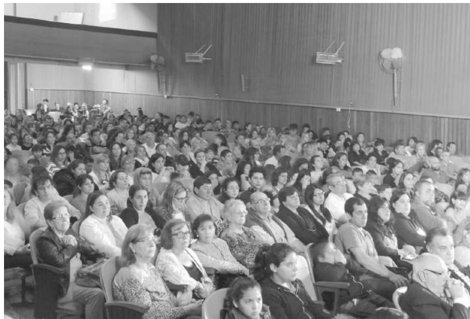
Importante asistencia en la entrega de certificados a los Mejores Compañeros.