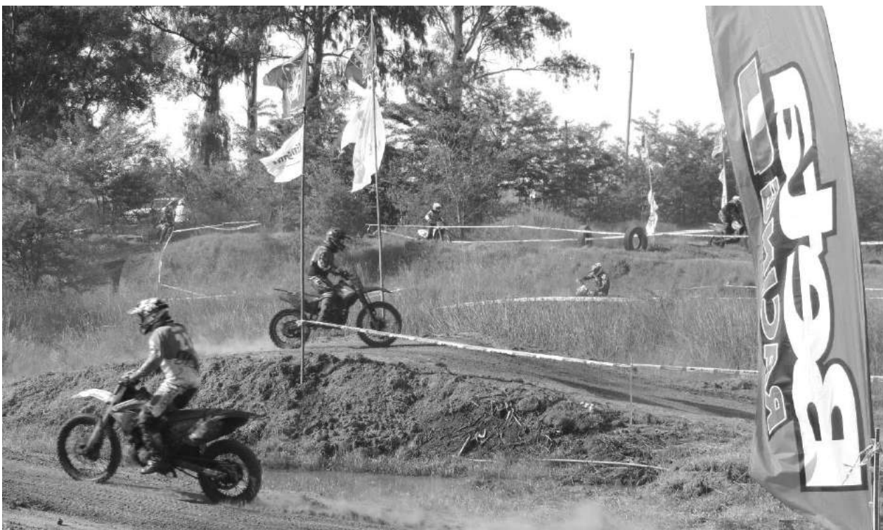
Toda la adrenalina presente el sábado y domingo en el Enduro Park.