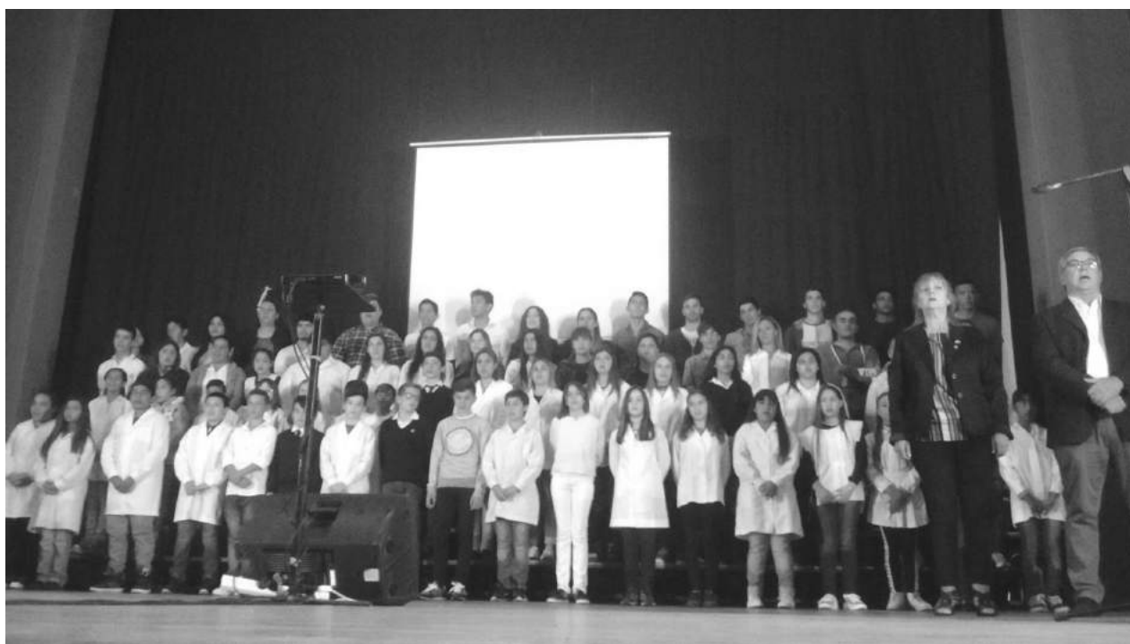
Autoridades rotarias y municipales acompañaron a los 70 alumnos reconocidos.