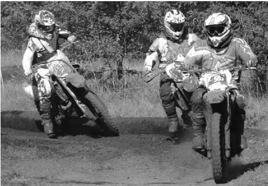
Un conjunto de máquinas y pilotos de primer nivel estuvieron en nuestra ciudad.