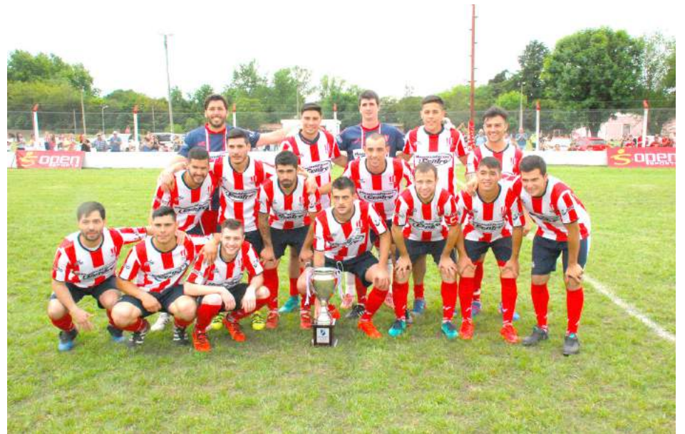
Los integrantes del plantel de Atlético 9 de Julio posan con el nuevo trofeo conseguido.

año por tercer certamen consecutivo. El estadio "Antonio Crosa" fue el escenario para el encuentro entre los locales