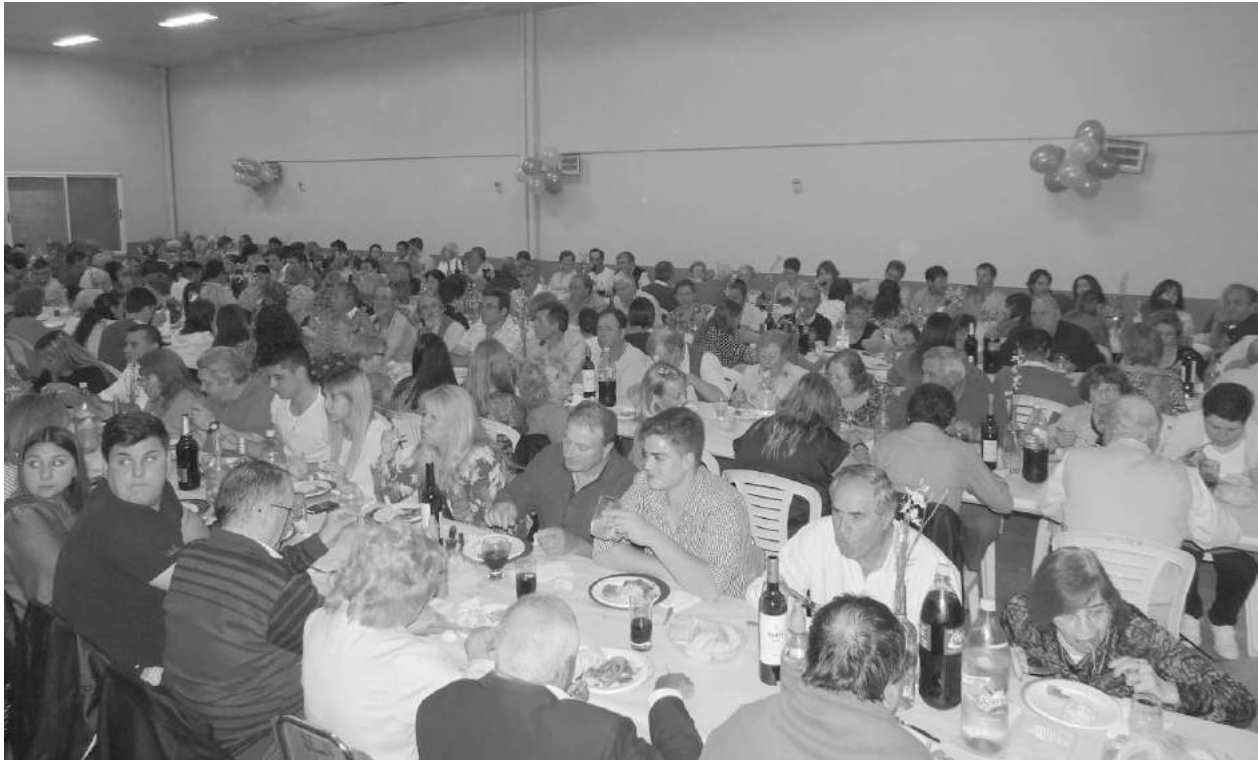
El salón de la sede del Club 18 de Octubre de El Provincial se vio colmado en la cena de festejo del centenario.

En la noche del sábado, en su reciente sede remodelada tuvo lugar el festejo de los 100 años del Club 18 de Octubre de El Provincial, con una cordial cena, que incluyó homenajes, brindis y el clásico baile.