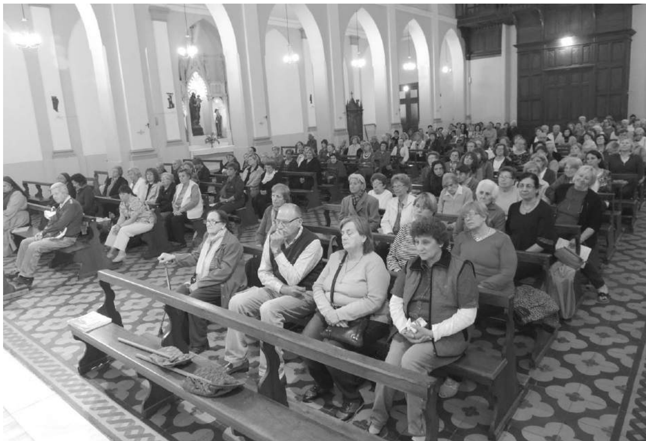
Fieles que asistieron a la misa oficiada por el Obispo en Iglesia Catedral.