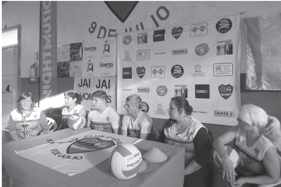
En rueda de prensa se presentó el Torneo Regional de Voley Femenino.

Autoridades de la novel institución nuevejuliense brindaron detalles del I Torneo organizado por el club.