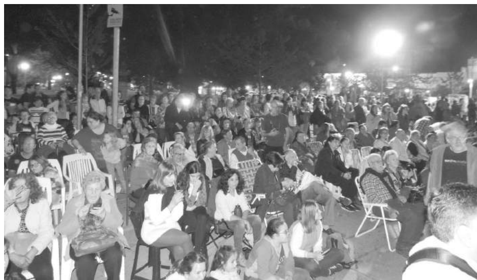
Público que asistió a la proyección de la película en Plaza Belgrano.

En la noche del lunes, frente al Palacio Municipal, se proyectó la película "No te olvides de mí", filmada en el distrito de 9 de Julio, y protagonizada por Leonardo Sbaraglia, Cumelén Sanz y Santiago Saranite; con la dirección de Fernanda Ramondo.