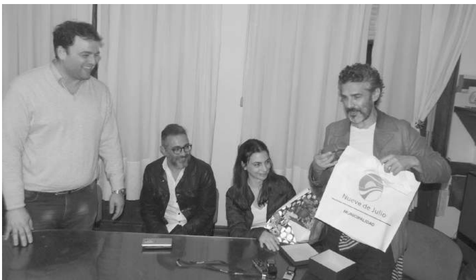
El reconocido actor Leonardo Sbaraglia recibió un presente de parte del municipio.

El reconocido actor, junto a la directora y el productor, fueron recibidos por el Intendente Municipal.