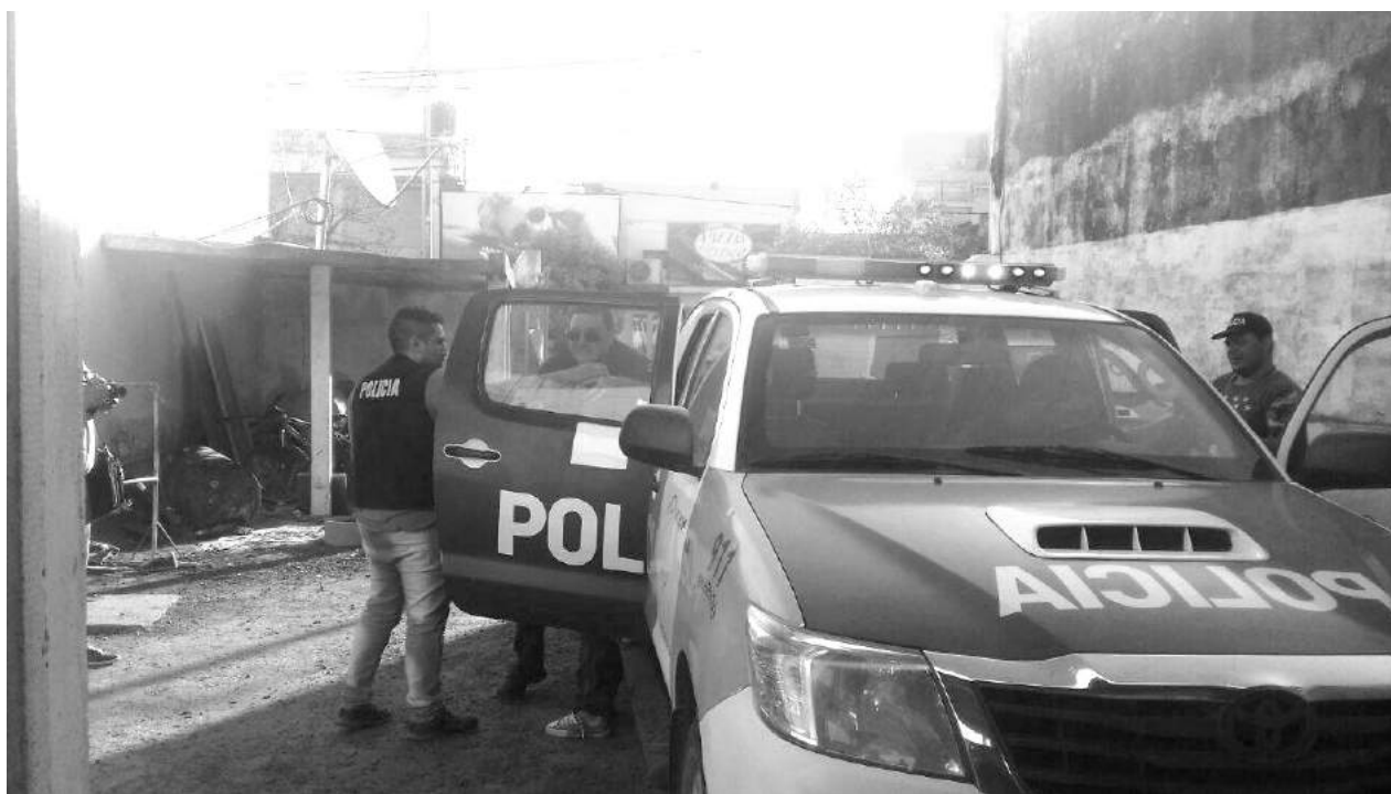
Personal policial traslada a una persona presuntamente involucrada en uno de los hechos.

CON LA PRESENCIA DEL ACTOR LEONARDO SBARAGLIA