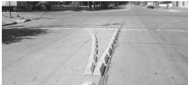
Vista de uno de los cuestionados moderadores.