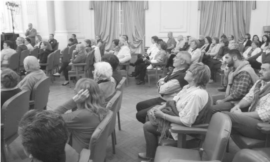
Público presente en la segunda noche de Octubre Coral.