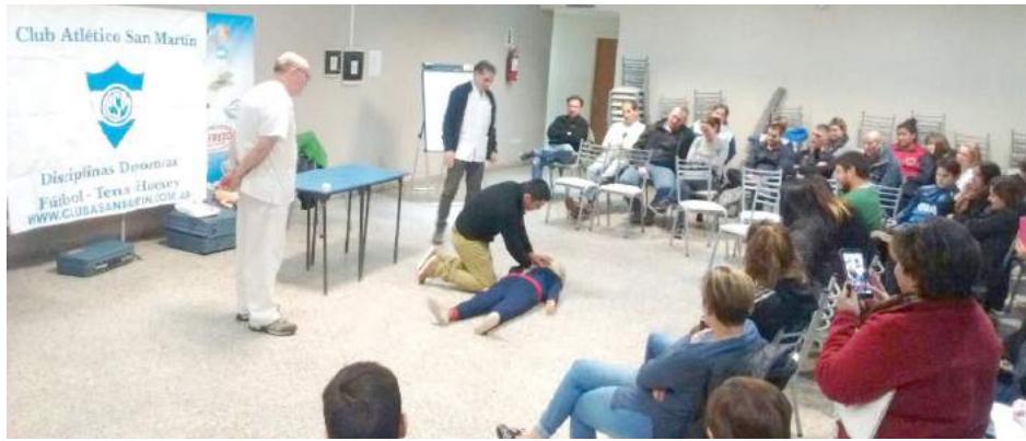
Uno de los asistentes al curso junto a profesionales realizan uno de los ejercicios de RCP.

Por espacio de dos horas, unas cincuenta personas se dieron cita en la noche de este jueves en el Salón de Eventos de Club San Martín, donde la entidad, a través de su Comisión Directiva, desarrolló un curso de RCP (Respiración Cardiopulmonar), para profesores del Club y todas aquellas personas interesadas, quienes respondieron satisfactoriamente a la misma.