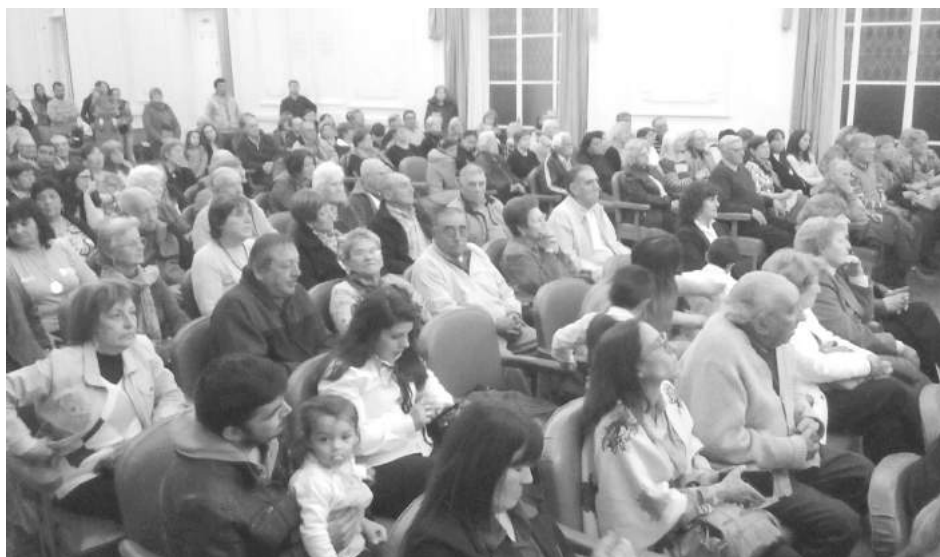
Asistentes al acto de reconocimiento desarrollado en el Salón Blanco municipal.

presentación musical que recorrió distintos pasajes del folklore popular argentino, acompañado por el Ballet Folclórico Municipal, en tanto que posteriormente se entregaron reconocimientos a 22 adultos mayores de Nueve de Julio y de las localidades de Dudignac, Morea, Patricios, Carlos