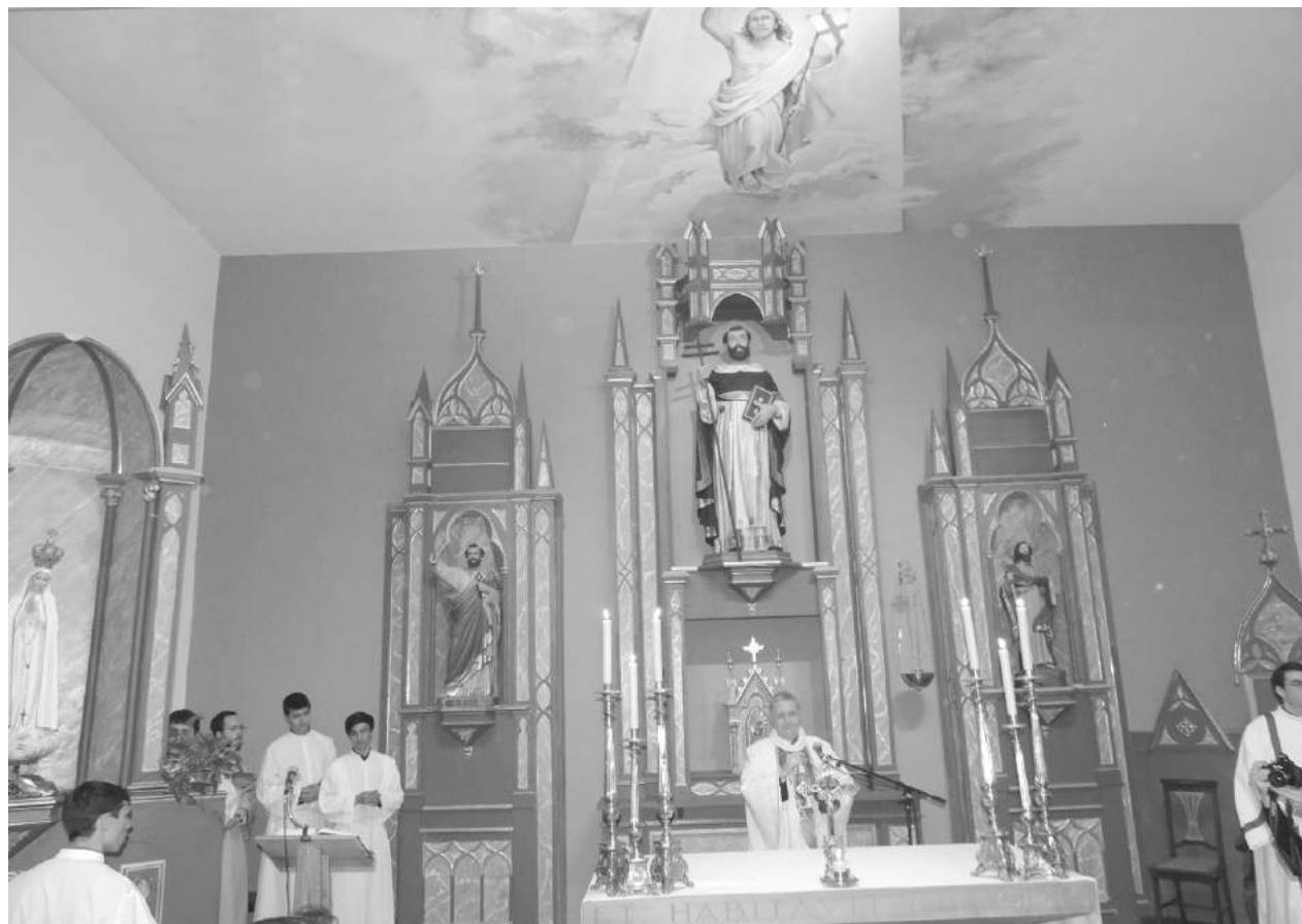
El Obispo presidió la ceremonia de apertura del Santuario de Fátima llevado adelante anoche.