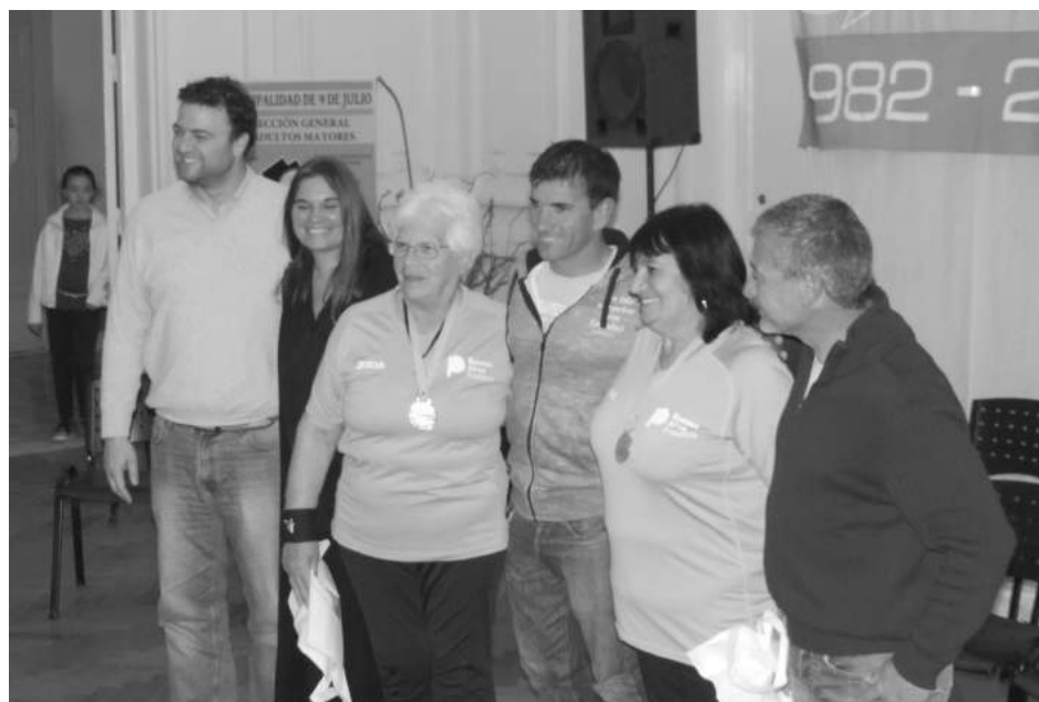
Autoridades municipales entregan los reconocimientos a adultos que participaron de los Torneos Buenos Aires.