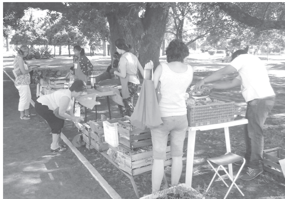
Mañana sábado a partir de las 9:30 hs vuelve la feria de Huerteras a la Plaza Belgrano. Con producción Agroecológica de verduras de estación, plantas y plantines, huevos, mieles, futas, dulces y conservas. También hermosas macetas hechas a mano. Quienes se acerquen deberán llevar bolsa y podrán acercar frascos de mermelada y hueveras para reciclar.