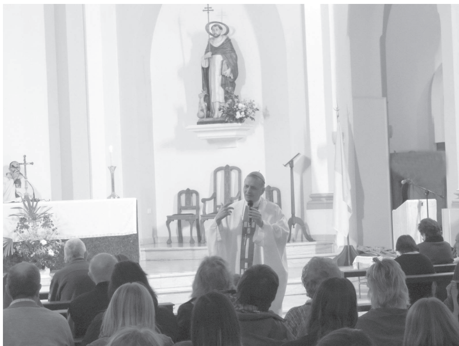
El Obispo ofició la misa en Acción de Gracias por el Hogar. En el marco de la celebración del 30mo. Aniversario del Hogar Nazareth, se realizó en la noche del martes una Misa en Acción de Gracias en la Iglesia Catedral "Santo Domingo de Guzmán", a cargo del Obispo Diocesano de 9 de Julio, Ariel Torrado Mosconi.