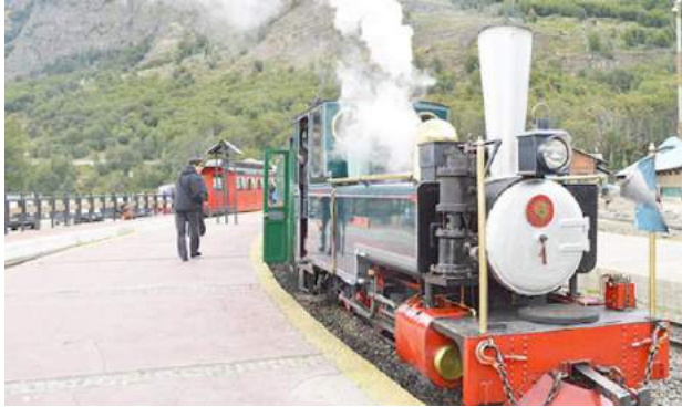
El tren fue inaugurado hace 23 años.

Fue comprado por una sociedad que está integrada por tres familias de conocida trayectoria en la actividad turística dentro de la capital fueguina.