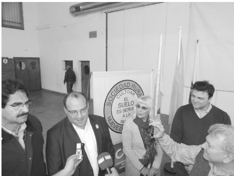
Ricardo Negri, Ministro de Nación, en rueda de prensa.