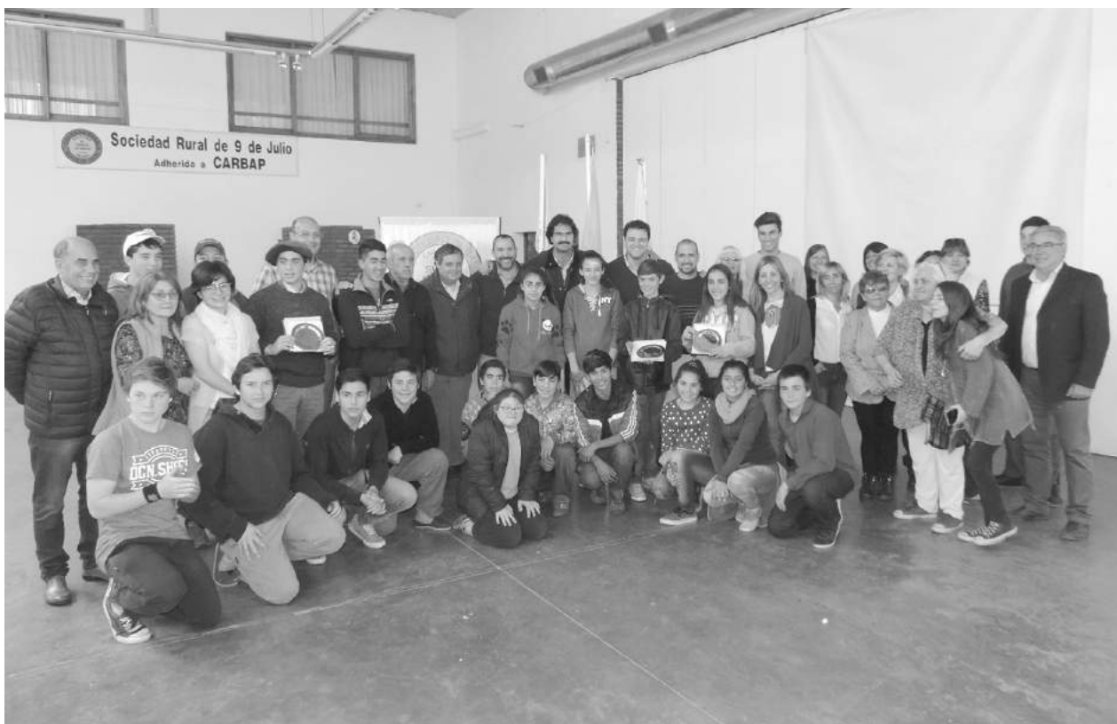
Los establecimientos educativos rurales reconocidos, posan con los funcionarios locales, provinciales y nacionales.