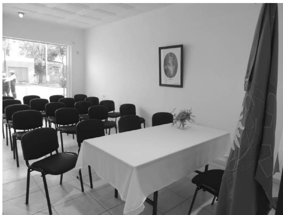
Sala donde se realizarán las ceremonias de casamientos.