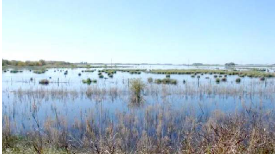
La Plata, 06 Oct (InfoGEI).- Con el incremento de las temperaturas, en la región del oeste bonaerense se anticipa la proliferación de alimañas e insectos, como

Son varios los factores que influyen en el fenómeno: un invierno sin muchas heladas, la llegada de días calurosos, humedad y alta presencia de agua en la región. Acciones locales y precauciones que pueden adoptar los vecinos.