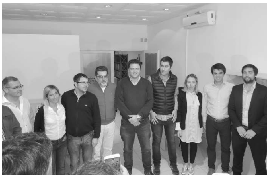
Autoridades legislativas y municipales presentes en el acto protocolar.