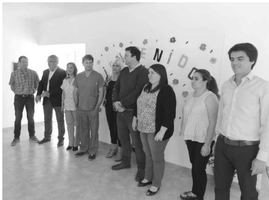
El Intendente junto a funcionarios municipales en el acto realizado ayer.