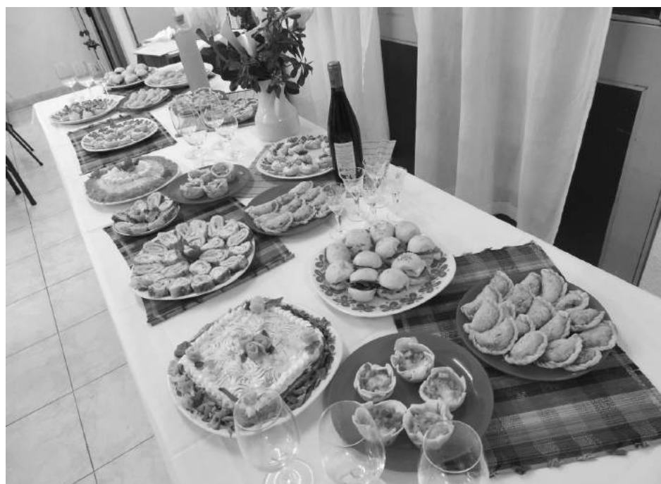
La bien servida mesa de los productos hechos en el CFP Nro. 402.

Por su parte, la autoridad educativa destacó la importancia de trabajar en la formación para el trabajo a través de este tipo de Centros que dictan diversos cursos apuntando a la