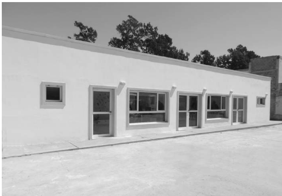
Vista de la fachada de la Sala de Primeros Auxilios que entrará en funcionamiento la próxima semana.