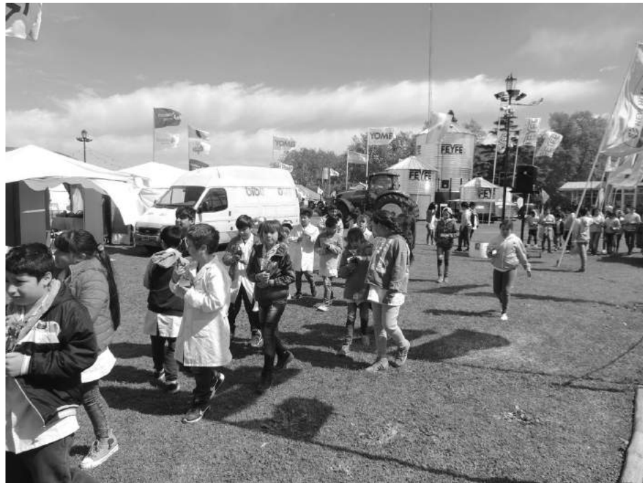
El tiempo acompañó la segunda jornada de la Expo Rural.