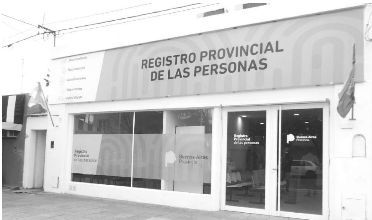
Frente del edificio donde próximamente funcionará el Registro Civil.