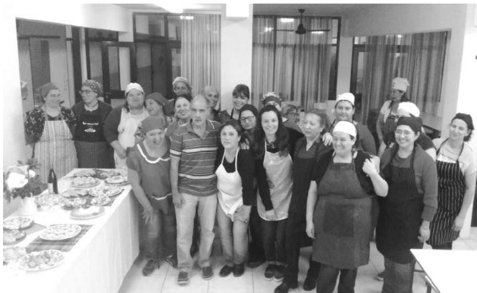
Alumnos y directivos del curso de Buffet Frio, posan para Tiempo.

CENTRO DE FORMACION PROFESIONAL Nro. 402