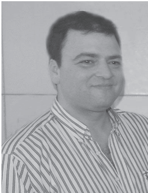
El Intendente Municipal dialogó con la prensa.