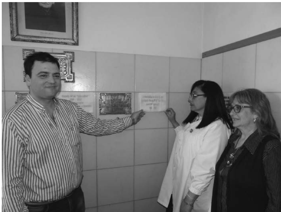
El Intendente junto a la Directora y la Inspectora Jefe, descubren una placa.