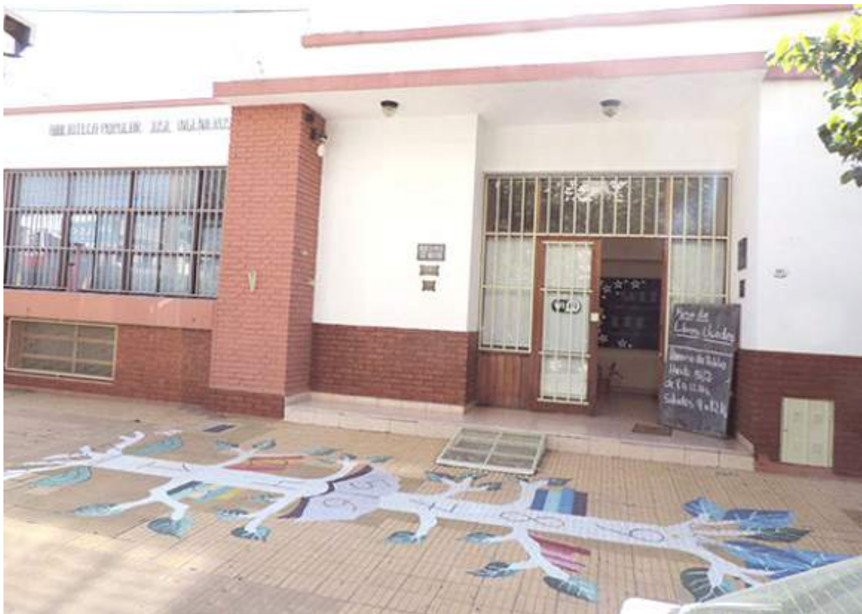
La Biblioteca "José Ingenieros" lleva adelante la campaña para continuar con numerosos proyectos educativos culturales.