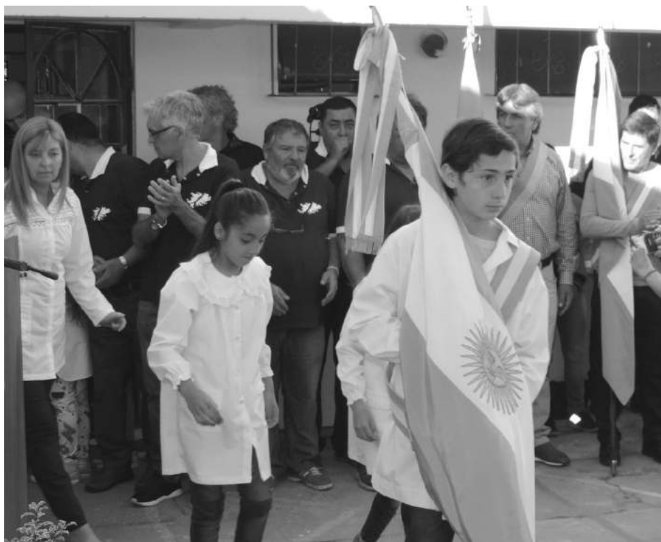
Los abanderados de la escuela anfitriona hacen la entrada al acto.