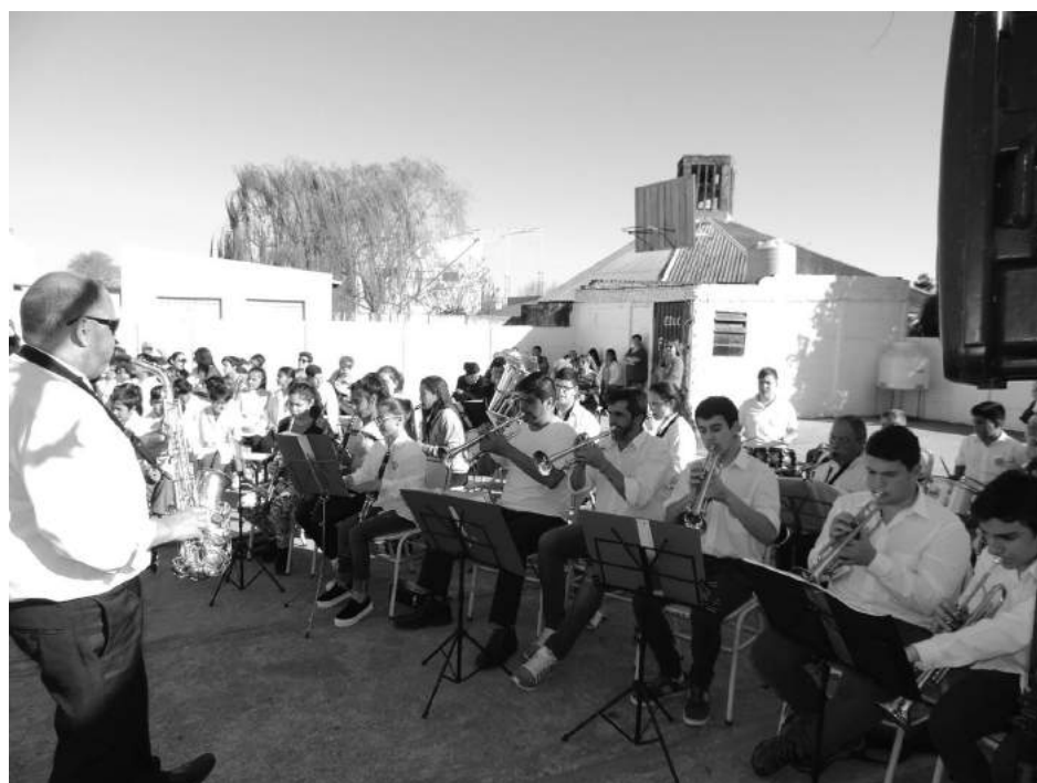
La Banda Municipal "Jesús Blanco" animó la jornada del día lunes.

"En el marco de esta construcción colectiva debemos seguir trabajando convencidos en que la educación es la herramienta principal para transformar al mundo en algo mucho mejor", agregó. Por su parte, la ex directora,