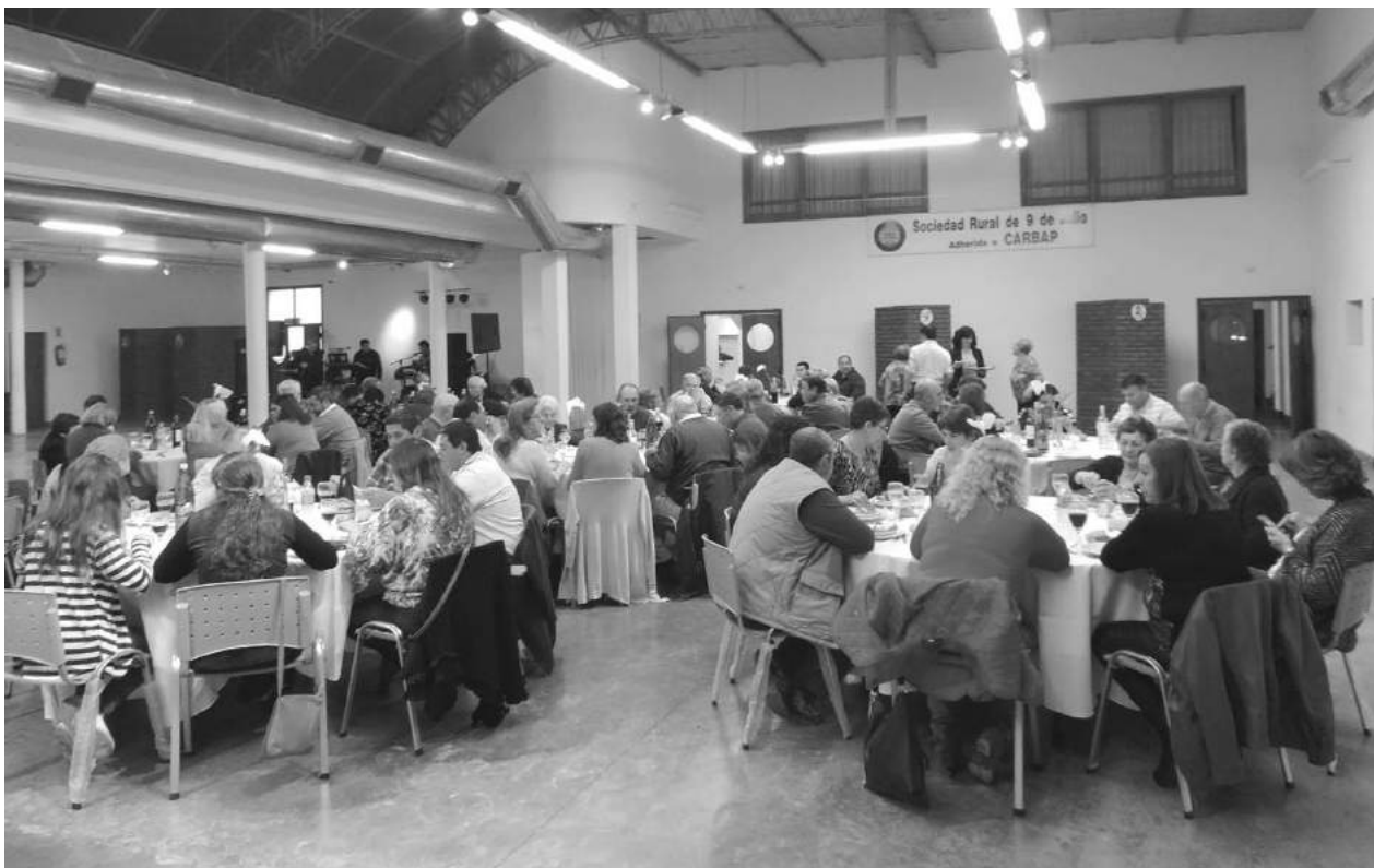
Los agricultores festejaron su día el pasado sábado en Sociedad Rural.

reencuentros y camaradería. Como es tradicional, se procedió a la elección del Agricultor del Año y el agricultor más joven que resida en el medio rural. Ampliaremos en nuestra próxima edición.