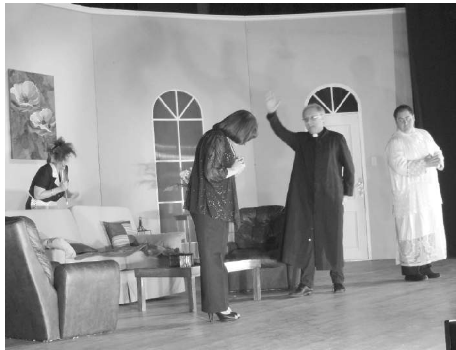
La reidera comedia continuó su éxito el sábado y el domingo.

El grupo de Teatro de Cáritas despidió oficialmente el pasado fin de semana, la vigésimo novena temporada del ciclo “Agosto a todo teatro”. Esta vez, las tablas del Teatro “Rossini” recibieron a una conocida comedia de la dramaturgia argentina, “Dos señores atorrantes” de Ivo y Horacio Pelay.