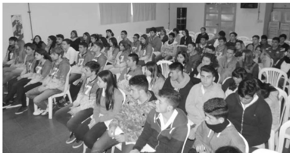
Los alumnos participaron de la charla realizada la semana pasada.