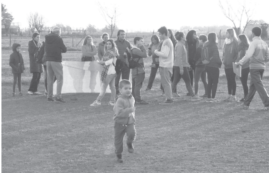
Los jóvenes participaron de la propuesta puesta en marcha el pasado viernes.