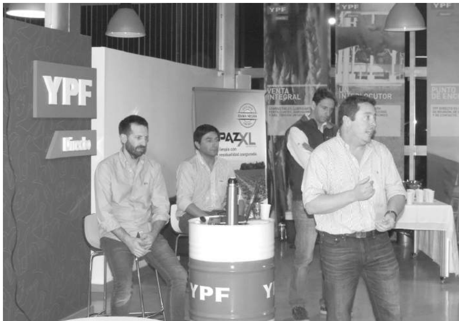
Responsable de llevar adelante la charla sobre control de malezas.