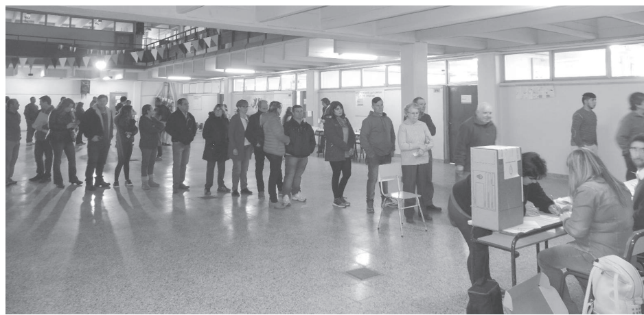
Gran cantidad de vecinos se acercaron a sufragar.