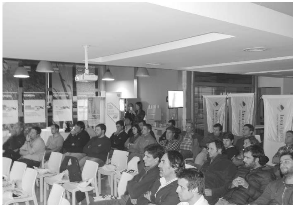
Asistentes a la importante jornada realizado por YPF Directo.

La firma Guazzaroni Greco, a través de "YPF Directo" e "Insuagro", ofreció una interesante charla en