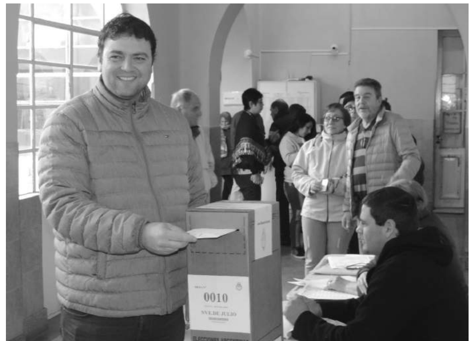
El Intendente Municipal votó muy temprano en la Escuela Nro. 1.