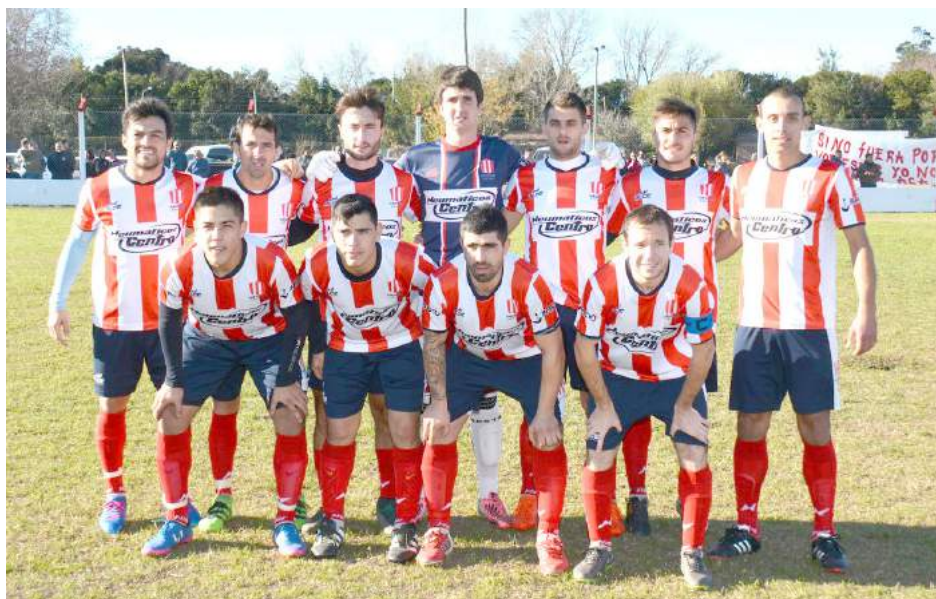
Atlético 9 de Julio.

Atlético 9 de Julio recibe a 12 de Octubre en un choque clave para ambos.