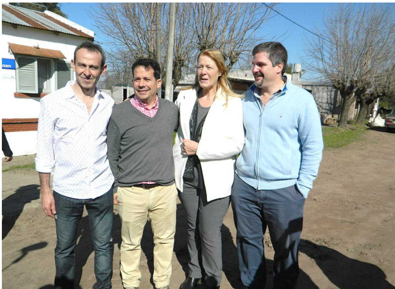
Precandidatos locales junto a la precandidata a Senadora Nacional.

Parrillada - Asado - Empanadas Ensaladas - Postres - Bebidas SALÓN CALEFACCIONADO CON LA MEJOR ATENCIÓN DE SUS DUEÑOS A. Alvarez 1275 Tel. 15-487212 / 15-445456