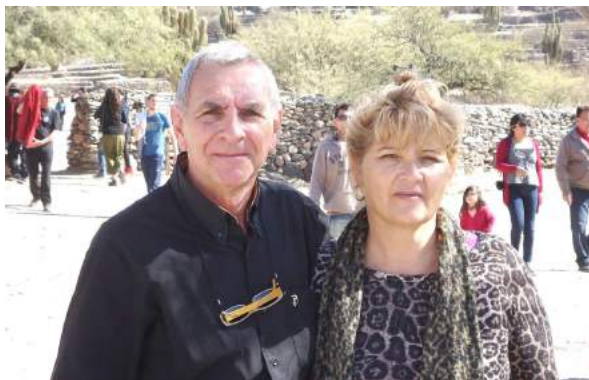
Conduce: Héctor Rodolfo Tinetti Cámaras: Micaela María Petetta