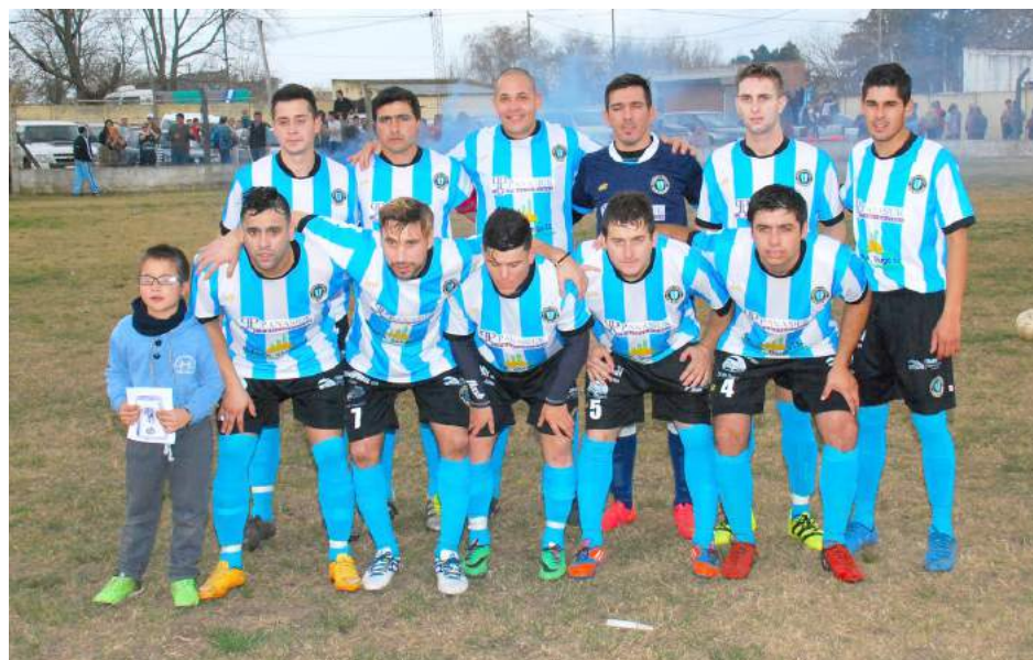
Atlético San Martín.