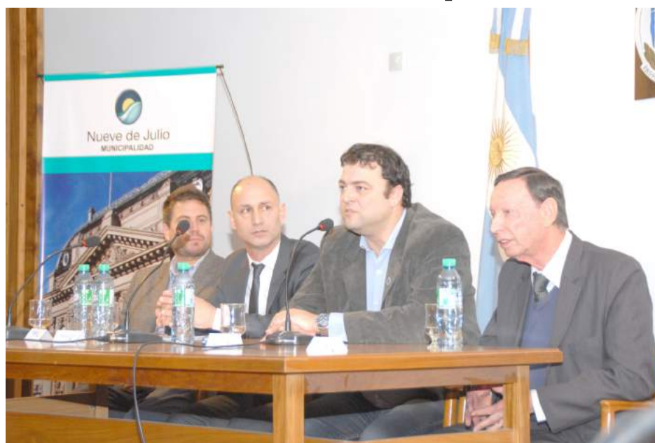
La sede del Colegio de Escribanos fue el ámbito elegido para el encuentro.