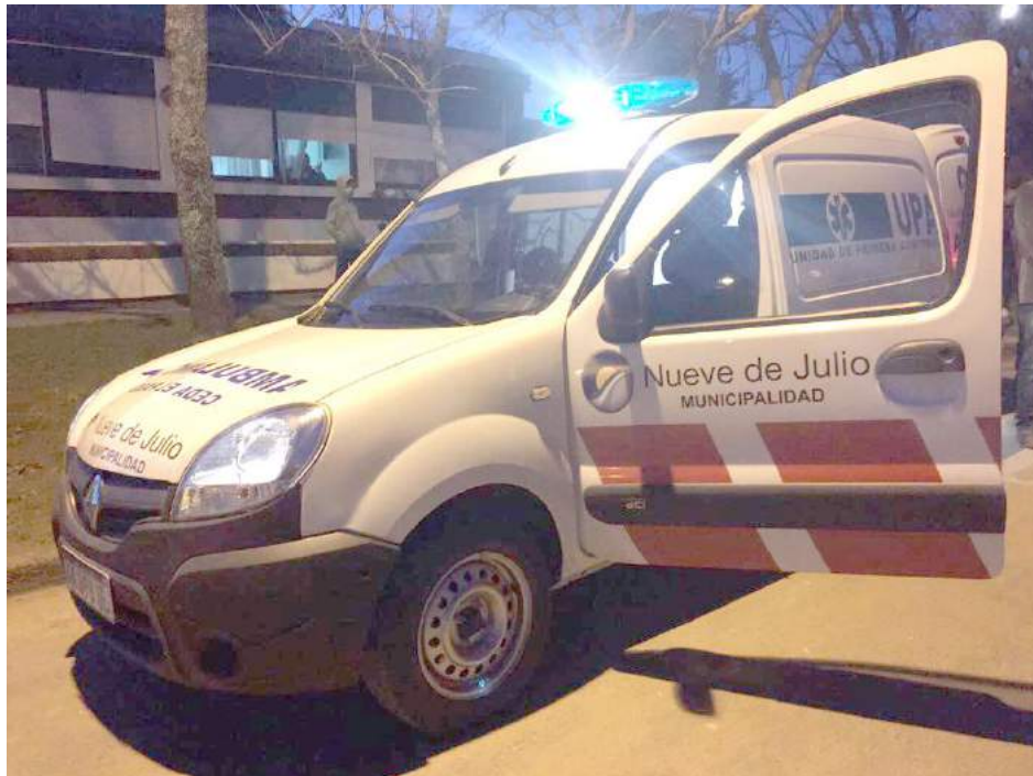
Vista del utilitario que recibió el Hospital.