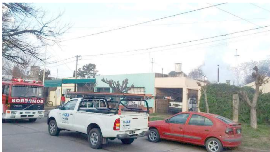
Personal de Bomberos y de la CEyS trabajan en el lugar.

Siendo las 16:40 de ayer, por causas que se desconocen, se registró un principio de incendio en una vivienda de calle Freyre al 1900, lugar al que acudió una dotación