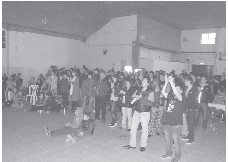
Público que asistió a ver a Arena, Afanaje y Brancaleone.