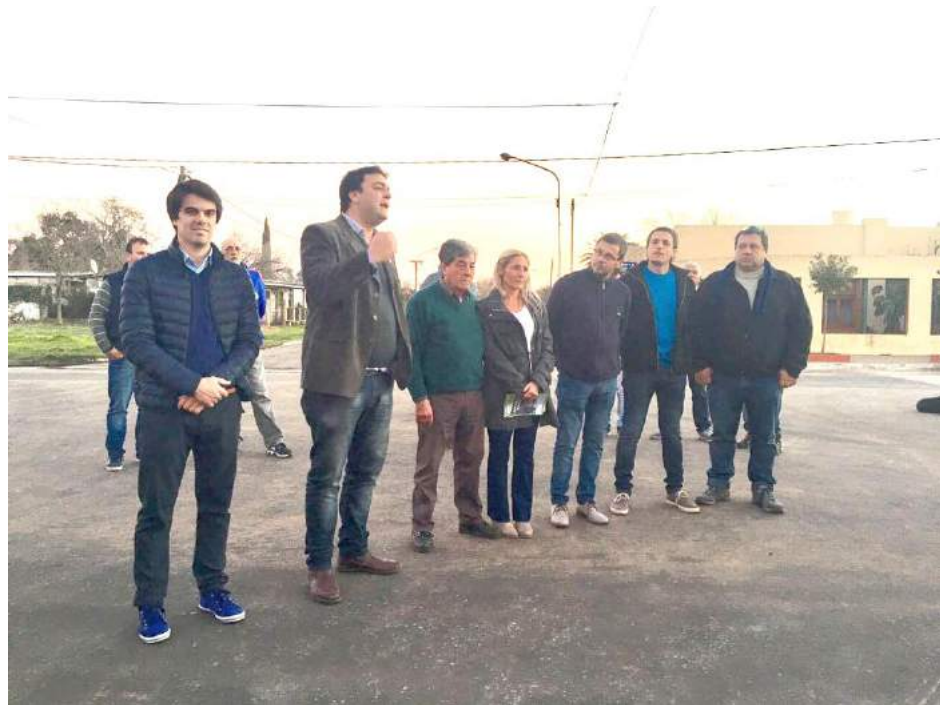
Autoridades municipales que participaron del acto en Quiroga.

Asimismo, entregó una nueva ambulancia para el Hospital "Manuel Arce".