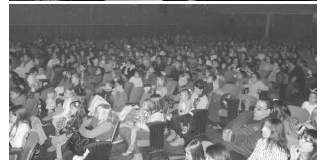
A sala llena se presentó el espectáculo musical.