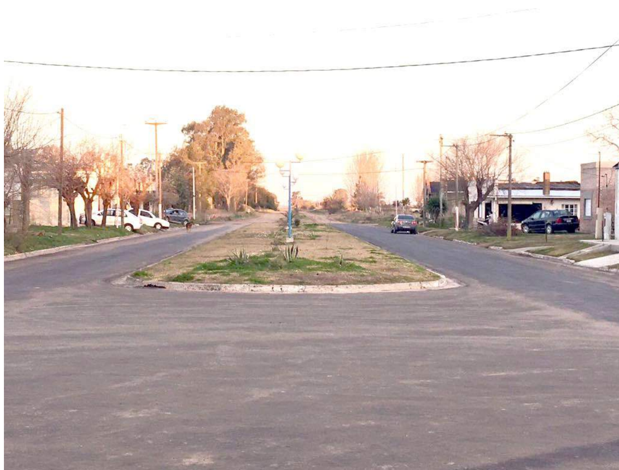
La imagen muestra las calles con asfalto en frío inaugurado el pasado viernes.