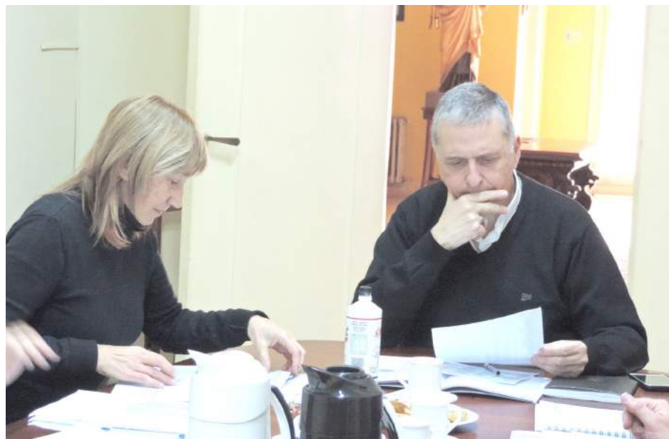
El Obispo Ariel Torrado Mosconi junto a integrantes de Cáritas Diocesana, reunidos por la Colecta Anual realizada anteriormente.

La Comisión Diocesana de Cáritas se reunió el sábado para rendir cuentas sobre los resultados de la Colecta