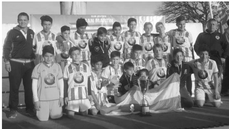
Equipo de Atlético 9 de Julio Campeón de la Copa Sanmartiniana, con el trofeo recibido.