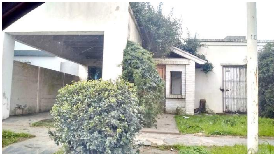
Vivienda que sufrió un siniestro en la mañana de ayer.

No se descarta la posibilidad de que el hecho haya sido intencional.