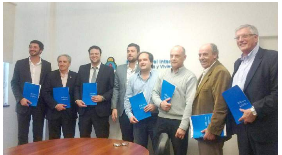
Interior, Obras Públicas y Viviendas de la Nación, a la firma de un convenio enmarcado en el Programa de Desarrollo Local para la adquisición de una pala cargadora que será afectada a la Secretaría de Obras