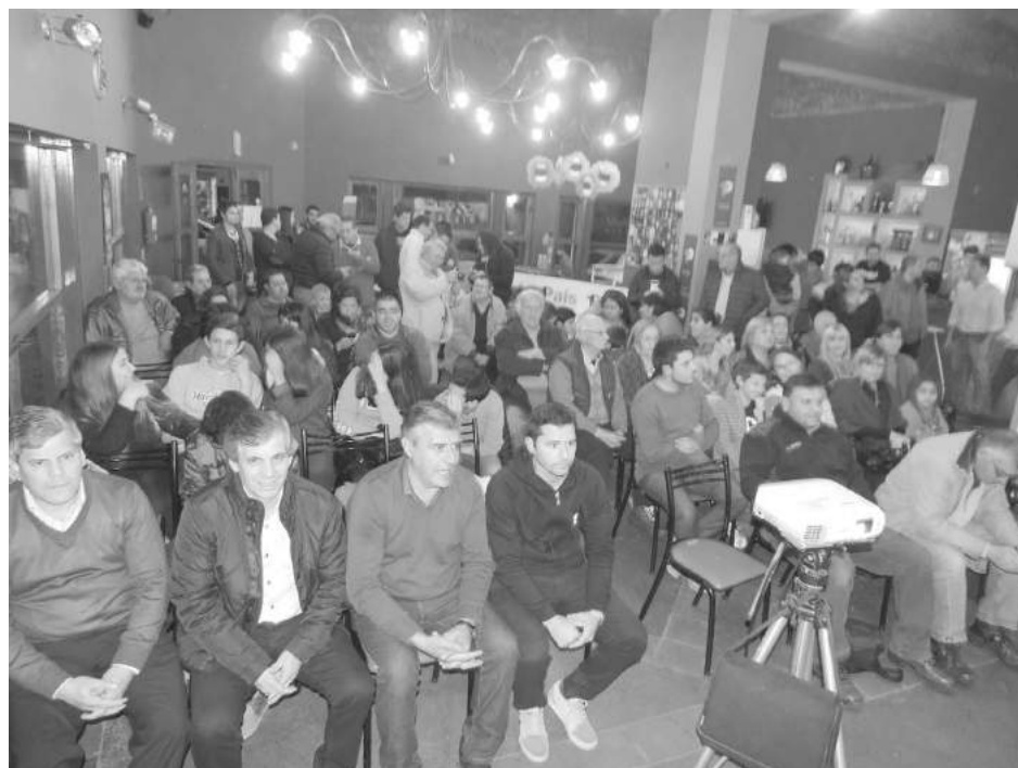
Legisladores, intendentes y vecinos presentes en el acto.

"Nuestro compromiso es poder asumir una banca a partir de octubre próximo, y desde allí trabajar a favor de la comunidad, como lo veni-