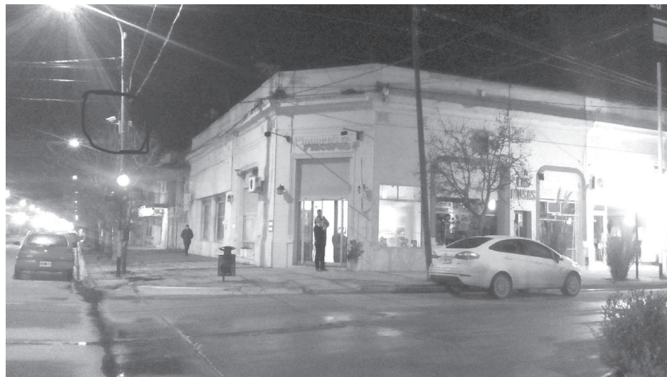
Personal policial requisita el lugar en las primeras horas de la madrugada de ayer.