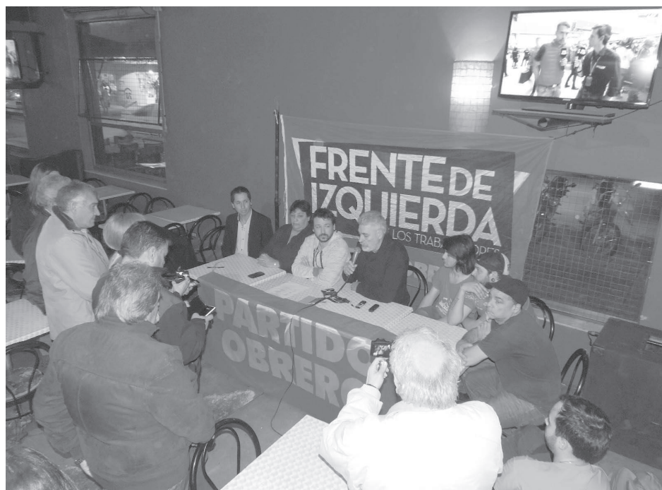
Con críticas al Gobierno la izquierda presentó la lista y lanzó la campaña.

En tanto, sobre la instancia electoral, consideró fundamental "que los vecinos tengan una voz que hoy no tienen en el Concejo Deliberante, como lo demuestra el hecho de que no hay una oposición seria".