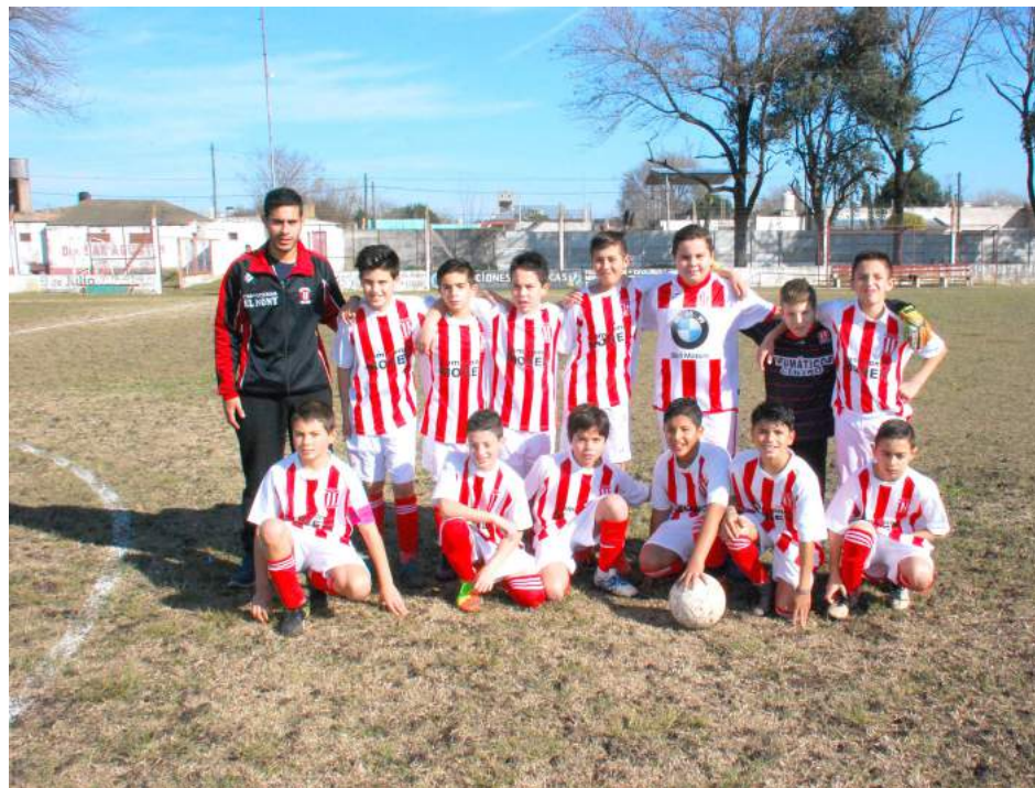
Octava División de Atlético 9 de Julio.