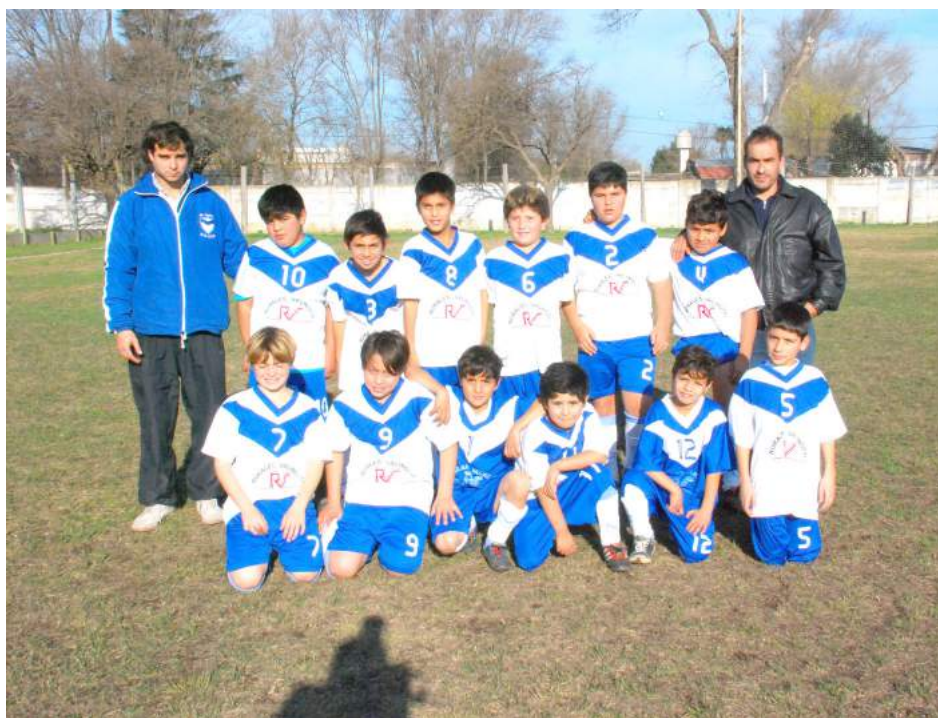
Octava División de Club y Biblioteca El Fortín.