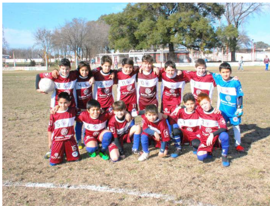
Octava División de Deportivo San Agustín.