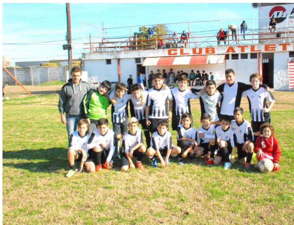
Octava División de Atlético French.