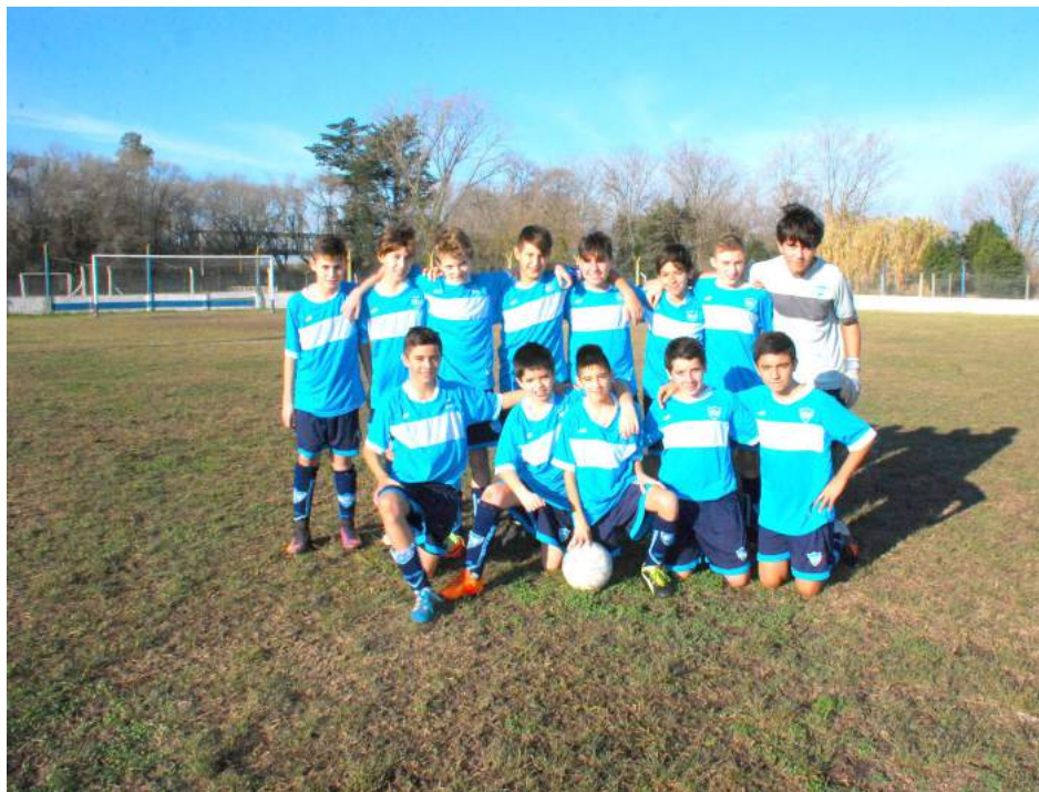
Séptima División de Atlético San Martín.