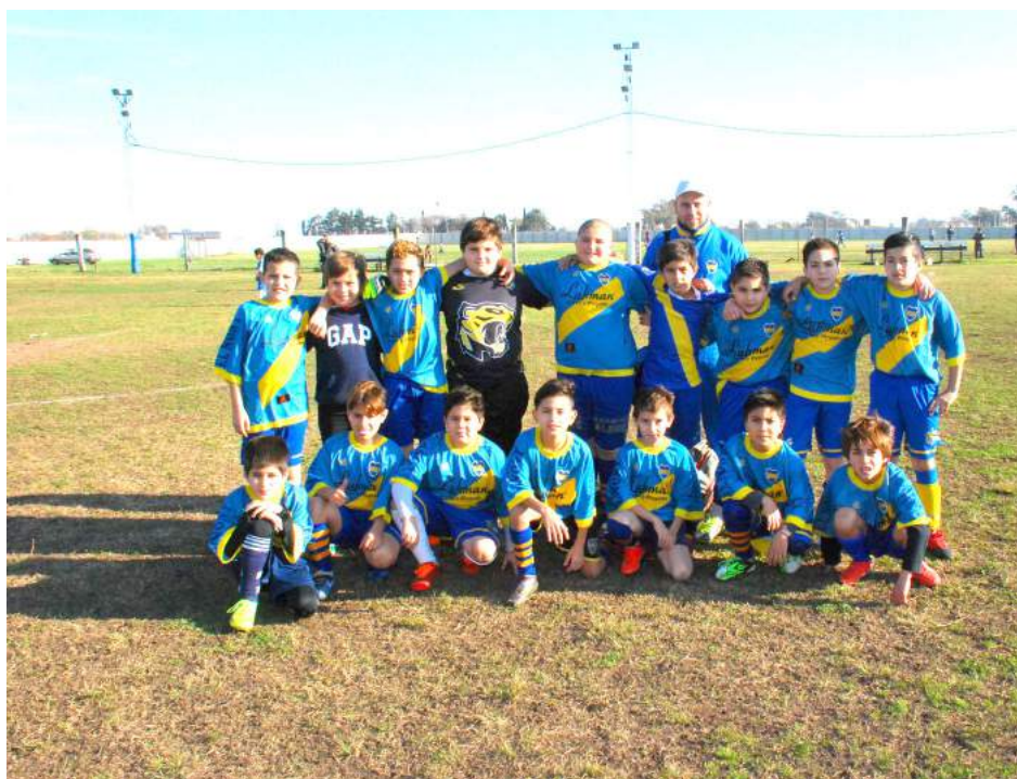
Octava División de Atlético Once Tigres.