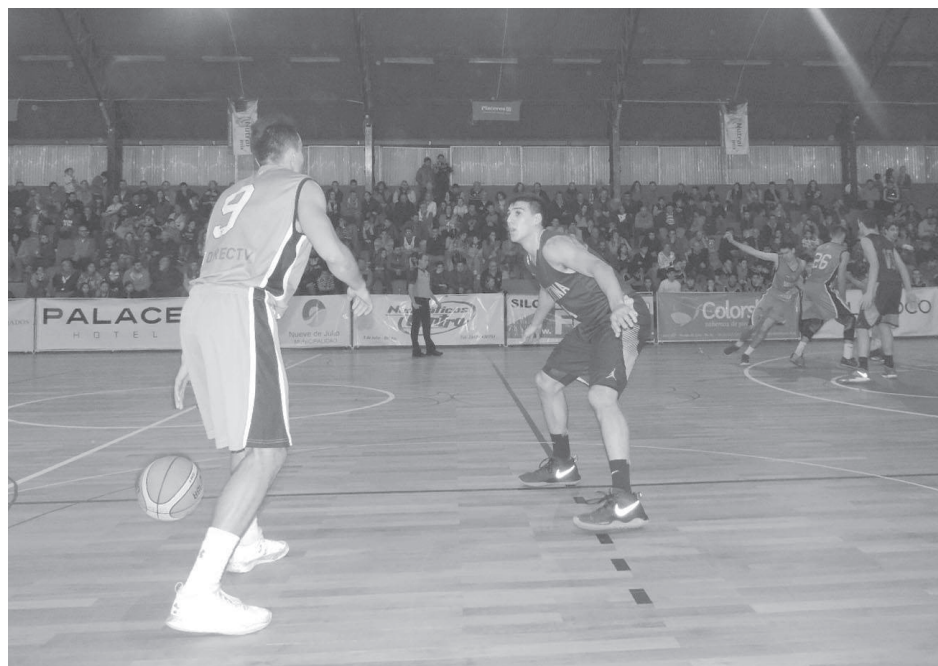
En un ajustado partido Argentina venció a Uruguay 75 a 71.