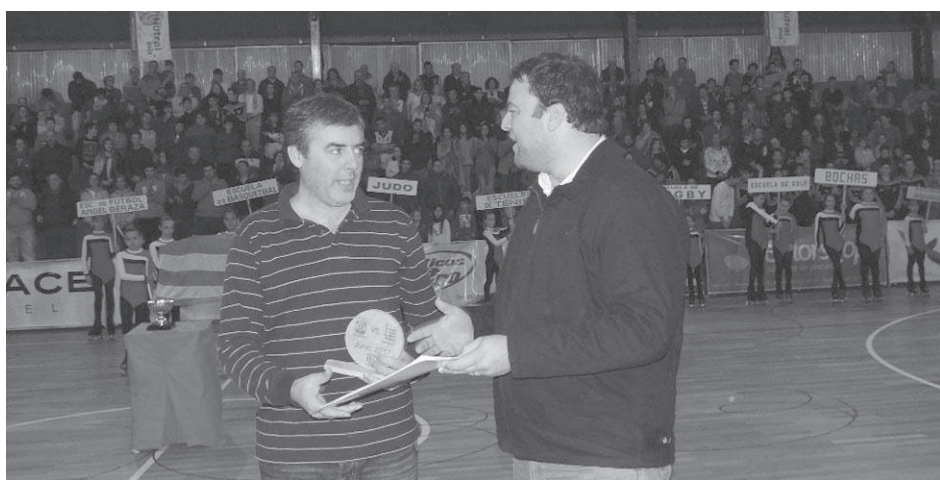
El Intendente hace entrega del Decreto De Interés al presidente del club.