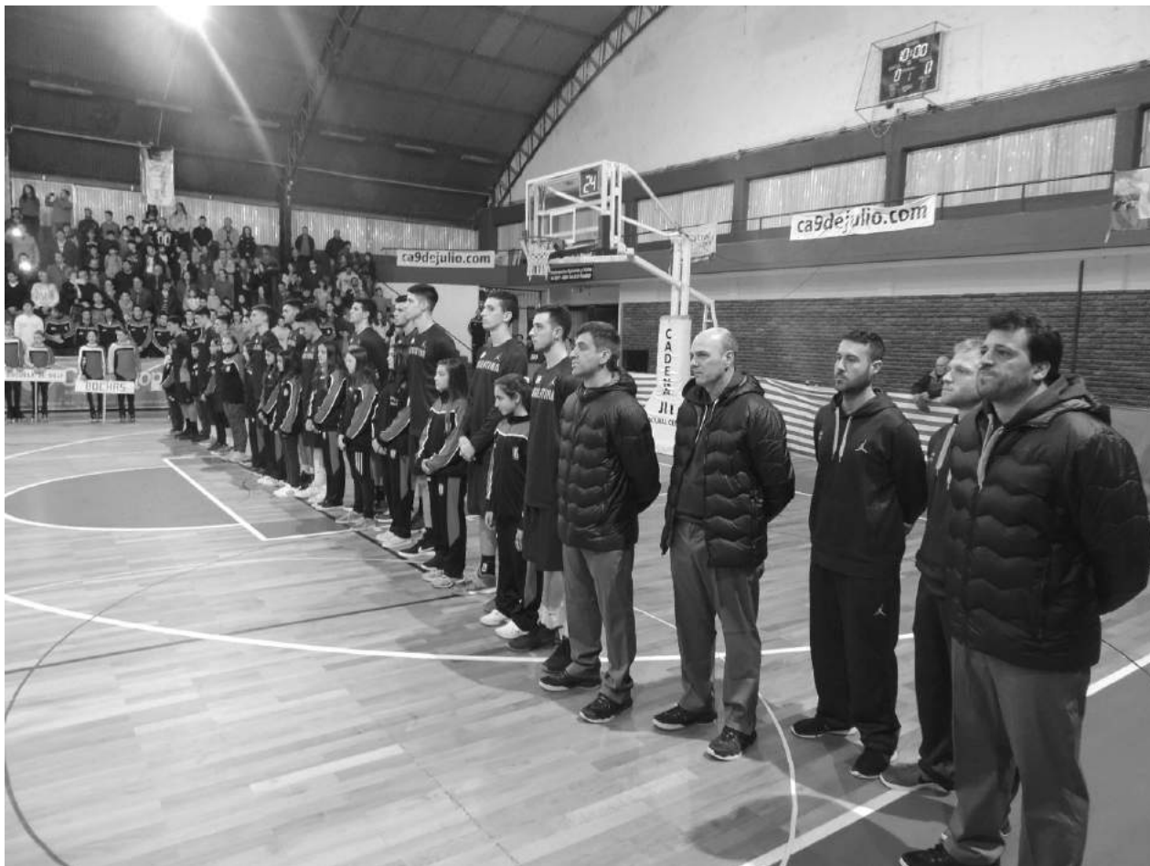
Formación del seleccionado argentino junto a chicos deportistas del club millonario.