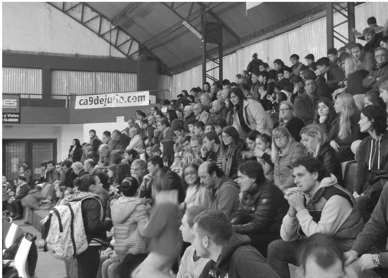
El público respondió una vez más a los eventos del Club Atlético 9 de Julio.