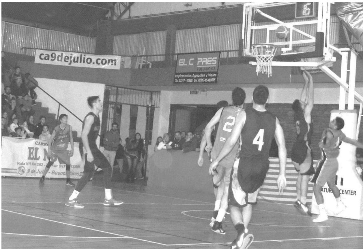
Un pasaje del partido internacional realizado en nuestra ciudad.