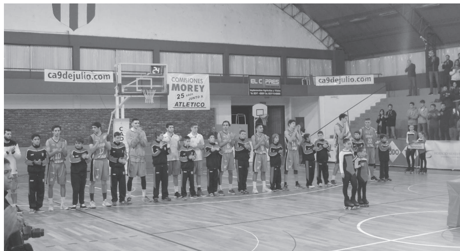
Formación del seleccionado uruguayo en el acto de inicio.