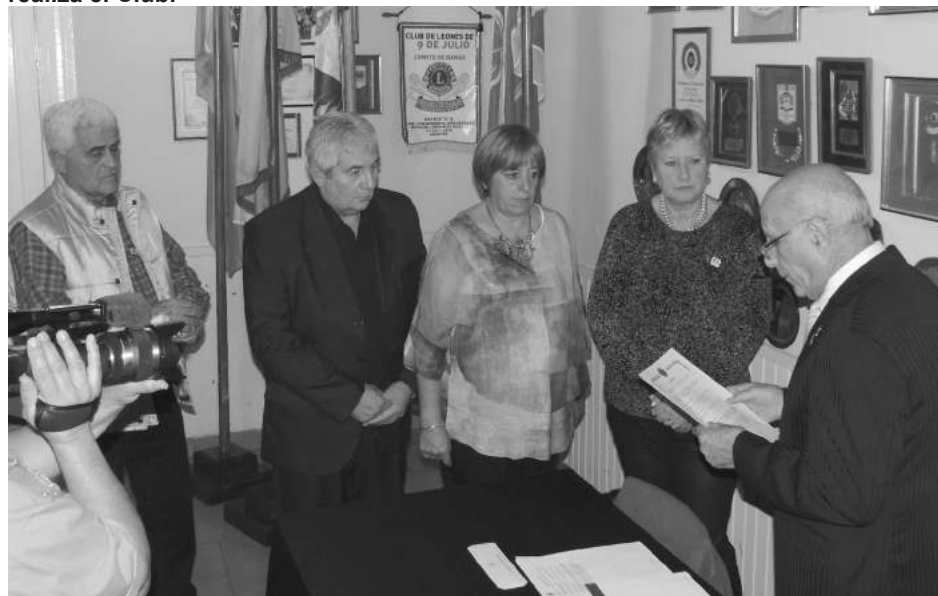
El Gobernador leonístico toma juramento a los nuevos integrantes.