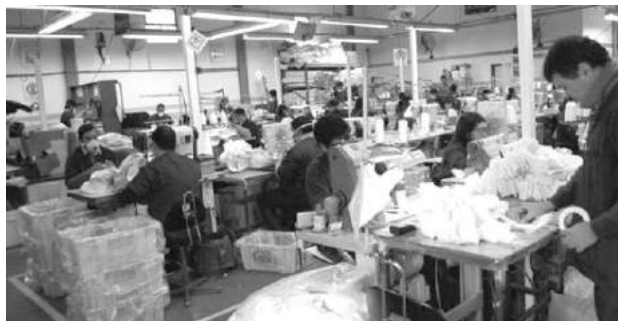
La empresa UNISOL notificó de los despidos en la mañana de este jueves.

Se trata de trabajadores de plantas ubicadas en las ciudades de Chilecito y Chamental. Entre las razones, se alega una fuerte caída en la producción y el incremento de las importaciones. En marzo, había cerrado la sede de la empresa en Sanagasta.