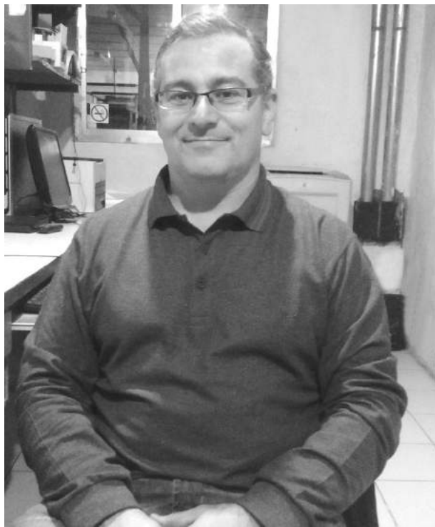
Spinetta adelantó detalles de la jornada.

ner en agenda los temas pendientes de ser analizados, a fin de presentar proyectos que brinden soluciones a las diferentes necesidades de los vecinos, para lo que contaremos con la