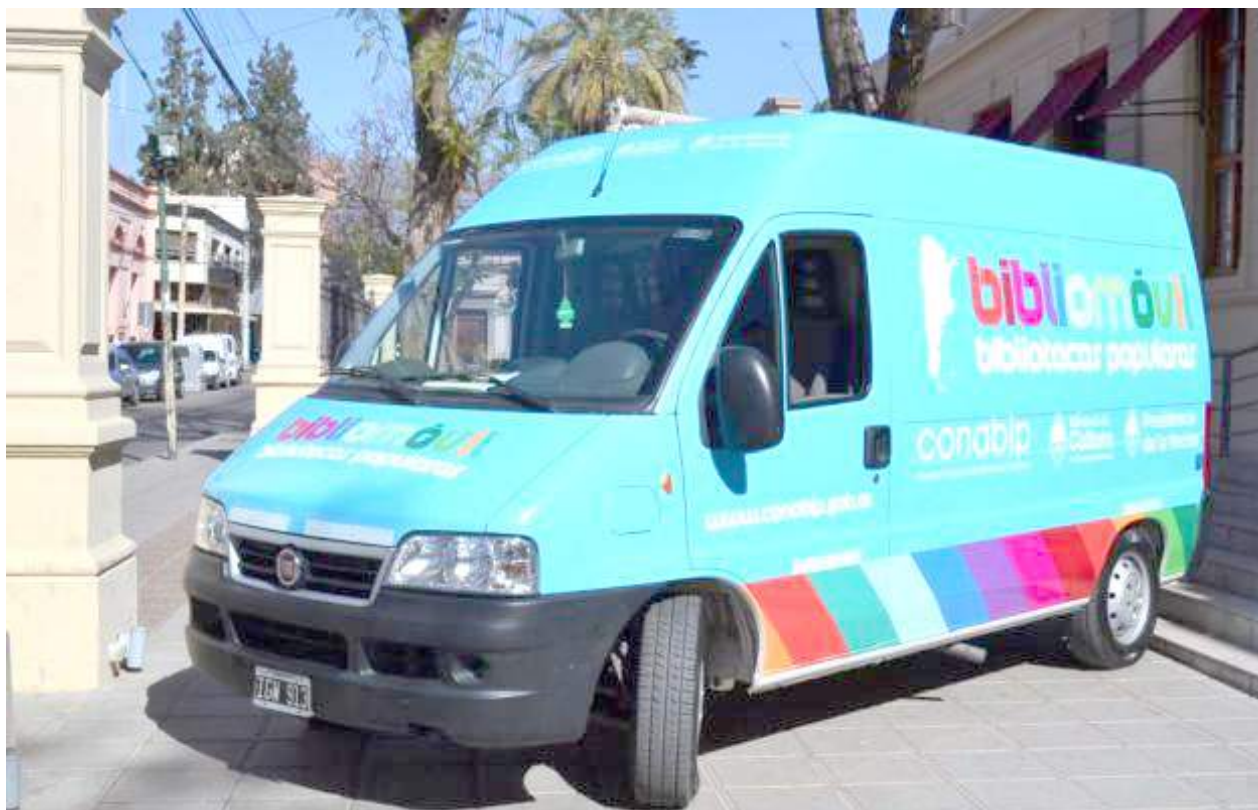
El reconocido Móvil Cultural estará visitando nuestra ciudad el mes próximo.