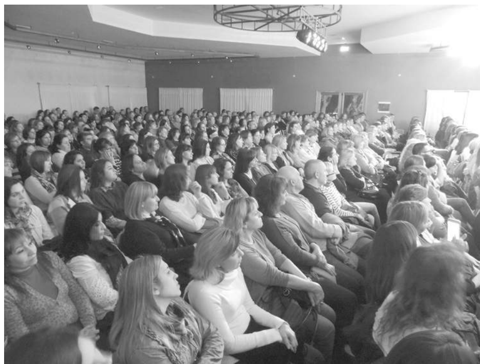
Nutrida concurrencia presenció la importante disertación de Pilar Sordo.

investigación realizada durante cuatro años, que nos ayuda a reconocer ciertas características que conformarían lo masculino y lo femenino para traspasar los géneros y encontrarnos con una nueva posibilidad de ser personas más armónicas y universales", finalizó.