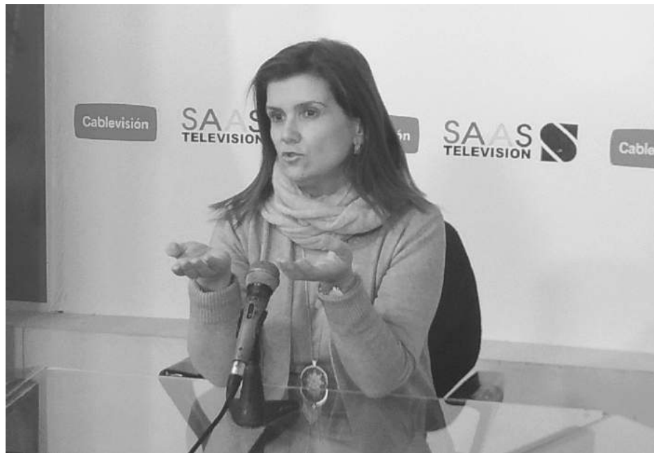
La profesional chilena en diálogo con la prensa en el estudio de CableVision.

En la noche del lunes, desde las 21 hs. se presentó en nuestra ciudad la reconocida psicóloga chilena Pilar Sordo, quien en "La Quinta de Potetti" (Ruta 5 Km. 261,9) brindó ante una muy numerosa asistencia su charla "Viva la diferencia", con el auspicio de la Municipalidad de Nueve de Julio.