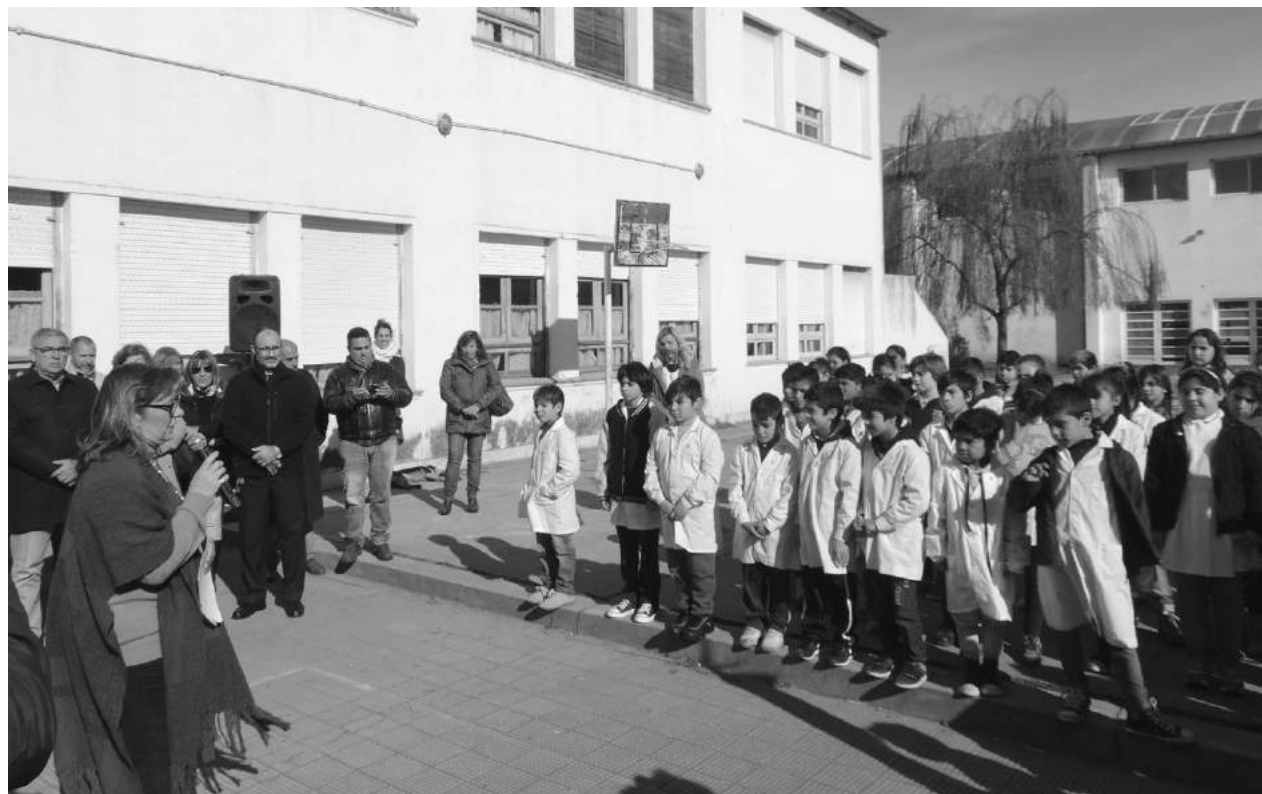
La Inspectora Jefe Distrital toma juramento a los alumnos de 4to. año de la Escuela Nro. 3.

Con motivo de la conmemoración del Día de la Bandera y del 197º aniversario del fallecimiento de su creador Gral. Manuel Belgrano, la Municipalidad de Nueve de Julio llevó adelante en la jornada de este lunes 19, en la EEP N° 3 los actos alusivos a la fecha. Inf. en Pág. 2.