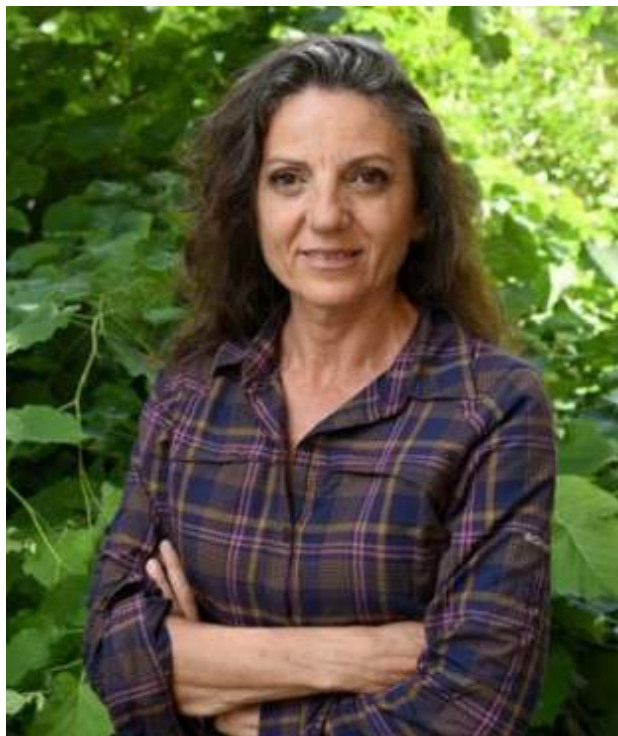
La Investigadora del Conicet, Doctora Sandra Díaz, se incorpora formalmente a la Academia de Ciencias de Francia.

La Investigadora del Conicet, Sandra Díaz integrará la sección de biología integrativa, en reconocimiento a sus aportes al campo de la ecología y el desarrollo del concepto de diversidad funcional.