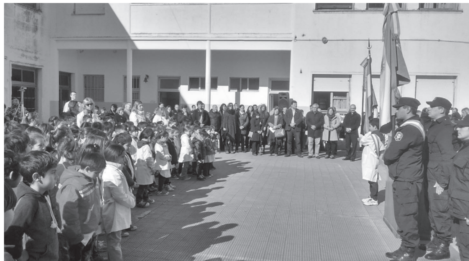
Autoridades educativas, municipales, eclesiásticas y policiales presentes en el acto.