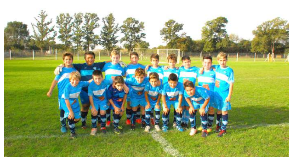
Octava División Atlético San Martín.