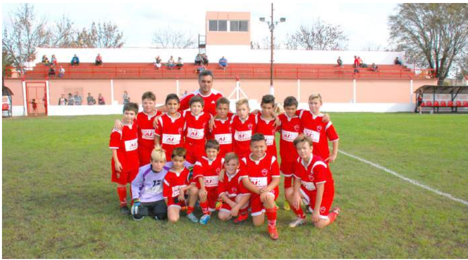
Octava División Agustín Alvarez "A"