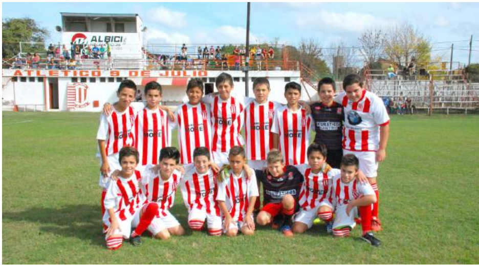
Octava División Atlético 9 de Julio "A"