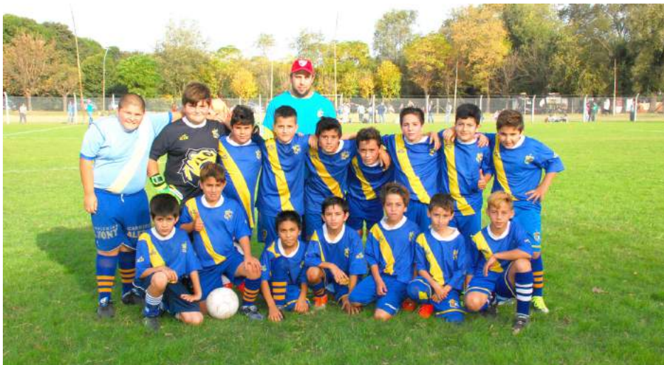
Octava División Atlético Once Tigres.