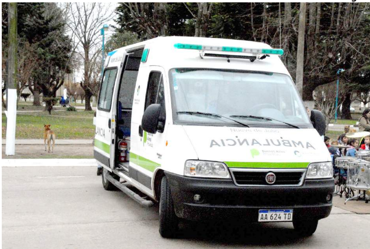
Unidad Flat de emergencia entregada a la localidad en la jornada de ayer.

YA SE EJECUTÓ EL RECAMBIO DE 150 mts 2 .