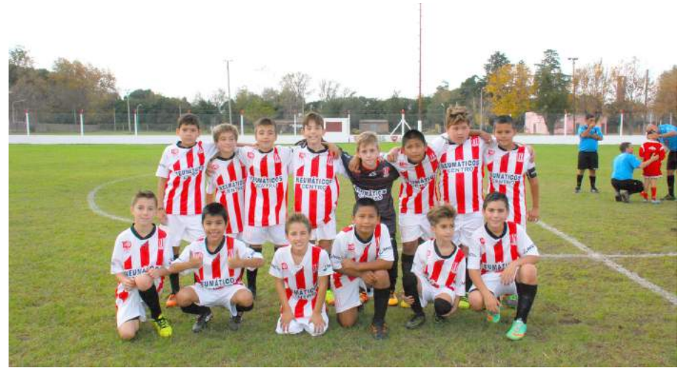
Octava División Atlético 9 de Julio "B"