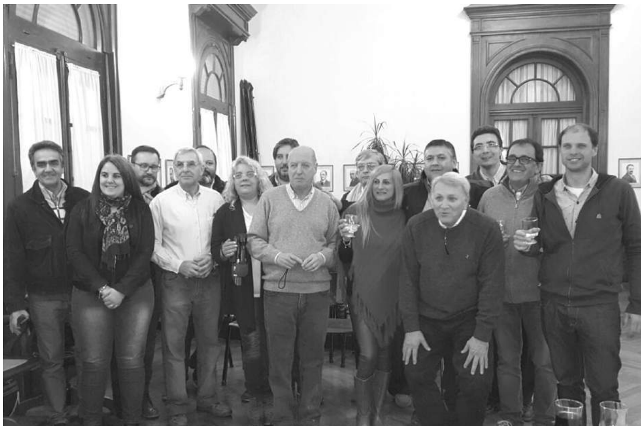
El periodismo local fue agasajado anoche por el HCD y el Ejecutivo municipal.