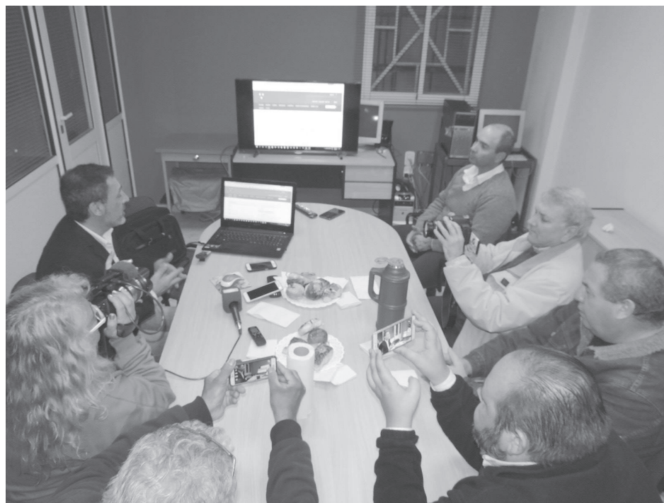
En rueda de prensa, “La Fama” presentó la venta de sus productos con el sistema on line.