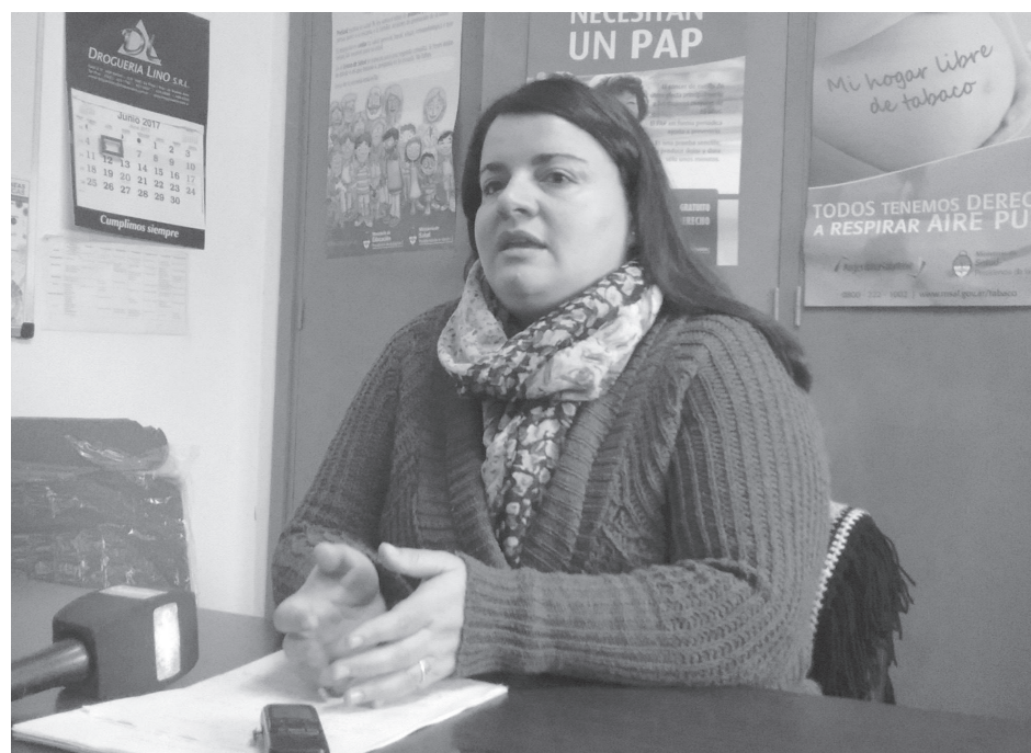
En nuestra ciudad se han dado cuatro casos de Gripe A, los que fueron controlados.

CASOS LOCALES La Dra. Pirotta confirmó el