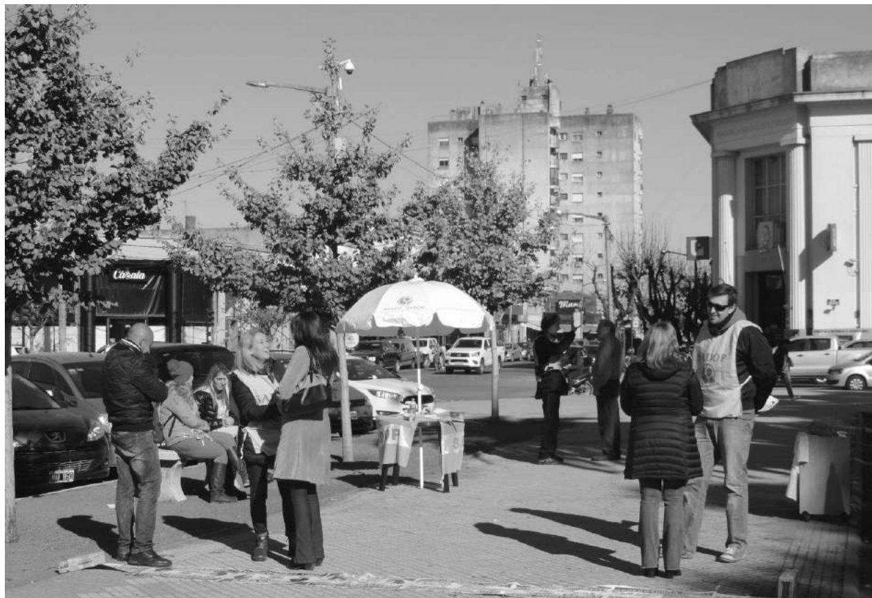
Los integrantes de SADOP 9 de Julio y otras ciudades realizaron una jornada de reclamos y reunión con Obispo.

INSTRUMENTO UNA CAMPAÑA DE DIFUSION DE PROPUESTAS