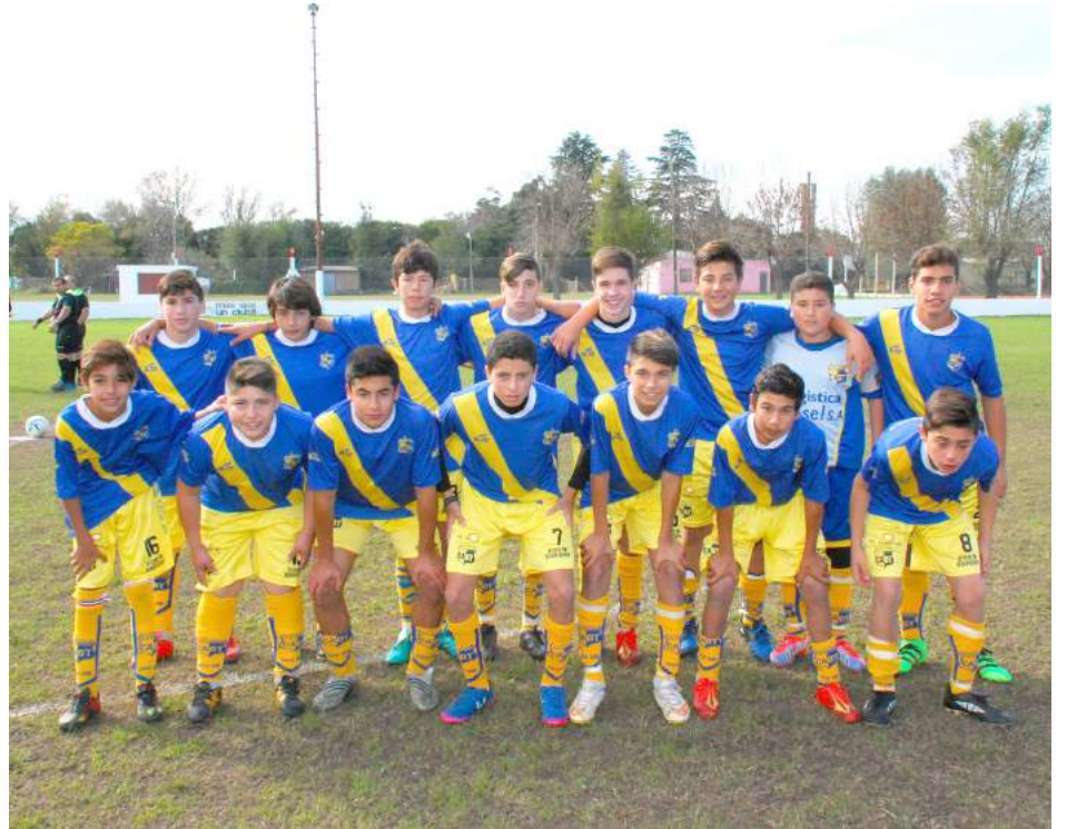
Sexta División C. A. Once Tigres.