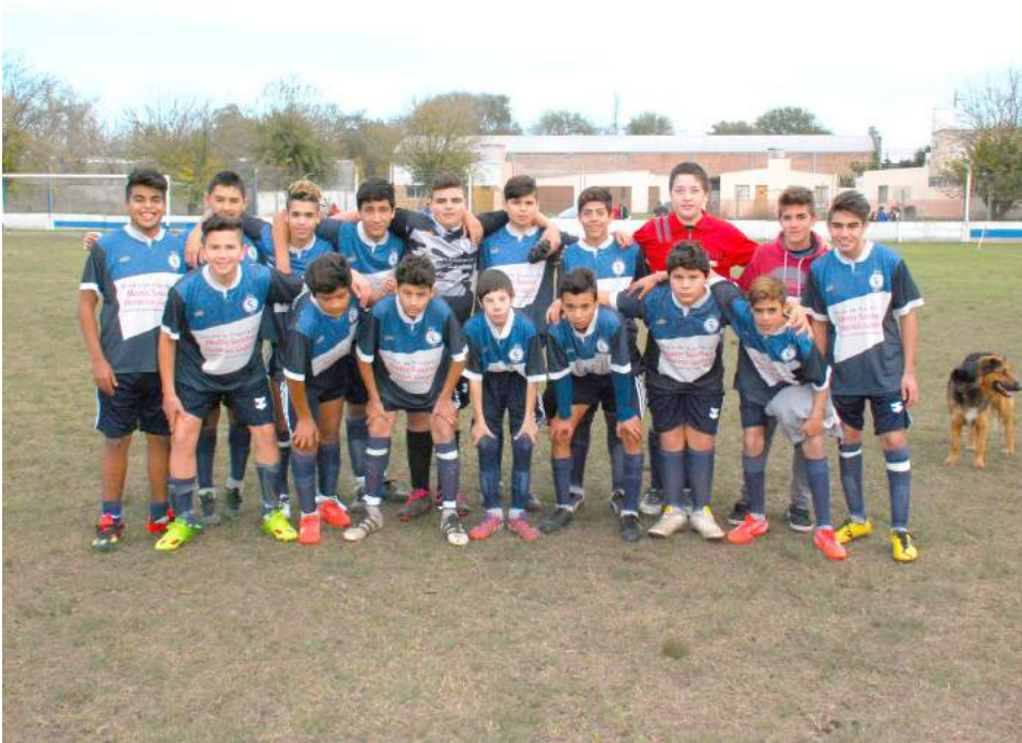
Sexta División F. C. Libertad.