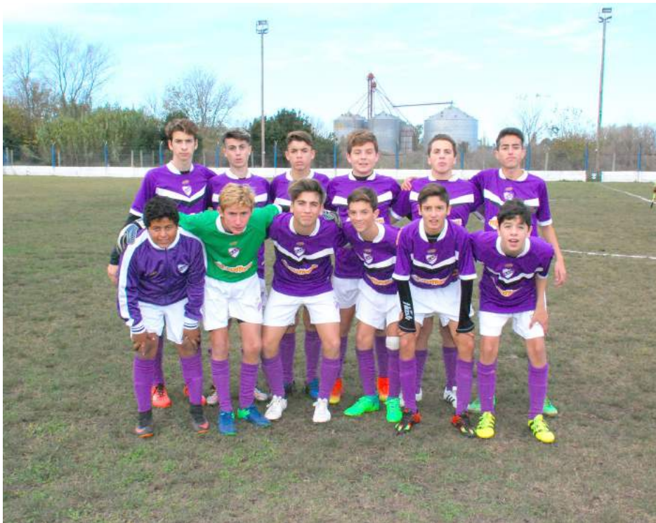
Sexta División C. A. Quiroga.