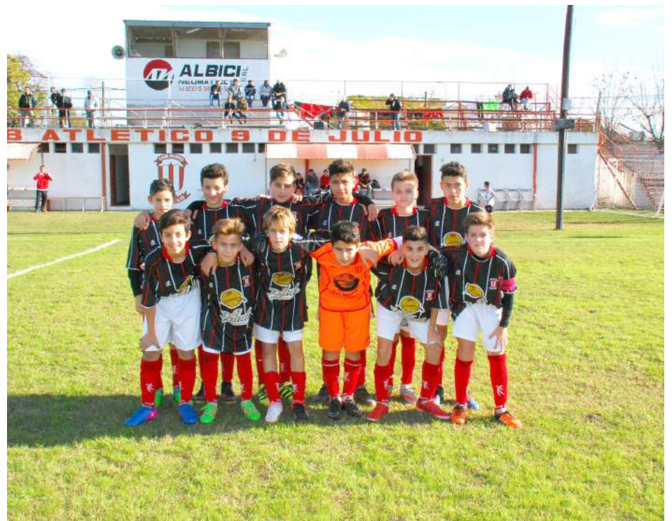
Séptima División C. A. 9 de Julio.