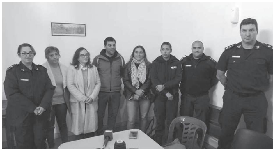
Autoridades policiales y municipales dieron detalles de los trabajos que se realizan.