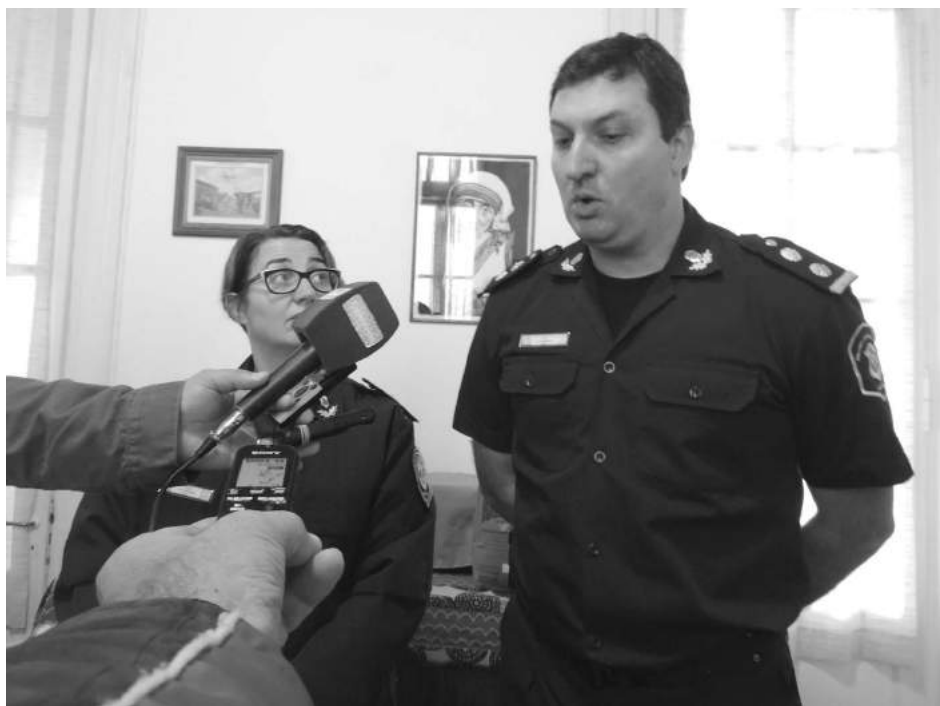
El Comisario Vázquez y la Subcomisaria Figueroa en rueda de prensa.

Como nuestro medio lo adelantara en su edición anterior, la Estación de Policía Comunal de 9 de Julio, en las primeras horas de la tarde del jueves, entre las