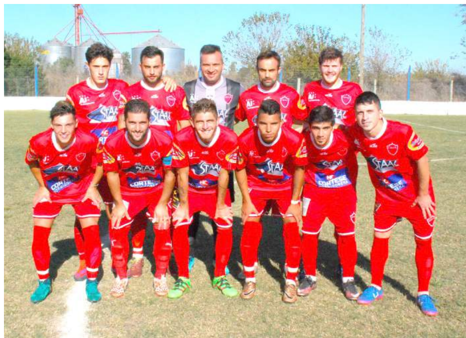
Club Agustín Alvarez.