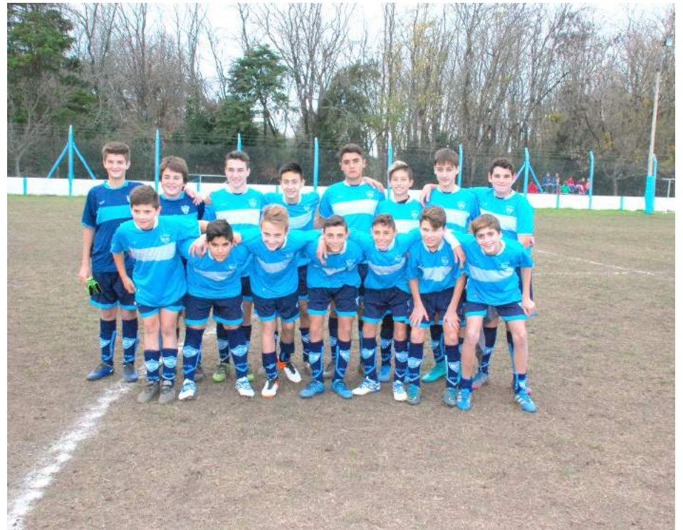
Sexta División C. A. San Martín.