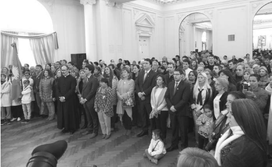
El acto patrio debió realizarse en el Salón Blanco del Palacio Municipal.

esperanza, aspirando a pequeños avances; hoy todavía con muchísimas dificultades aun por vencer y superar, tenemos la extraordinaria posibilidad de concretar montones de obras que hasta hace unos meses hubiesen sido impensadas; además tenemos una opinión general que recuperó la esperanza de que se puede vivir mejor, ese gran logro tenemos que acompañarlo, concretarlo, no podemos fallar, ésa es nuestra meta, que la espe-