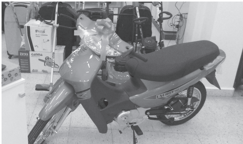
Moto Energy 110 que será sorteada con los cupones de abril y mayo.

Depósito en Buenos Aires Uspallata 2638 casi Av. Colonia Tel./Fax: 011-4942-6684