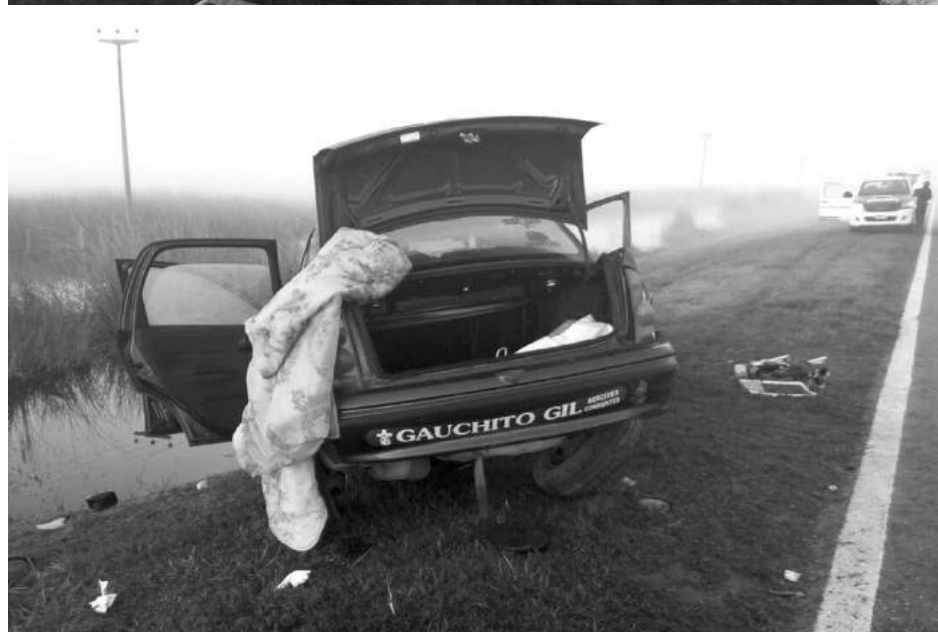
Cuatro nuevejulienses protagonizaron el grave accidente en Ruta 5 Km. 238.

Conocé los nuevos audífonos de Tecnología Alemana