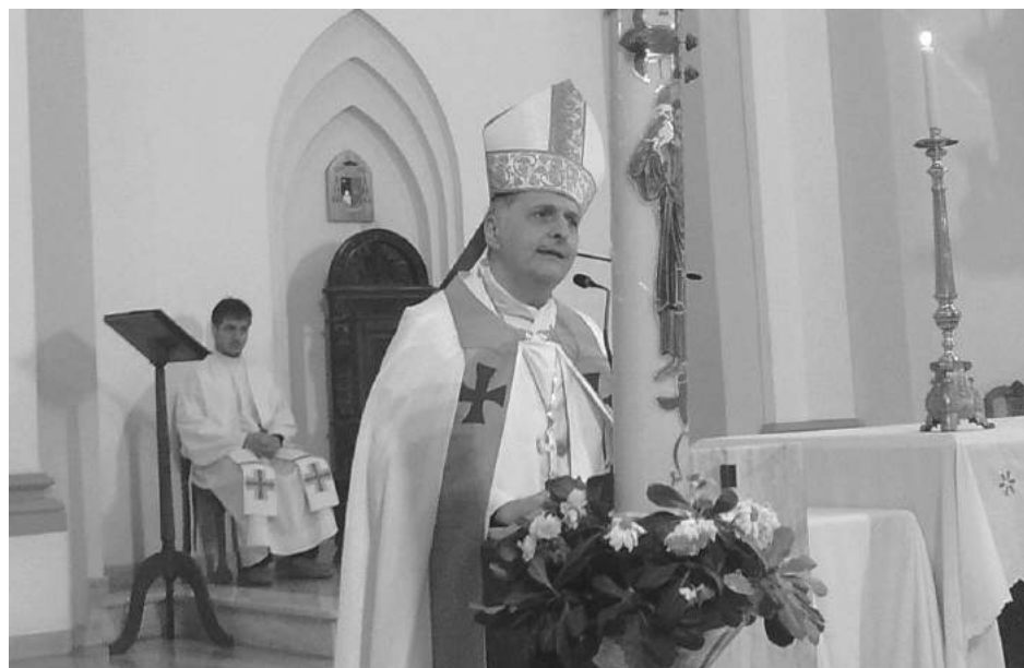
El Obispo durante el Tedeum pidió que se tiene que dar un "pacto ciudadano".

Pero si bien es importante conocer la historia, la semana de mayo, las idas y vuel-