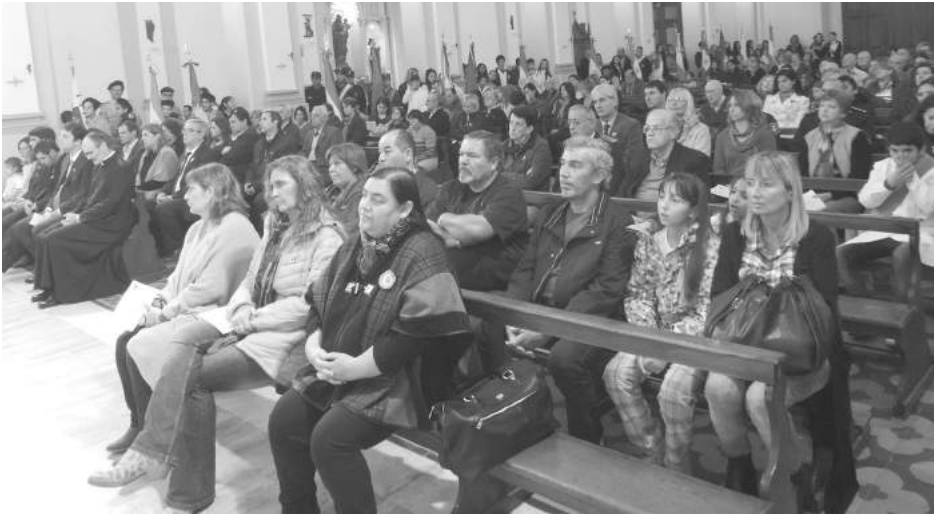
Autoridades políticas, educativas, de entidades e instituciones en Iglesia Catedral.