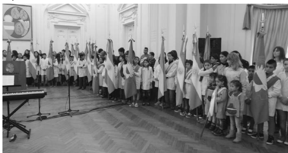
Importante concurrencia de escuelas con sus respectivas banderas de ceremonias.