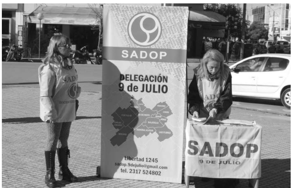
El gremio sigue el reclamo en defensa de los docentes.