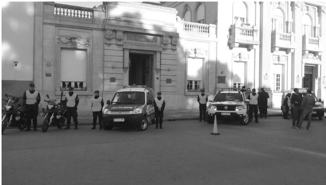
Los vehículos, tres automotores y dos motocicletas, fueron presentados frente al Palacio Municipal.