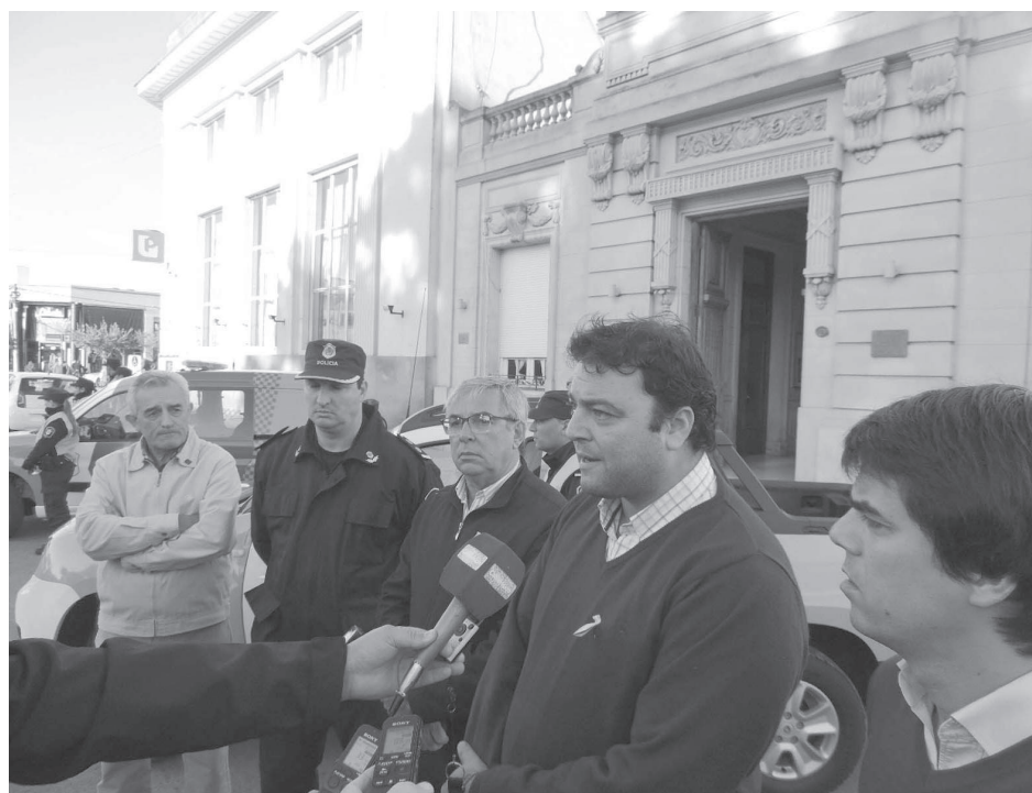
Autoridades policiales dieron detalles a los medios de prensa.

“Desde que iniciamos nuestra gestión se ha incorporado una nueva camioneta para la Patrulla Rural, dos camionetas para la Policía Comunal, dos motocicletas y dos nuevas unidades, a lo que se suma también la incorporación de 15 nue-