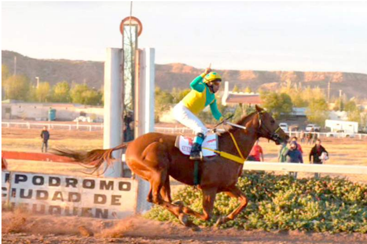
Sharper cruza el disco el el primer lugar con sobrada ventaja sobre su retador Resistiré.

En la tarde ayer, se corrió el mano a mano entre dos caballos calificados ligeros Sharper vs Resistiré premio Gran Clásico Revolución de Mayo, en el hipódromo del Jockey Club de Neuquén.