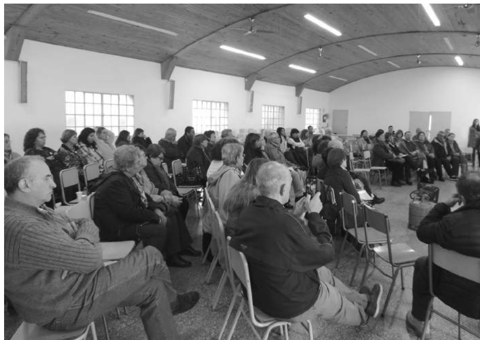
Integrantes de Cáritas Diocesana de todas las ciudades integrantes de la Diócesis reunidos el pasado sábado en 9 de Julio.

La jornada se desarrolló en el salón de la capilla de Sagrado Corazón y comenzó por la mañana con una misa presidida por monseñor Ariel Torrado Mosconi. Allí el prelado convocó a los representantes parroquiales a escuchar la voz de Dios y a no restringir su labor a la sólo asistencia con bolsones de alimentos y ropa a las familias necesitadas, sino a estar atentos a las nuevas formas de pobreza y necesidades de promoción humana que hoy se presentan como desafíos. También los exhortó a sumar colaboradores a la institución y a no dejarse llevar por el desaliento que provocan las limitaciones e ingratitudes cotidianas. Posteriormente el prelado abrió la jornada donde aprovechó la oportunidad para recordar su firme intención que las parroquias avancen en la conformación de los centros de atención de adicciones, también llamados centros barriales u Hogares de Cristo. Justamente en este sentido se resaltó la labor del padre Germán Lorient quien conformó el primero de ellos en la localidad de Pellegrini y el que cuenta ya con 16 colaboradores. En este sentido Monseñor Torrado Mosconi insistió en que es urgente que la Iglesia responda al llamado del Papa a ser una Iglesia cada vez más abierta a la comunidad y "en salida" que esté atenta a las nuevas formas de pobreza y a