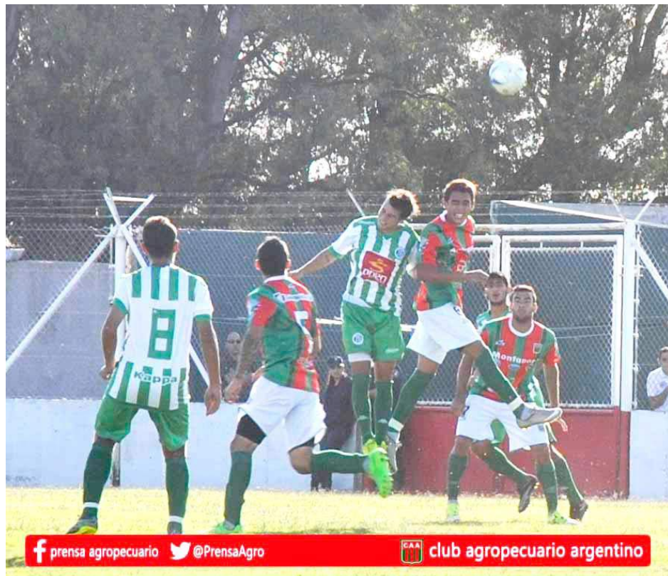
f prensa agropecuario @PrensaAgro club agropecuario argentino

El plantel del Gimnasia y Tiro de Salta, alojado en nuestra ciudad con vista al partido de hoy con Agropecuario, entrenó ayer en la cancha de Agustín Álvarez.