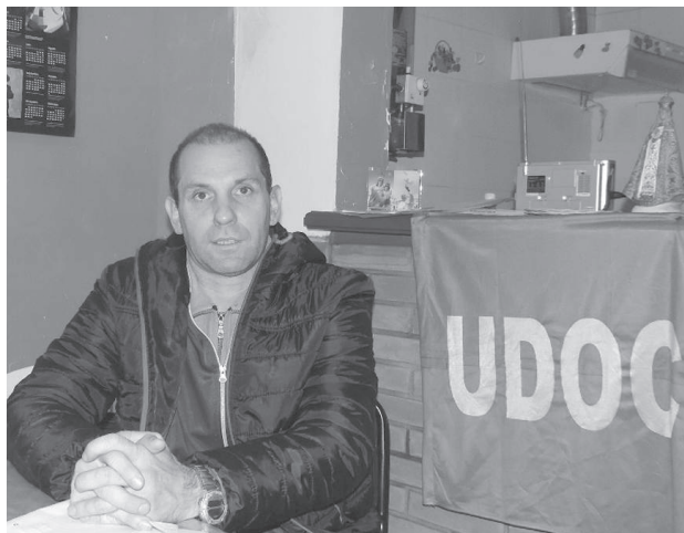
Bazzetta dijo que el gremio sigue con el permanente reclamo docente sin tener respuesta.

Depósito en Buenos Aires Uspallata 2638 casi Av. Colonia Tel./Fax: 011-4942-6684