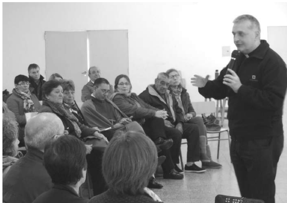
El Obispo dio la bienvenida a los presentes y pidió que se trabaje en el mensaje del Papa sobre la ayuda al otro.