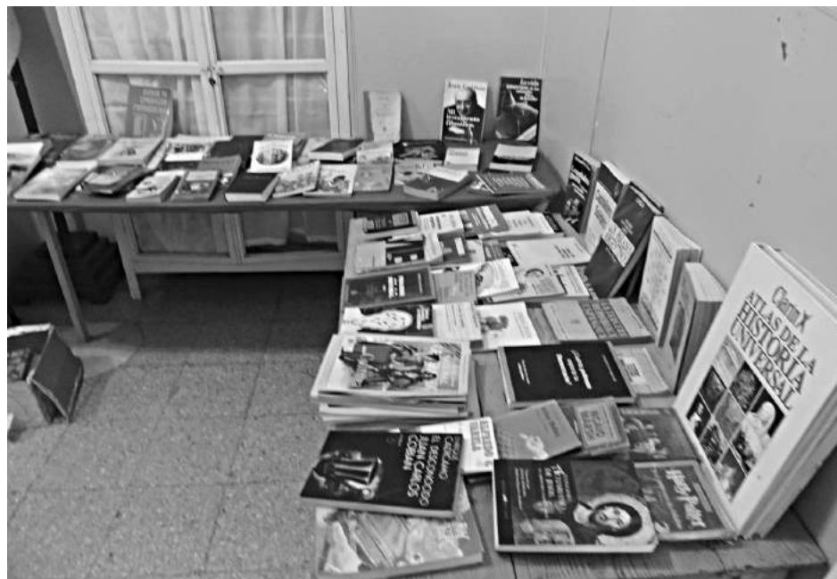
Una nueva feria realizó la Biblioteca el 16, 17 y 18 del corriente.

La Feria es un clásico de la Biblioteca y numerosos lectores esperaban esta oportunidad para disfrutar de literatura de su gusto e interés.