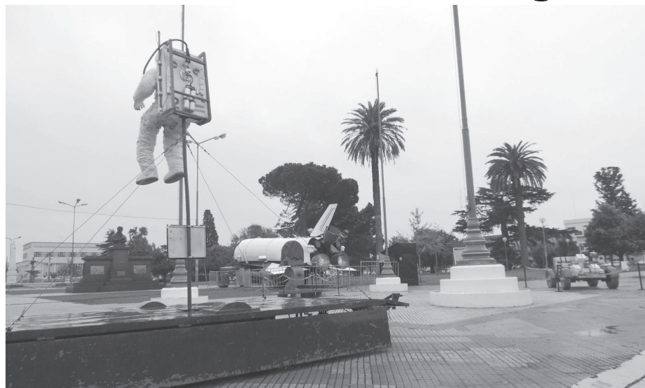
El importante proyecto educativo ya se encuentra en Plaza Belgrano.