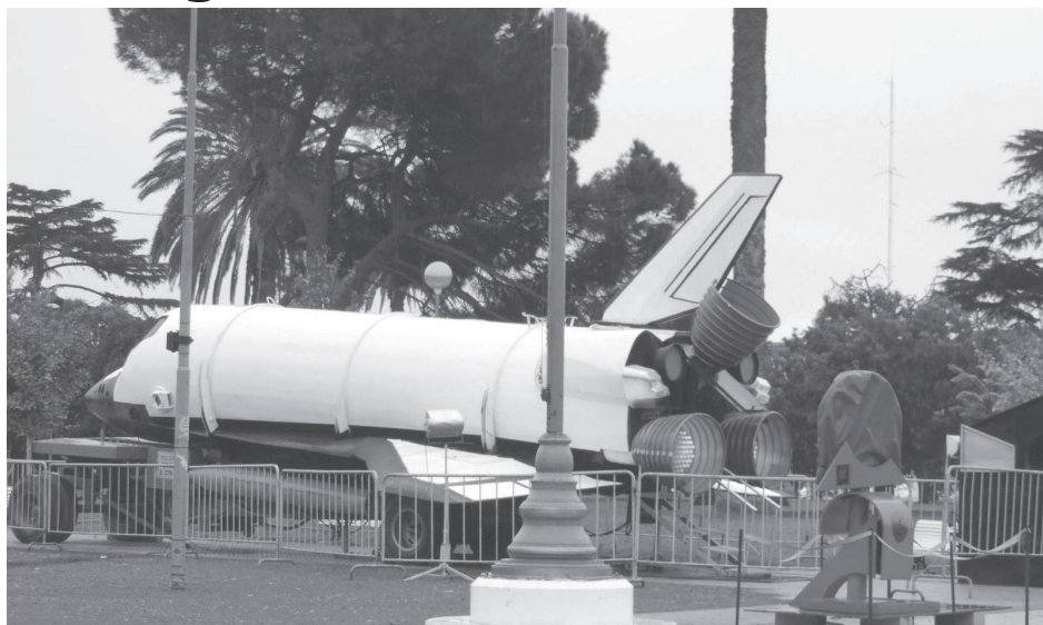
Imagen de la imponente nave espacial ubicada en el centro de la ciudad.