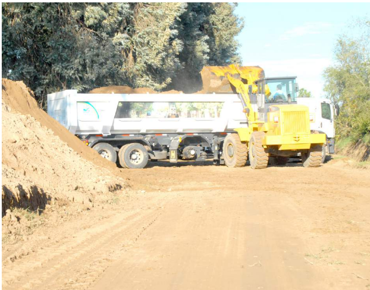
Maquinarias realizan el trabajo en calle Moreno.