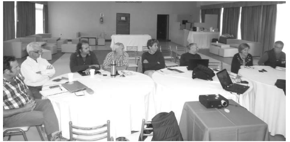
Directores de INTA de una amplia zona de la región estuvieron en 9 de Julio.

"En 9 de Julio siempre se observan buenos resultados que marcan una trayectoria y una labor de muchos años que todos debemos reconocer y que se convierte en un ejemplo para otras agencias", su-