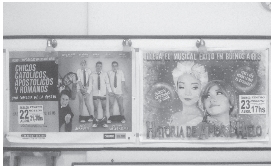
Cartelera que promociona los eventos de hoy sábado y mañana domingo.

En lo que respecta a cine, la institución continúa llevando adelante gestiones para adquirir el proyector digital que se requiere para reactivar esta actividad, no obstante que se conoce que los mis-