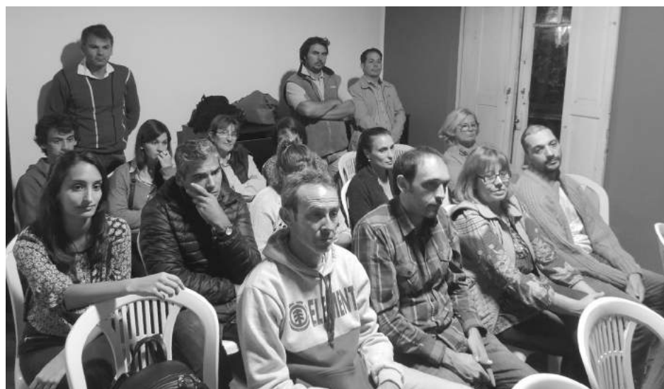
Asistentes a la asunción de autoridades del GEN.