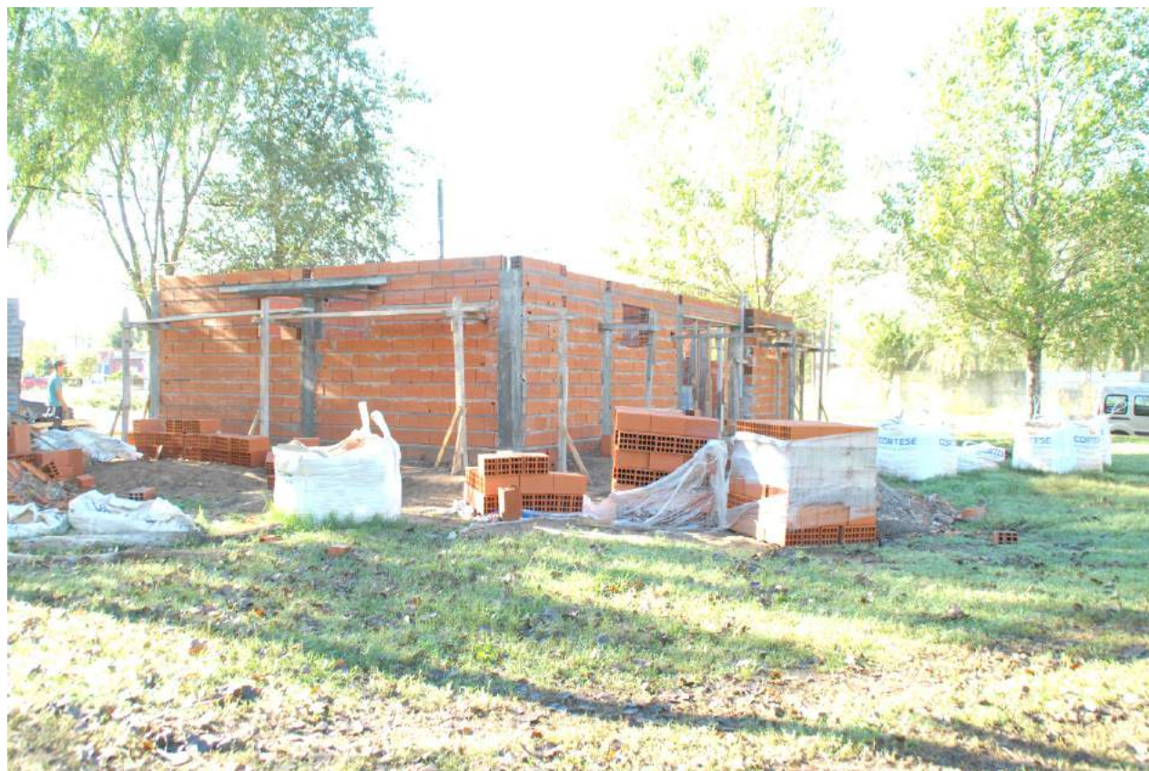
Vista de los trabajos que lleva adelante el municipio.