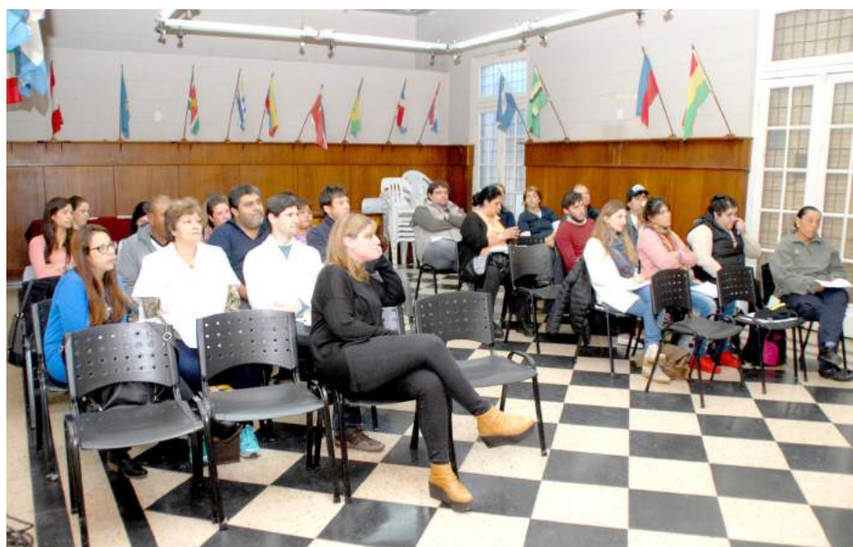
Personal municipal que participó de la capacitación.

tará con demarcaciones de canchas de basquet, voley, fútbol reducido y handball reducido.