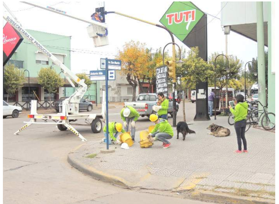
El importante proyecto educativo que lleva adelante el establecimiento ha llegado a ponerse en funcionamiento en ciudades vecinas.

La Escuela de Educación Secundaria Técnica Nro. 2 "Mercedes Vázquez de Labbé" sigue avanzando con pasos muy firmes en su tarea de construcción de semáforos inteligentes, instancia que ha superado ampliamente los límites de nuestro distrito, extendiéndose a otros partidos de nuestra provincia.