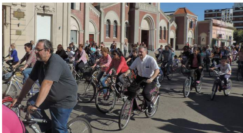
La tradicional bicicleteada realizada el pasado viernes recorriendo las capillas de nuestra ciudad.

cubrió en tres etapas el crucifijo que, sacerdotes y fieles, uno a uno fueron besando. También se veneró la imagen de María y se recordó el sufrimiento que padeció como madre del hijo de Dios.