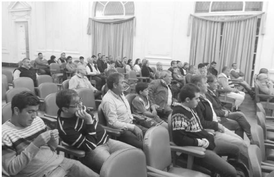
Técnicos, jugadores y particulares presentes en la charla.

En su exposición fue duro con los árbitros actuales, la FIFA y la AFA - "En los albores del fútbol se acudió a la persona humana, al árbitro, como garante de un reglamento, pero actualmente y después de tantos años nos hemos dado cuenta de que lo humano ya no nos brinda esa confiabilidad."