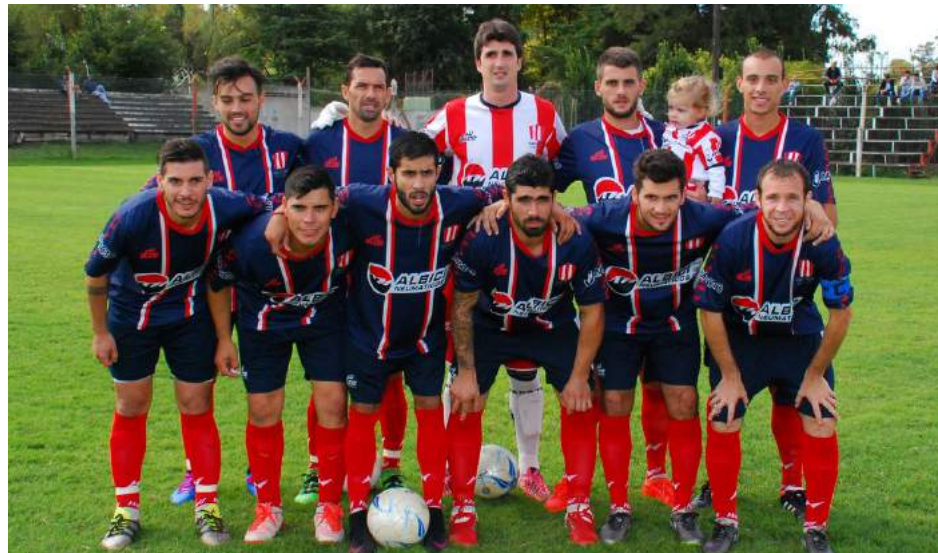
Atlético 9 de Julio.