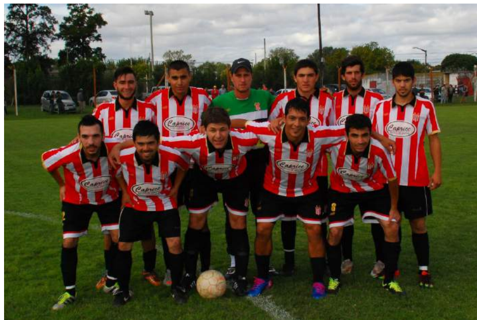
Social y Deportivo Dudignac.