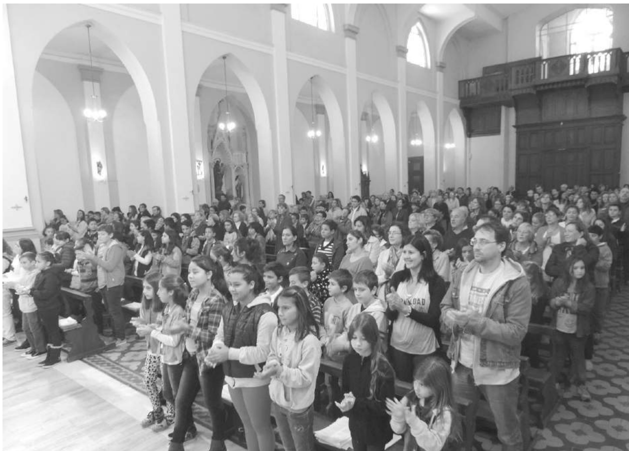
Ceremonia religiosa del domingo de Pascua en Iglesia Catedral.