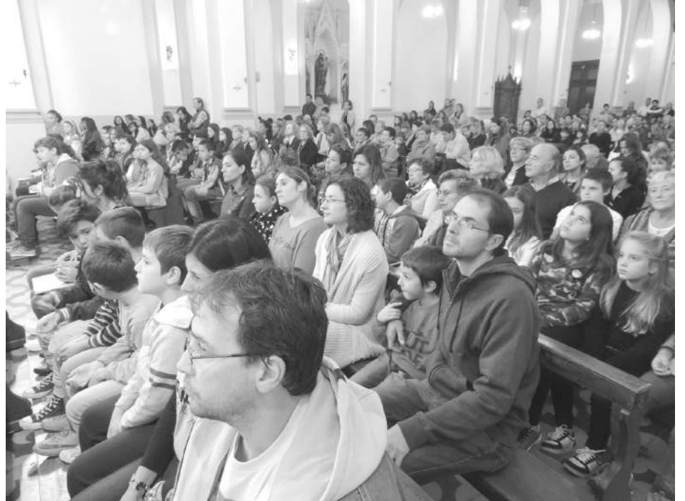
Chicos y grandes presentes en la celebración de la Pascua.

La Pascua, también llamada Domingo de Resurrección es la fiesta central del