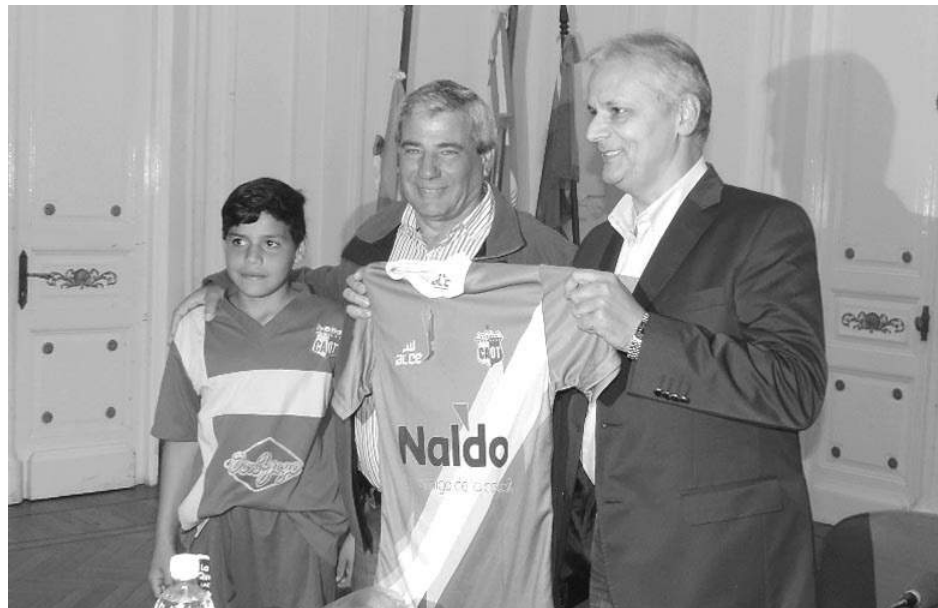
El presidente de Once Tigres y un pequeño jugador en tregan una camiseta del club a Castrilli.

Consultado inicialmente sobre la aplicación y el uso de